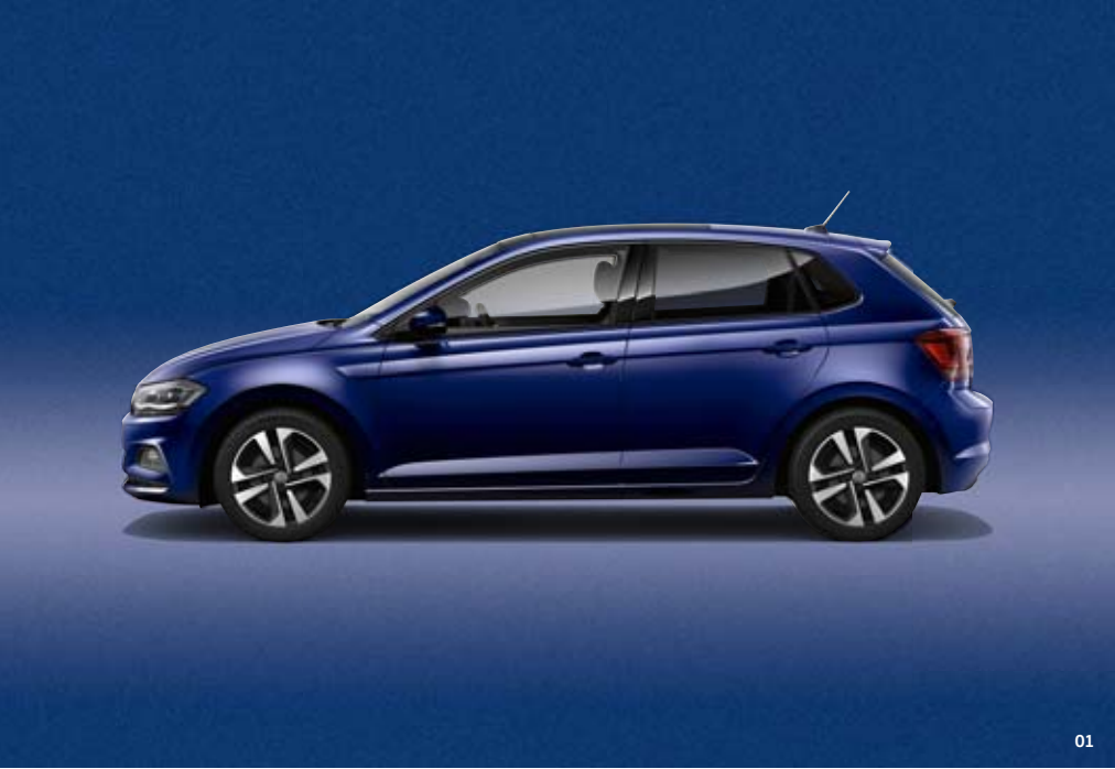
01 Atlantic Blue Metallic-Lackierung H7 : Polo UNITED SO (ohne Abb.) Atlantic Blue Metallic-Lackierung H7 : up! UNITED, e-up! UNITED, Golf Variant UNITED, Golf Sportsvan UNITED, Tiguan Allspace UNITED, Touran UNITED, Sharan UNITED, T-Roc UNITED, T-Cross UNITED, Polo UNITED R-Line, Golf Variant UNITED R-Line, Touran UNITED R-Line, Tiguan Allspace UNITED R-Line, T-Roc UNITED R-Line, T-Cross UNITED R-Line SO

Die Fahrzeuge auf dieser Seite dienen zur exemplarischen Abbildung der Lackierungen und verfügen nicht über alle sondermodellspezifischen Umfänge. Über weitere mögliche Lackierungen der jeweiligen Modelle informiert Sie Ihr Volkswagen Partner gern. Die Abbildungen auf dieser Seite können nur Anhaltspunkte sein. Die Druckfarben können die Lackierungen nicht so wiedergeben, wie sie in Wirklichkeit sind.