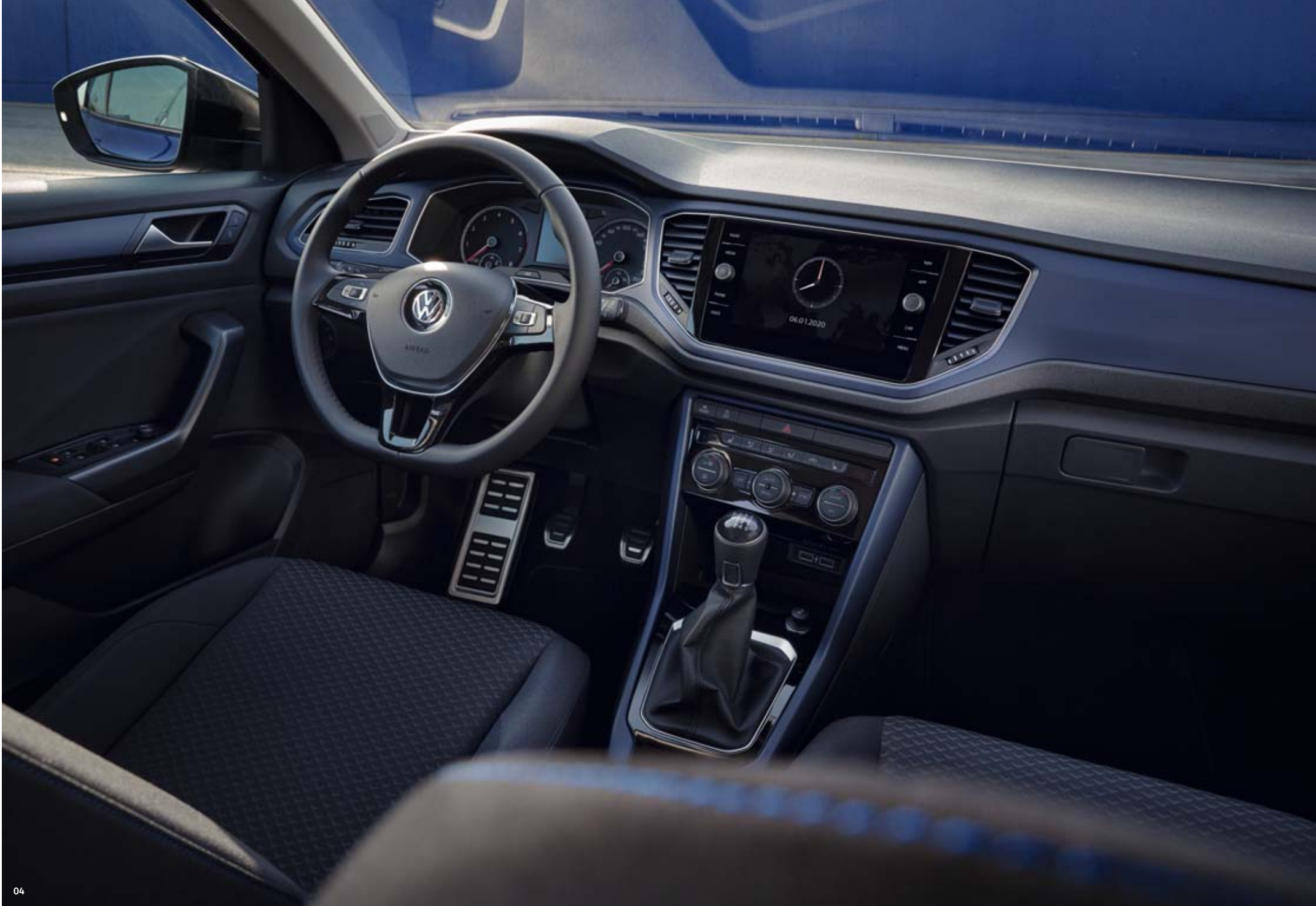
04 Den Sound im Ohr. Die Route vor Augen. Mit dem serienmäßigen Navigationssystem „Discover Media“ . Freuen Sie sich auf das 20,3 cm (8 Zoll) große TFT-Farbdisplay mit Touchscreen mit Annäherungssensorik, sechs Lautsprecher, einen MP3-fähigen CD-Player, SD-Kartenslots, eine USB-Schnittstelle u. v. m.