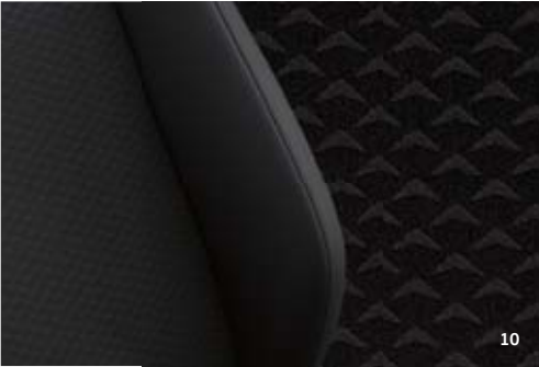
02 Stoff „Waveform“ Titanschwarz: up! UNITED, e-up! UNITED SS 03 Stoff „Waveform“ Titanschwarz: T-Roc UNITED SS 04 Stoff „Waveform“ Titanschwarz: Polo UNITED SS 05 Stoff „Waveform“ Titanschwarz: Golf Sportsvan UNITED SS 06 Stoff „Waveform“ Titanschwarz: Sharan UNITED SS 07 Stoff „Waveform“ Titanschwarz: Touran UNITED SS 08 Stoff „Waveform“ Titanschwarz: T-Cross UNITED SS 09 Stoff „Waveform“ Titanschwarz: Tiguan Allspace UNITED SS 10 Stoff „Waveform“ Titanschwarz: Golf Variant UNITED SS

Die Abbildungen auf dieser Seite können nur Anhaltspunkte sein. Die Druckfarben können die Sitzbezüge nicht so wiedergeben, wie sie in Wirklichkeit sind. Die Abbildungen der Sitze zeigen die Basissitzform des Modells und können von einer ggf. wählbaren höherwertigen Variante abweichen.