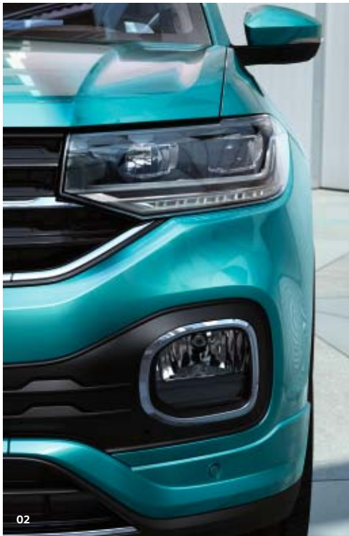
02 Fahren Sie als leuchtendes Beispiel voraus: Die LED-Scheinwerfer des neuen T-Cross bleiben durch ihre prägnante Signatur im Gedächtnis – besonders das integrierte LED-Tagfahrlicht in dynamischer Hockeyschläger-Form. Eyecatcher ist das o-förmige Chromelement im Stoßfänger, das das Abbiegelicht umschließt. ST