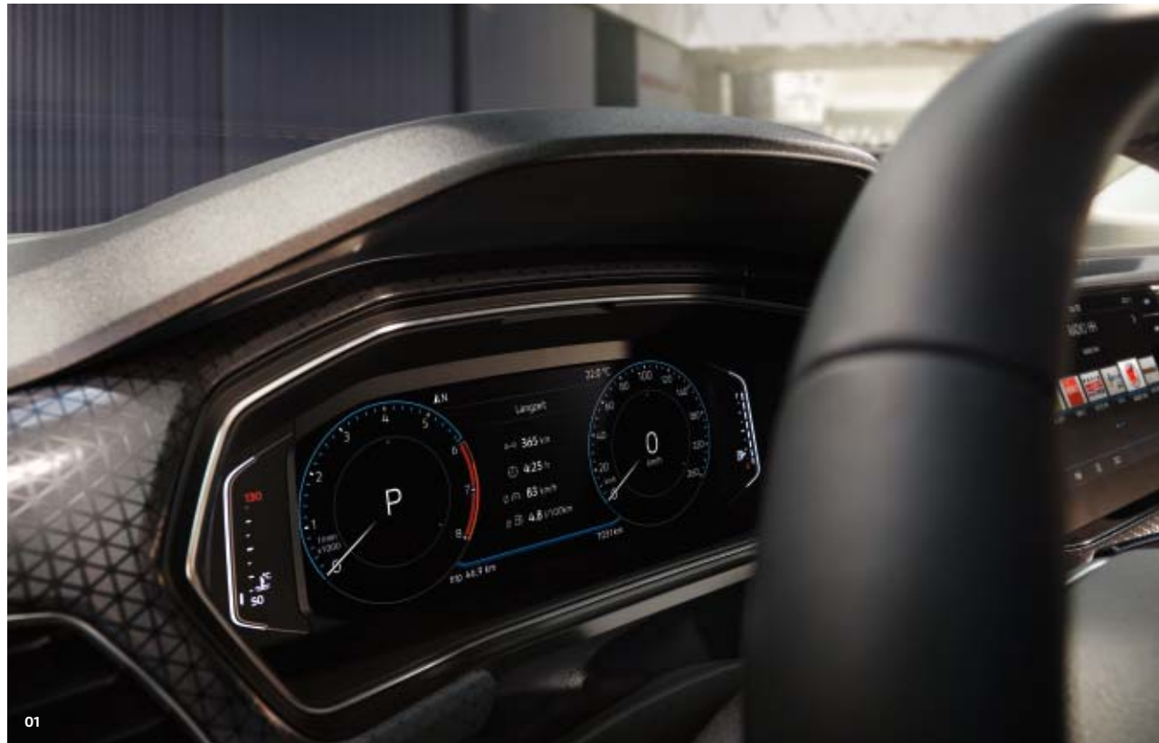
Serienausstattung T-Cross LS Serienausstattung T-Cross Life LF Serienausstattung T-Cross Style ST Sonderausstattung SO 1) Bei eingebautem Subwoofer beträgt das Kofferraumvolumen 375 Liter.

Entscheiden Sie selbst, was Sie sehen wollen: Das 26 cm (10,25 Zoll) große Active Info Display versorgt Sie mit den Fahrzeuginformationen, die Ihnen am wichtigsten sind. Auch die weiteren Multimedia- und Connectivity-Ausstattungen des neuen T-Cross geben Ihnen neben nützlichen Technologien vor allem eines: das gute Gefühl, im richtigen Auto zu sitzen. SO