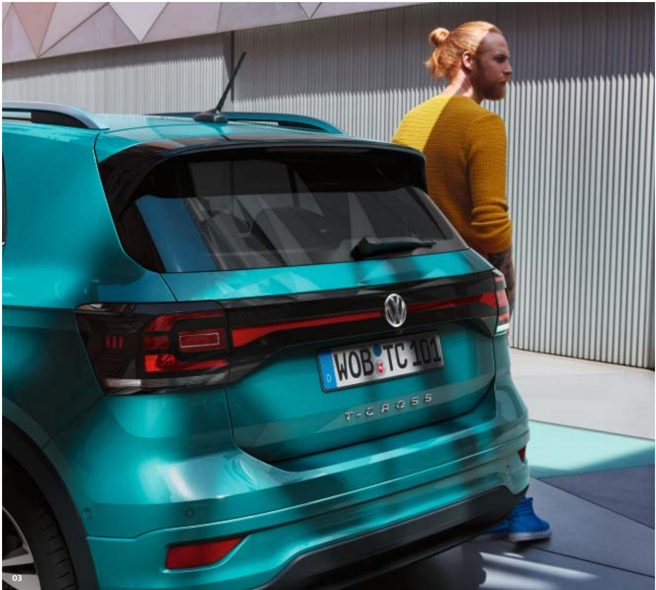
03 Freuen Sie sich auf das moderne Design Ihres neuen T-Cross. Das gilt auch für die Rückansicht – das Heck mit seinen markanten Reflektorleisten und LED-Rückleuchten hinterlässt garantiert einen bleibenden Eindruck. ST