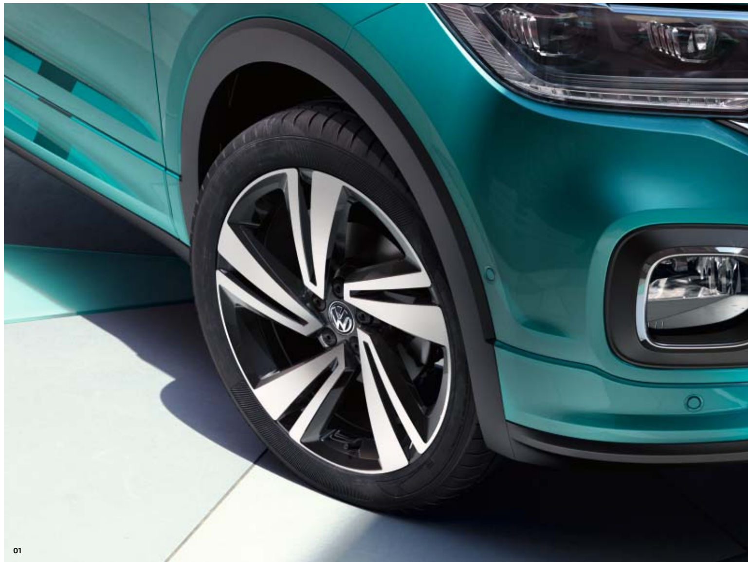
01 Mit welchen Rädern Ihr neuer T-Cross am meisten glänzt, hängt ganz von Ihnen ab. Denn mit dem umfangreichen Räderprogramm haben Sie die Qual der Wahl. Zum Beispiel mit den 18-Zoll-Leichtmetallrädern „Nevada“ 1) . SO