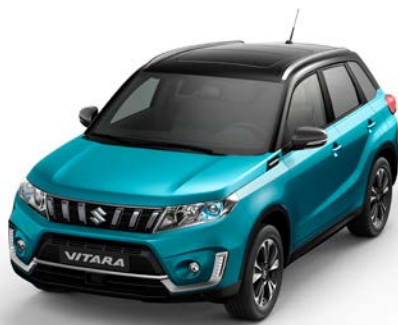
Wagenfarbe: Atlantis Turquoise Pearl Metallic (ZQN) und Dachfarbe: Cosmic Black Pearl Metallic (ZCE) Farbcode: A9L*