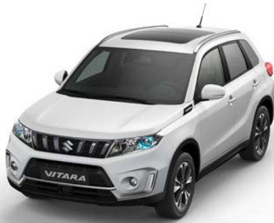
Wagenfarbe: White (26U) und Dachfarbe: White (26U) Farbcode: 26U