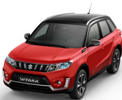
Wagenfarbe: Bright Red 5 (ZCF) und Dachfarbe: Cosmic Black Pearl Metallic (ZCE) Farbcode: A9H *