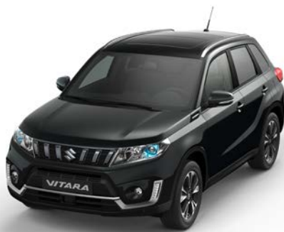
Wagenfarbe: Cosmic Black Pearl Metallic (ZCE) und Dachfarbe: Cosmic Black Pearl Metallic (ZCE) Farbcode: ZCE*