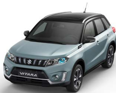
Wagenfarbe: Ice Grayish Blue Metallic (DBF) und Dachfarbe: Cosmic Black Pearl Metallic (ZCE) Farbcode: DBF*