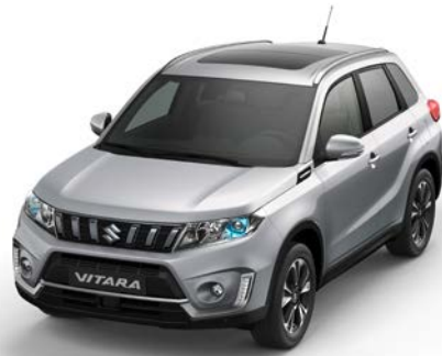
Wagenfarbe: Silky Silver Metallic 2 (ZCC) und Dachfarbe: Silky Silver Metallic 2 (ZCC) Farbcode: ZCC*