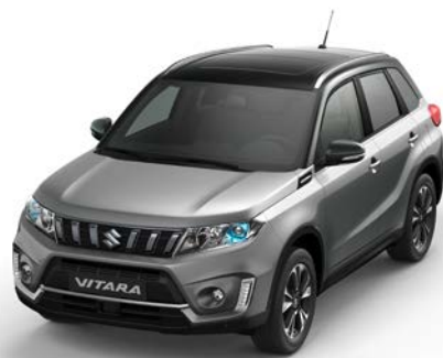
Wagenfarbe: Galactic Gray Metallic (ZCD) und Dachfarbe: Cosmic Black Pearl Metallic (ZCE) Farbcode: A9G*