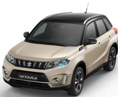
Wagenfarbe: Savanna Ivory Metallic (ZQQ) und Dachfarbe: Cosmic Black Pearl Metallic (ZCE) Farbcode: A9N*