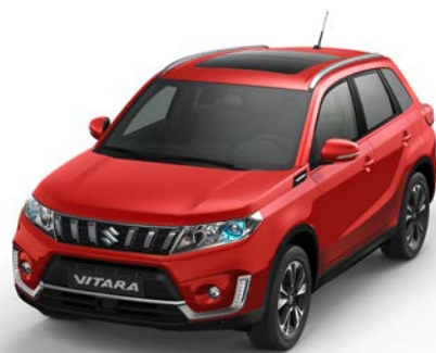
Wagenfarbe: Bright Red 5 (ZCF) Dachfarbe: Bright Red 5 (ZCF) Farbcode: ZCF