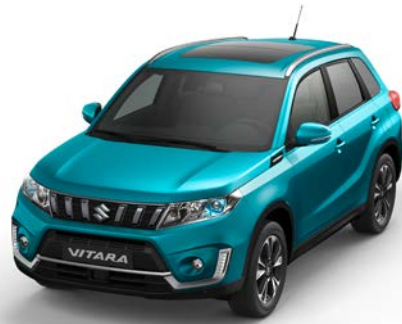
Wagenfarbe: Atlantis Turquoise Pearl Metallic (ZQN) und Dachfarbe: Atlantis Turquoise Pearl Metallic (ZQN) Farbcode: ZQN*