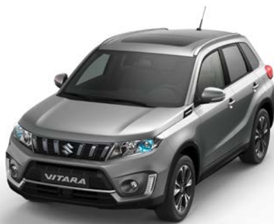
Wagenfarbe: Galactic Gray Metallic (ZCD) und Dachfarbe: Galactic Gray Metallic (ZCD) Farbcode: ZCD*