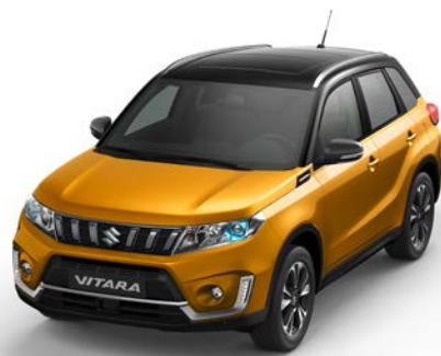
Wagenfarbe: Solar Yellow Pearl Metallic (DBH) und Dachfarbe: Cosmic Black Pearl Metallic (ZCE) Farbcode: DBH*