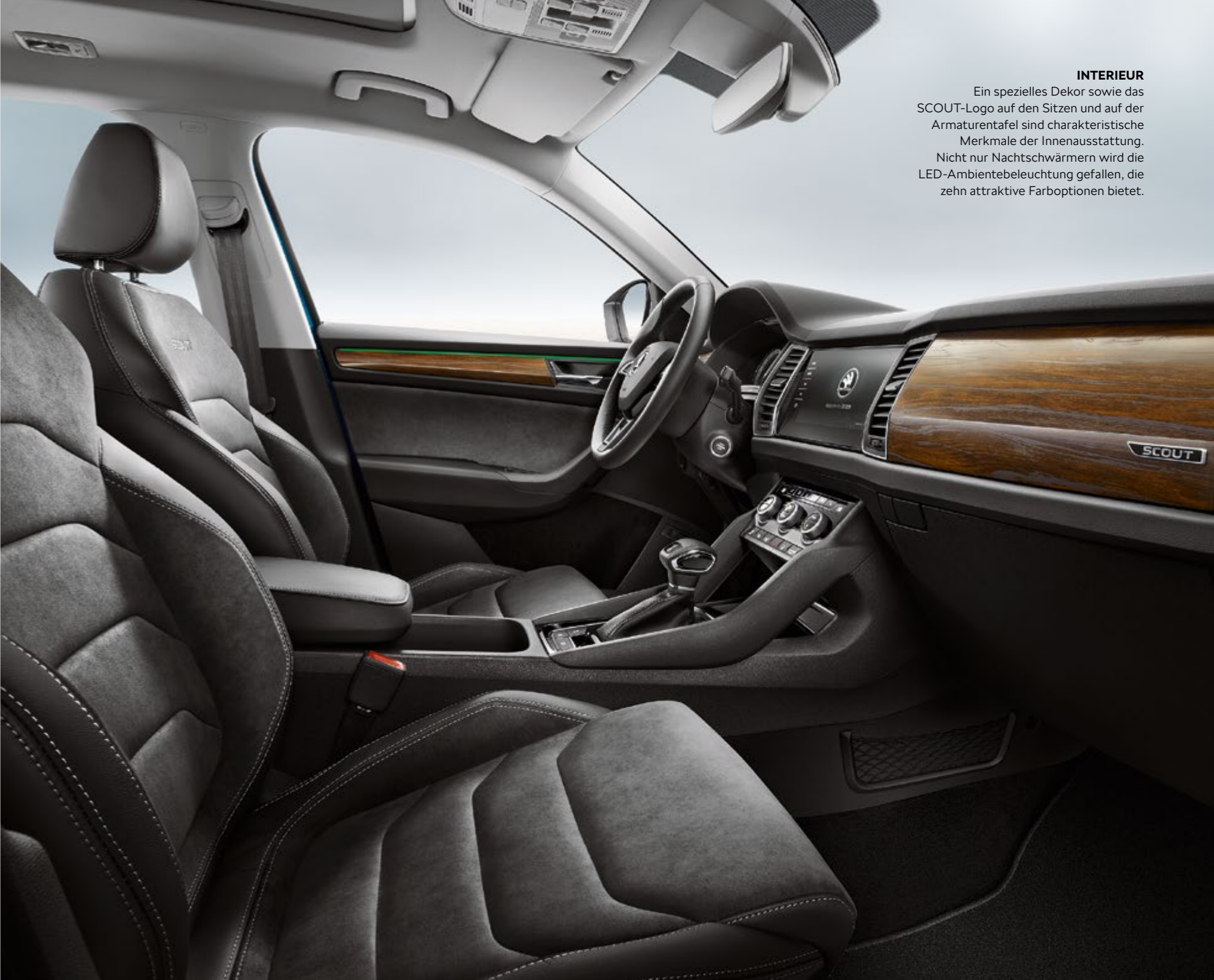
INTERIEUR Ein spezielles Dekor sowie das SCOUT-Logo auf den Sitzen und auf der Armaturentafel sind charakteristische Merkmale der Innenausstattung. Nicht nur Nachtschwärmern wird die LED-Ambientebeleuchtung gefallen, die zehn attraktive Farboptionen bietet.