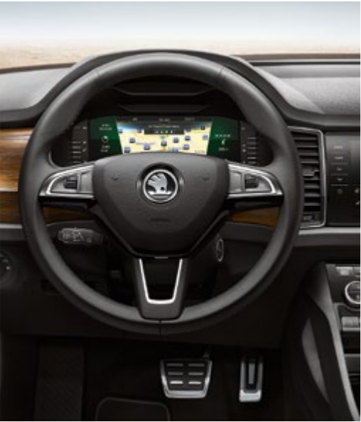
DREI-SPEICHEN-LEDERLENKRAD Über das Drei-Speichen-Lederlenkrad mit Multifunktionstasten können Sie bequem Telefon und Radio bzw. das Doppelkupplungsgetriebe DSG bedienen. Auf Wunsch ist es sogar beheizbar. Über das Infotainmentsystem gesteuert, sorgt es für angenehm warme Hände auch an kalten Tagen.

Auch abseits der Zivilisation müssen Sie nicht auf deren angenehme Seiten verzichten. Dank einer umfangreichen Komfortausstattung und jeder Menge ausgeklügelter Details können Sie auch längere Abenteuerreisen bequem und entspannt genießen.