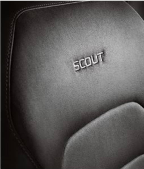
LOGO Auf die Rückenlehnen der Sitze ist das SCOUT-Logo gestickt.