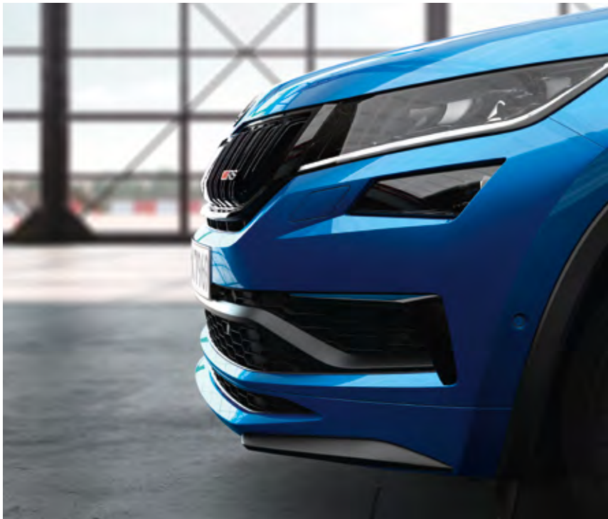
LED-SCHEINWERFER UND NEBELSCHEINWERFER LED-Technologie ist beim KODIAQ RS serienmäßig.