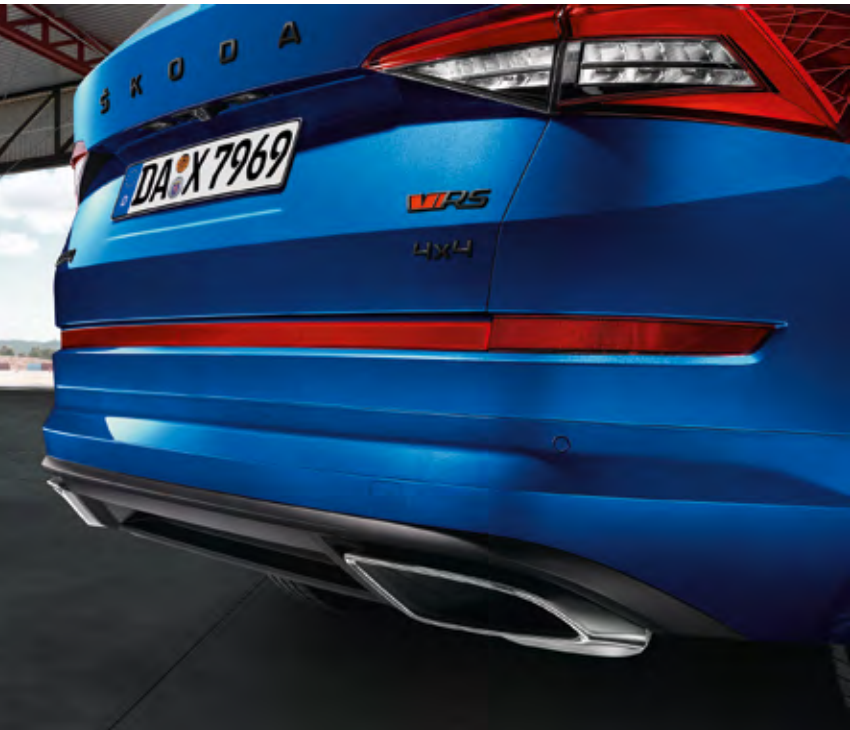
RÜCKANSICHT Die LED-Heckleuchten sorgen für die vertraute C-förmige Beleuchtung. Die verchromten Auspuffendrohre unterstreichen den sportlichen Look des Fahrzeugs und machen zudem seinen kraftvollen Charakter hörbar. Der dynamische Soundgenerator hebt den sportlichen Motorsound noch stärker hervor.

Zahlreiche Exterieurdetails betonen die dynamische Persönlichkeit des KODIAQ RS – von RS-Emblemen an Front und Heck über die LED-Leuchten bis zu den einzigartigen Felgen.