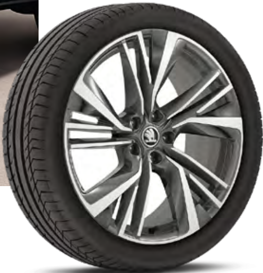
20" LEICHTMETALLFELGEN IGNITE Anthrazit-Glanzgedreht, Bereifung 255/40 R20