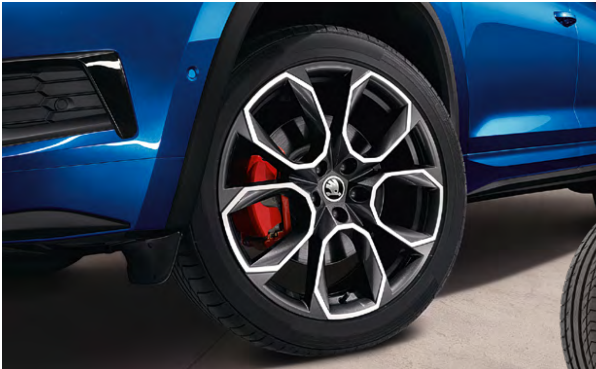
FELGEN Die Unverwechselbarkeit der 20"-Xtreme-Leichtmetallfelgen in Anthrazit glanzgedreht wird durch die roten Bremssättel noch unterstrichen.