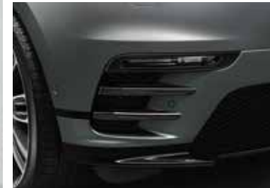
Luftauslässe in der Motorhaube in Narvik Black Aeroblades in der Frontschürze in Narvik Black