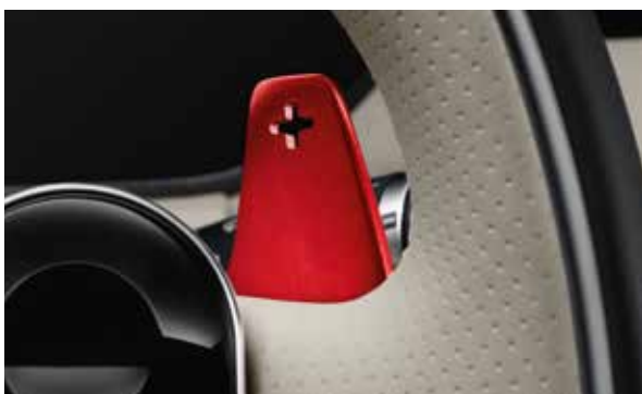
Aluminium-Schaltwippen in Rot