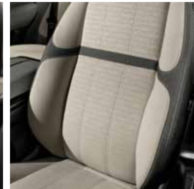
Kvadrat-Stoff und Premium-Velours

Windsor-Leder zeichnet sich durch ein gleichmäßiges Erscheinungsbild und eine außergewöhnliche Geschmeidigkeit aus. Es wird aus hochwertigem Leder und unter äußerst vorsichtiger Bearbeitung hergestellt. Es weist lediglich eine leichte Beschichtung auf, wodurch es einen natürlicheren Eindruck vermittelt.