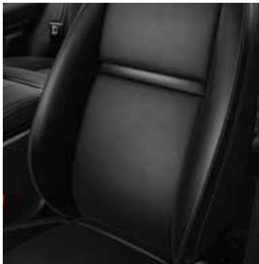
Luxtec und Premium-Velours

Luxtec ist ein weiches und technisch hochwertiges Material, das durch Premium-Velours ideal ergänzt wird. Dabei handelt es sich um ein nachhaltiges und äußerst leichtes Premium-Mikrofaser-Velours, das aus recycelten Materialien hergestellt wird.