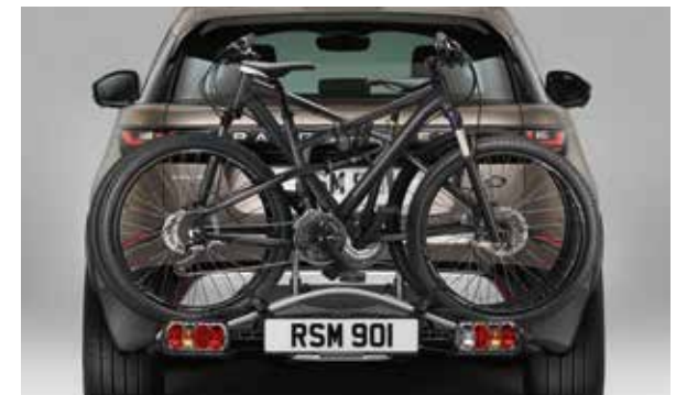
Fahrradträger für die Anhängerkupplung (3 Fahrräder)