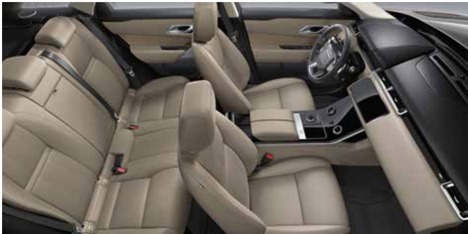
Abgebildetes Interieur: Innenraum des Ausstattungspaketes SE in Acorn mit Sitzen in perforiertem genarbtm Leder in Acorn und Dekorelementen in Satin Umber Linear.

(in Verbindung mit perforiertem genarbtm Leder oder perforiertem Windsor-Leder erhältlich)