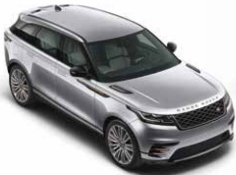
Indus Silver (Metallic)