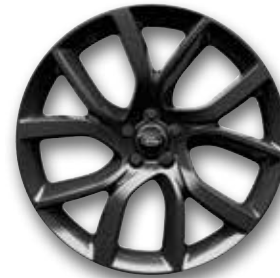
21" MIT 5 DOPPELSPEICHEN, GLOSS DARK GREY (STYLE 5083)