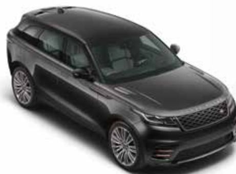
Carpathian Grey (Premium Metallic)