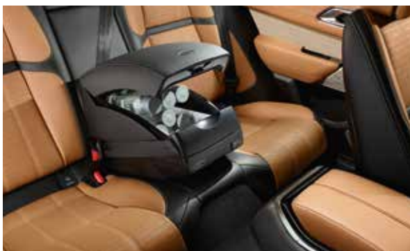
Kühl-/Warmhaltebox mit Armlehne