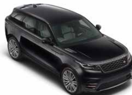
Santorini Black¹ (Metallic)