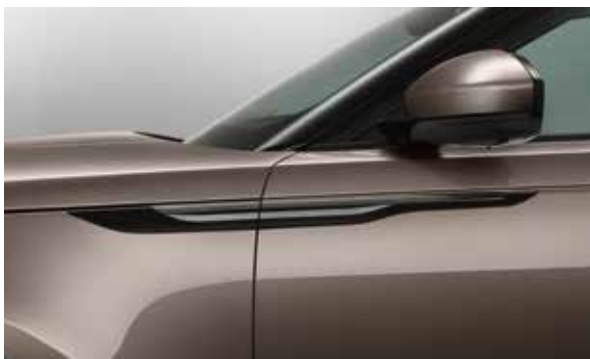
Seitliche Luftauslässe – Karbon