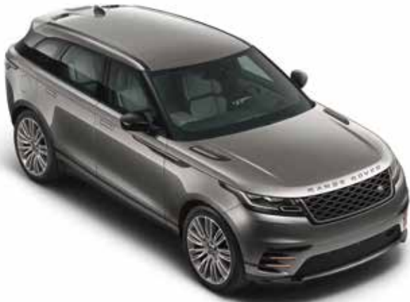
Dach in Wagenfarbe Serienausstattung