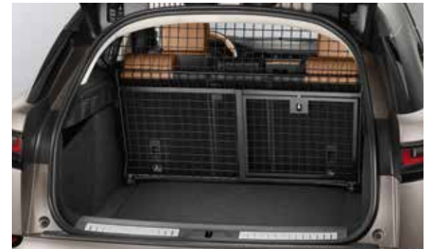
Gepäckraumabtrennung (volle Höhe)