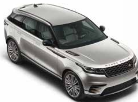
Aruba (Premium Metallic)