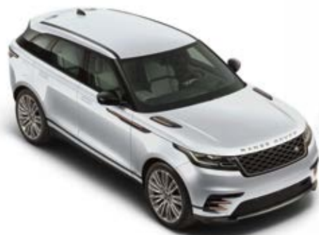
Yulong White (Metallic)