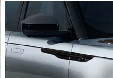
Seitliche Lufteinlässe und Türleiste in Narvik Black Spiegelkappen in Narvik Black