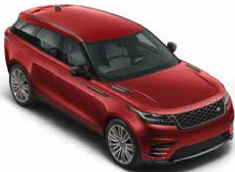
Firenze Red (Metallic)