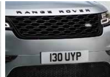
Kühlergrill und Einfassung in Narvik Black RANGE ROVER Schriftzug auf Motorhaube und Heckklappe in Narvik Black Frontschürze unten in Narvik Black