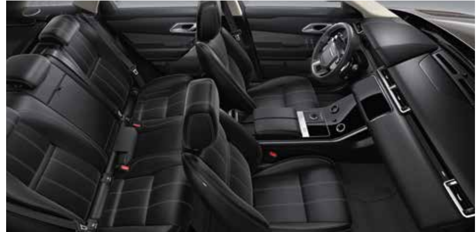
Abgebildetes Interieur: Innenraum des Ausstattungspaketes SE in Ebony mit Sitzen in perforiertem genarbtm Leder in Ebony und Dekorelementen in Shadow Aluminium.

(in Verbindung mit Luxtec und Premium-Velours, perforiertem genarbtm Leder, perforiertem genarbtm Leder und Premium-Velours, perforiertem Windsor-Leder oder perforiertem Windsor-Leder mit Autobiography-Muster erhältlich)