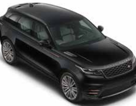
Narvik Black¹ (Uni)