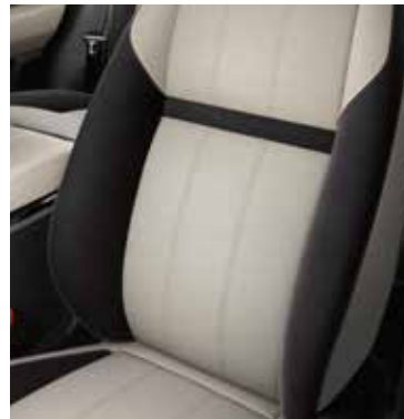
Genarbttes Leder und Premium-Velours

Genarbttes Leder ist mit einer natürlichen und markanten Ledernarbung versehen, durch die es nicht nur widerstandsfähig, sondern auch optisch besonders ansprechend ist.