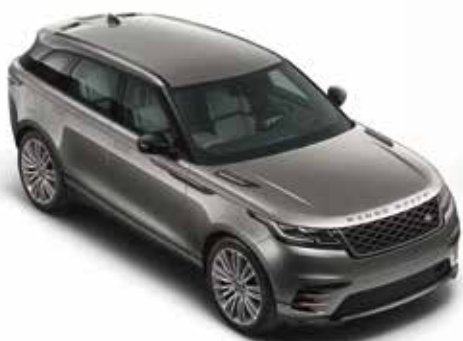
Silicon Silver (Premium Metallic)