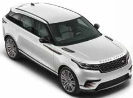
Fuji White (Uni)

Von vollen, satten Glanztönen bis zu strahlendem Metallic – für unsere Lackierungen kommen die neuesten Pigment-Technologien zum Einsatz. Unsere Uni-Lackierungen ergeben eine tiefe, gleichmäßige Farbe. Unsere optionalen Metallic-Lackierungen besitzen eine schillernde Oberfläche und sind ein echter Blickfang. Und unsere optionalen Premium Metallic-Lackierungen lassen die Farbe und die Dekorelemente intensiver strahlen und verleihen Ihrem Fahrzeug dadurch noch mehr Attraktivität.