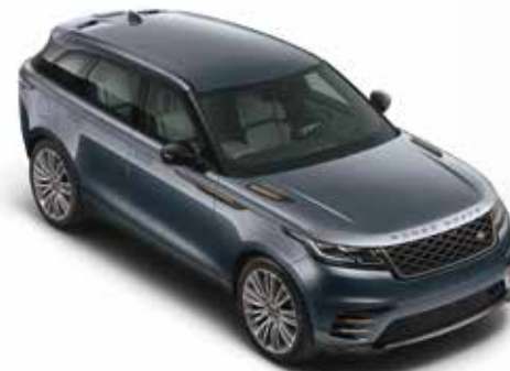
Byron Blue (Metallic)