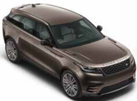
Kaikoura Stone (Metallic)