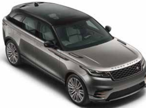
Dach in Kontrastlackierung – Schwarz 2 mit Panoramdach mit elektrischer Sonnenblende Sonderausstattung