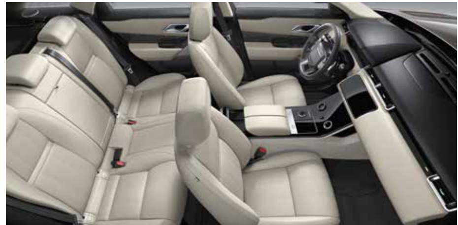
Abgebildetes Interieur: Innenraum des Ausstattungspaketes SE in Light Oyster mit Sitzen in perforiertem genarbtm Leder in Light Oyster sowie glänzenden Dekorelementen in Argento PinStripe.

(in Verbindung mit perforiertem genarbtm Leder oder perforiertem Windsor-Leder erhältlich)