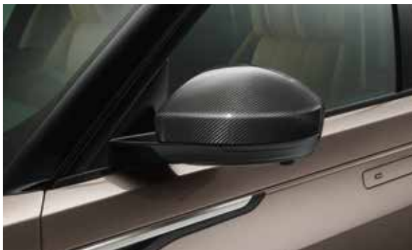
Spiegelkappen – Karbon