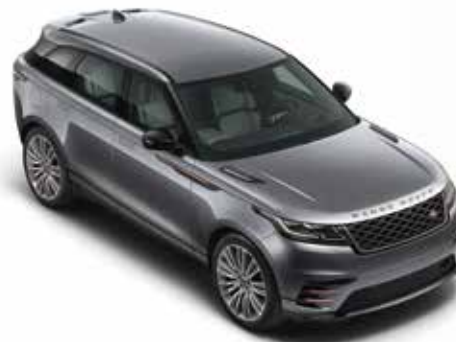
Eiger Grey (Metallic)