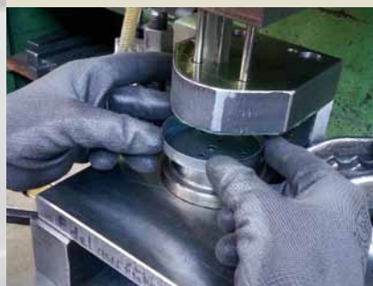
Lochen und Stempeln des Halters.