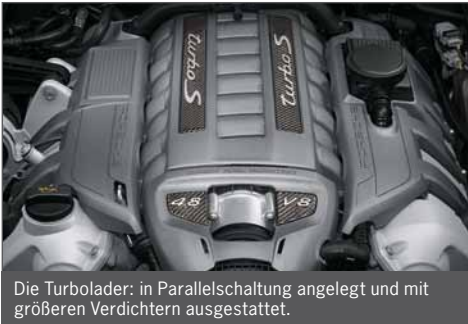
Die Turbolader: in Parallelschaltung angelegt und mit größeren Verdichtern ausgestattet.