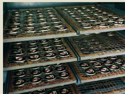
Einbrennen des Wappens.