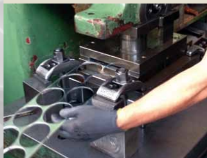
Stanzen der Platine.