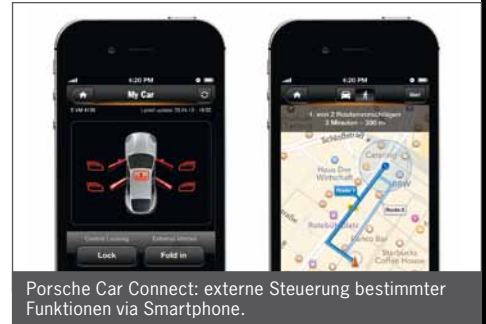
Porsche Car Connect: externe Steuerung bestimmter Funktionen via Smartphone.