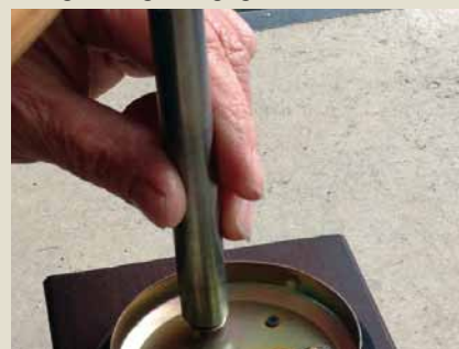
Zusammenbau der Einzelteile durch Anbringen der Federmuttern.