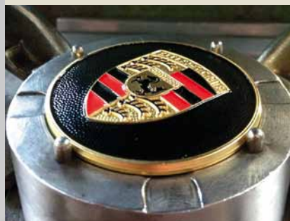
Wölben des zuvor farbig ausgelegten Porsche Wappens.