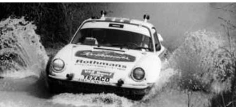
DER PORSCHE CARRERA CUP.

Der Porsche 911 geht in zahlreichen nationalen und internationalen Rennserien an den Start: so zum Beispiel beim Porsche Sports Cup Deutschland, der 2013 zum 50. Mal ausgetragen wird. Als Kundensportserie schließt er die Lücke zwischen Porsche Sport Driving School und den Porsche Markenpokalen für Rennsportprofis. Oder bei der Langstrecken-Weltmeisterschaft World Endurance Championship und der International GT Open, die seit 2006 in Europa veranstaltet wird.