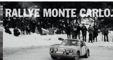
RALLYE MONTE CARLO.