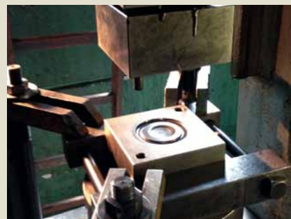
Prägewerkzeug zur Prägung des Deckels.