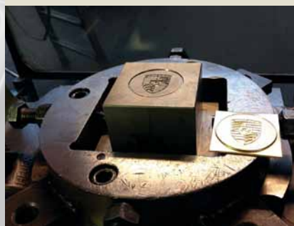
Prägewerkzeug zur Prägung in die Platine.