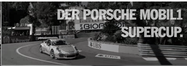
DER PORSCHE MOBIL1 SUPERCUP.