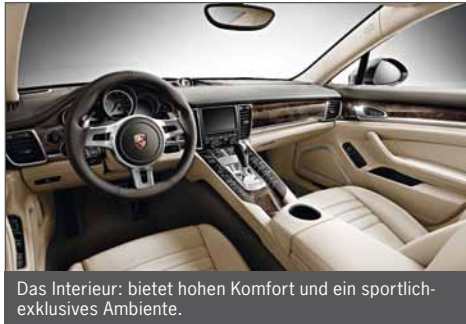
Das Interieur: bietet hohen Komfort und ein sportlich-exklusives Ambiente.