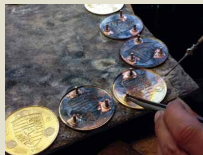
Hartlöten der Stifte nach Ausstanzen der Platine.