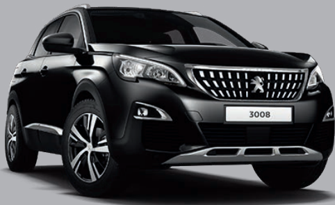
Perla Nero Schwarz