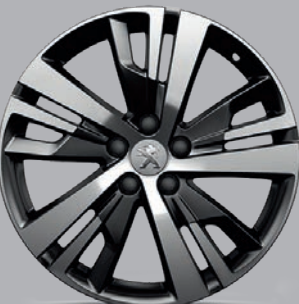
Leichtmetallfelge 18" „Detroit“, zweifarbig