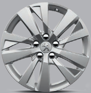
Leichtmetallfelge 17" „Chicago“