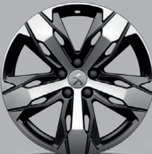
Leichtmetallfelge 18" „Los Angeles“, zweifarbig

Mit der Entscheidung für einen PEUGEOT 3008 können Sie auf die Kompetenz und die europaweite Verbreitung des PEUGEOT Vertragspartnernetzes zählen. Mehr noch: Unsere Studien haben gezeigt, dass die meisten Fahrer eines PEUGEOT sich einen speziell auf sie zugeschnittenen Service wünschen. Deshalb bietet Ihnen der PEUGEOT 3008 in puncto Service ganz neue Freiheiten – während und nach dem Kauf.