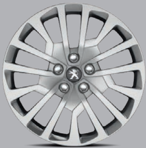
Radzierblende 17" „Miami“

Als i-Tüpfelchen stehen Ihnen vier verschiedene Radzierblenden bzw. Leichtmetallfelgen 1) in den Formaten 17 und 18 Zoll, ein- und zweifarbig, zur Verfügung.