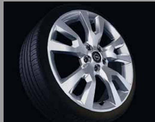
3 Leichtmetallrad 8 J x 19, 5-Doppelspeichen-Design, Reifen 235/50 R 19