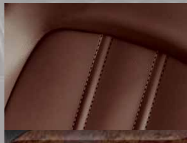
Leder Mondial 2 , Sattelbraun. Dekorleiste: Edelholzoptik.