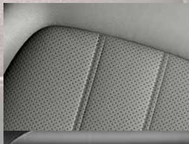
Leder Mondial 2 , Hellgrau. Dekorleiste: Atari.