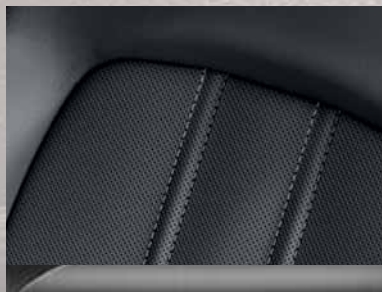
Leder Mondial 2 , Schwarz. Dekorleiste: Atari.