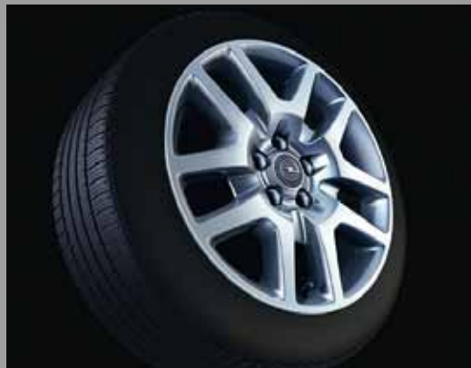
2 Leichtmetallrad 7 J x 18, 5-V-Speichen-Design, Reifen 235/55 R 18