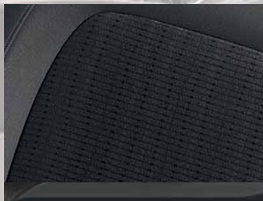
Stoff Marine, Schwarz. Dekorleiste: Graphitmetallic.