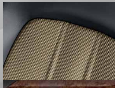
Stoff-Leder-Kombination Vicker/Morrocana 1 , Kaschmirbeige. Dekorleiste: Edelholzoptik.