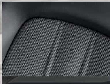
Stoff-Leder-Kombination Vicker/Morrocana 1 , Anthrazit. Dekorleiste: Graphitmetallic.