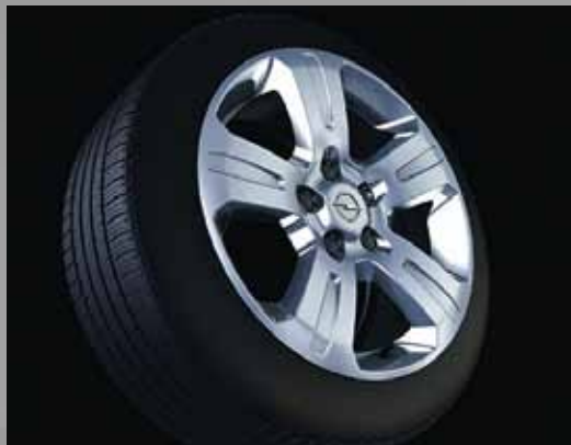
1 Leichtmetallrad 7 J x 17, 5-Speichen-Design, Reifen 235/65 R 17