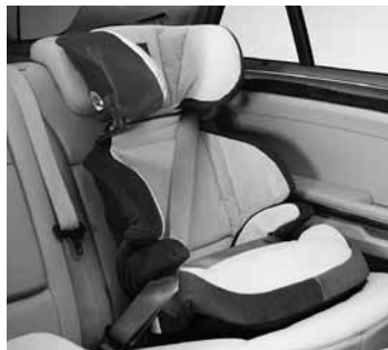
Kindersitz KID ►