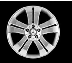
19" 5-Doppelspeichen-Design ▲