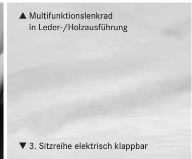
▼ 3. Sitzreihe elektrisch klappbar