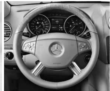
▲ Multifunktionslenkrad in Leder-/Holzausführung