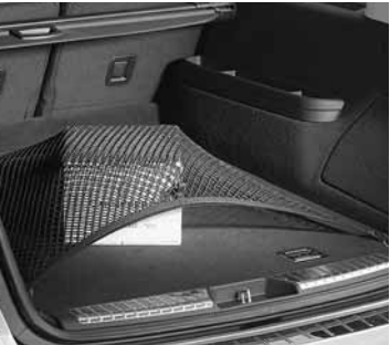
▲ Gepäcknetz, Kofferraumboden