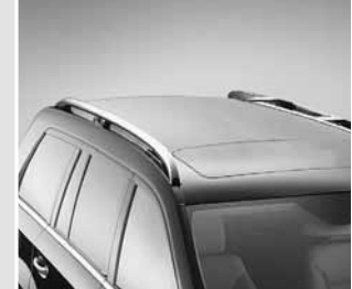
▲ Dachreling Chromoptik