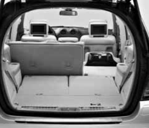
Fondsitzbank klappbar ▲