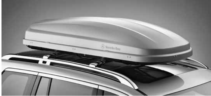
▲ Crossbar, Chrom, Mercedes-Benz Dachbox