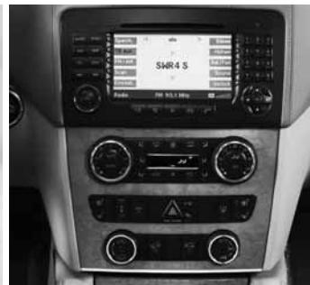
▲ COMAND APS