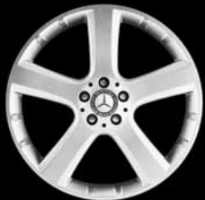
20" 5-Speichen-Design ▲