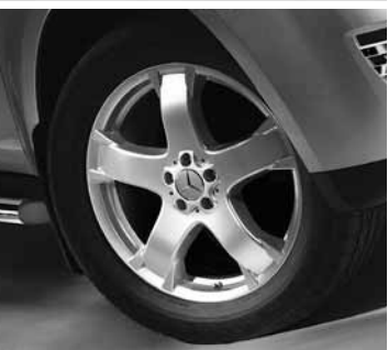
◄ Tyndarides, 20" 5-Speichen-Design