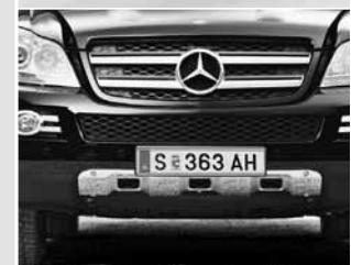
▲ Optischer Unterfahrschutz vorne