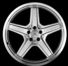
21" AMG 5-Speichen-Design ▲