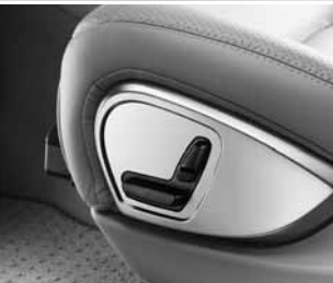
Vordersitze elektrisch verstellbar ▲