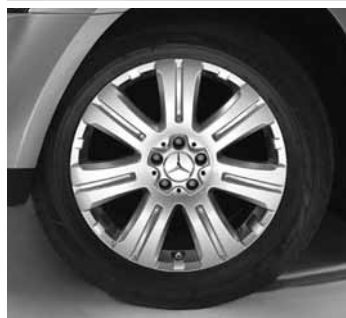
▼ Aldhanab, 19" 7-Speichen-Design