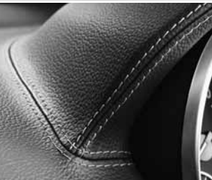
Polsterung ARTICO* ▲