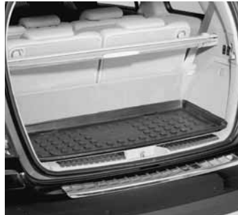
▲ Kofferraumwanne, flach