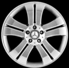
19" 5-Doppelspeichen-Design ▲