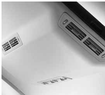
Klimaanlage im Fond ▲