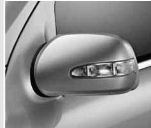
▲ Außenspiegel mit Blinkleuchte