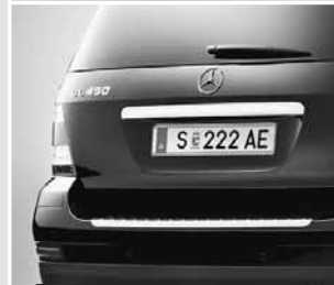
▲ Kratzschutz in Edelstahl