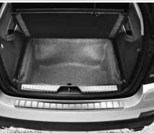
Staufach unter Laderaum ▼