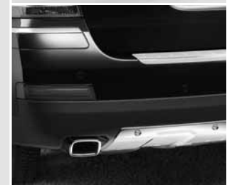
▲ Optischer Unterfahrschutz hinten