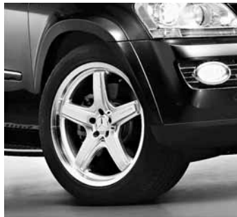
◀ 21" AMG 5-Speichen-Design mit Kotflügelverbreiterung