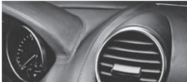
Belederte I-Tafel in designo Leder schwarz