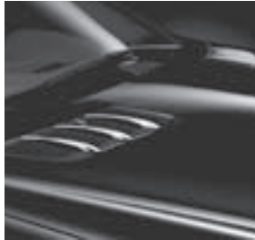
Finnenaufsätze für Motorhaube