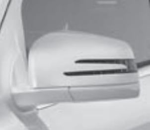
Außenspiegel mit Blinkleuchte