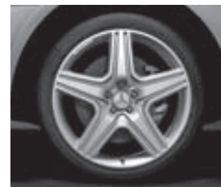
AMG 5-Speichen-Design (777)