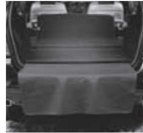
Wendematte mit Ladekantenschutz