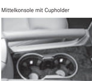
Mittelkonsole mit Cupholder