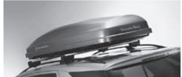
Grundträger New Alustyle, Mercedes-Benz Dachbox