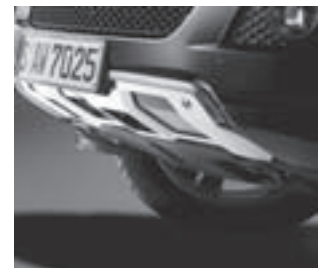
Unterschutz in Edelstahl