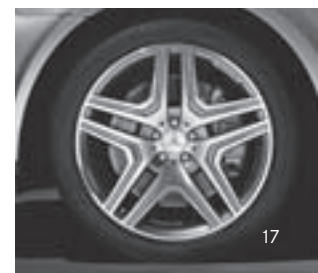
AMG 5-Doppelsp.-Design (798)