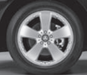
19" 5-Speichen-Design (R39)