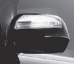
Außenspiegel mit Blinkleuchte