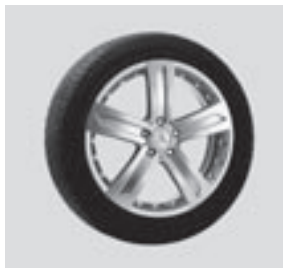
19" Klemola, 5-Speichen-Design