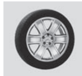
19" Alrai, 6-Speichen-Design