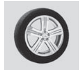
20" Furud, 5-Speichen-Design