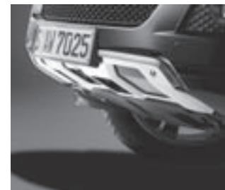
Unterfahrschutz in Edelstahl