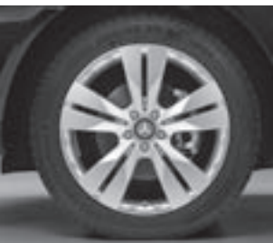
20" 5-Doppelspeichen-Design (R33)