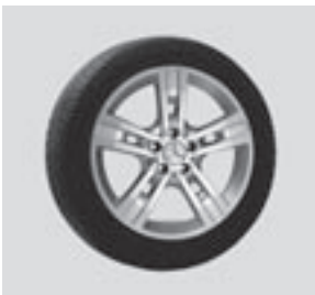
18" Gyas, 5-Speichen-Design