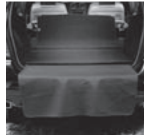
Wendematte mit Ladekantenschutz