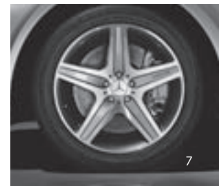
20" AMG 5-Speichen-Design