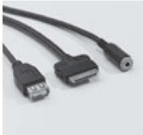
Media Interface Consumer-Kabel Kit