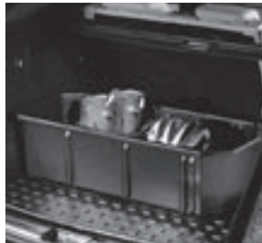
Kofferraumwanne, flach mit Staubbox