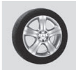
18" Mintaka, 5-Speichen-Design