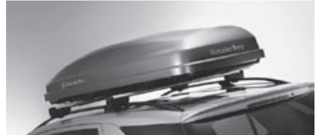
Grundträger New Alustyle, Mercedes-Benz Dachbox