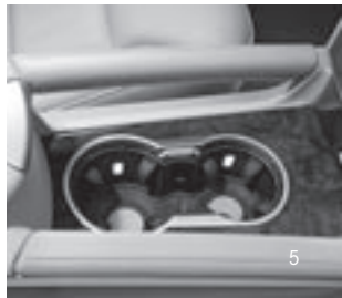
Mittelkonsole mit Cupholder