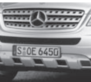
Optischer Unterfahrschutz ▲