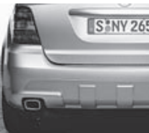
AMG Heckschürze ▲