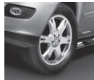
▲ 19" 6-Speichen-Design