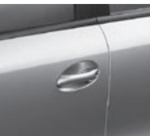
Türgriffe in Wagenfarbe ▼

Tipp-Wischfunktion für Frontscheibenwischer, Heckscheibenwischer mit automatischer Zuschaltung bei Rückwärtsfahrt, Heckscheibenwischer mit Intervallsystem