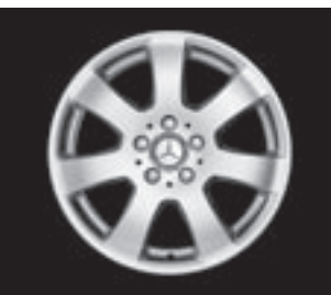
17" 7-Speichen-Design ▲