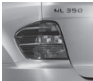
▲ Rückleuchte in Sportoptik