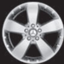
18" 5-Speichen-Design ▲