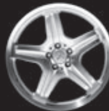
20" AMG 5-Speichen-Design ▼