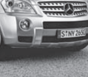
AMG Frontschürze ▲