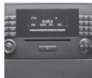
▼ Radio »Audio 20«