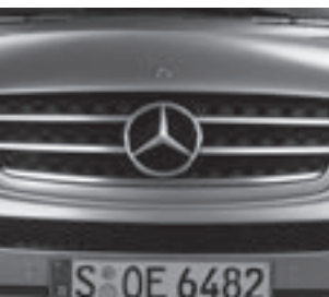
Kühlergrill schwarz mit Chrom ▼