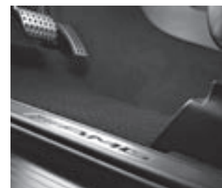
▲ AMG Einstiegsleiste