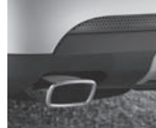
▲ Auspuffblende rechteckig