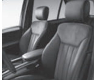
▲ Sportsitze vorne

* tagesaktuelle Konditionen unter www.mercedes-benz-bank.de (siehe Hinweis auf Seite 4)