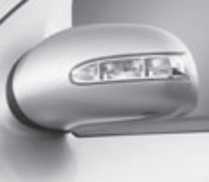
Außenspiegel mit Blinkleuchte ▲