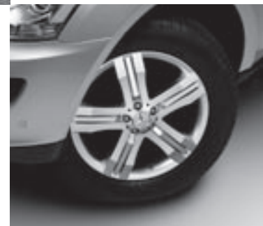
▼ 20" Furud, 5-Speichen-Design