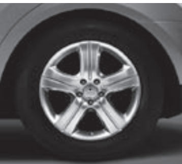
◄ 18" Mintaka, 5-Speichen-Design