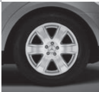
▼ 19" Alrai, 6-Speichen-Design