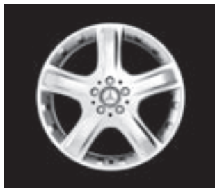
▼ 19" 5-Speichen-Design