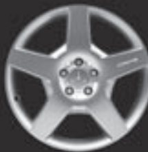
19" AMG 5-Speichen-Design ▲