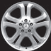
18" 5-Doppelspeichen-Design ▲