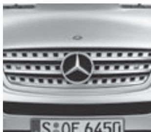
▲ Kühlergrill Sterlingsilber