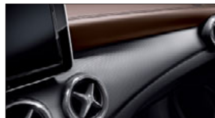
Das Zierelement in Aluminium mit Trapezschliff.