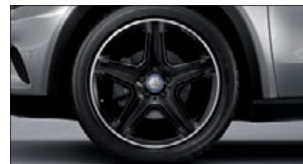
Edel und schwarz: das AMG Leichtmetallrad (Code 664).