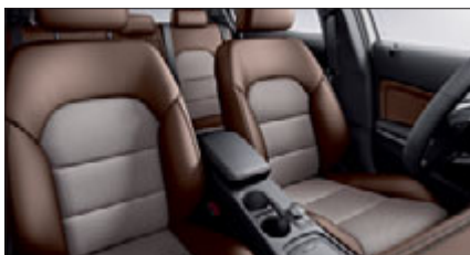
Exklusiv: die Leder-Stoff-Kombination Alvorada.

* Leasing-Sonderzahlung 20 %, Laufzeit 36 Monate, Gesamtlaufleistung 45.000 km. Berechnung der Monatsraten für die Sonderausstattungen auf Basis eines GLA 220 CDI 4MATIC. Diese Angebote basieren auf den derzeitigen Kapitalmarktzinsen. Sie sind freibleibend und verpflichten keine Seite zum Vertragsabschluss. Leasingbeispiele der Mercedes-Benz Leasing GmbH. Stand: 11/13. Tagesaktuelle Konditionen erhalten Sie unter www.mercedes-benz-bank.de oder bei Ihrem Verkaufsberater. Dieser erstellt Ihnen gern ein individuelles Angebot.