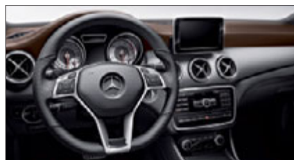
Das Sportlenkrad verstärkt Auftritt und Fahrgefühl.