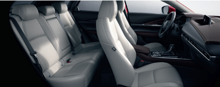
Lederausstattung* in Pure-White (Kontrastelemente der Mittelkonsole, des Armaturenbretts und der Dekor-Elemente in den Seitentüren in Braun)