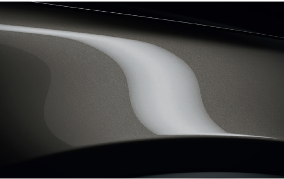
OBSIDIANGRAU METALLIC (42S)