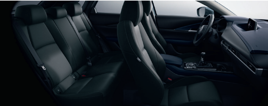
Stoffbezug in Dunkelgrau (Kontrastelemente der Mittelkonsole, des Armaturenbretts und der Dekor-Elemente in den Seitentüren in Dunkelblau)