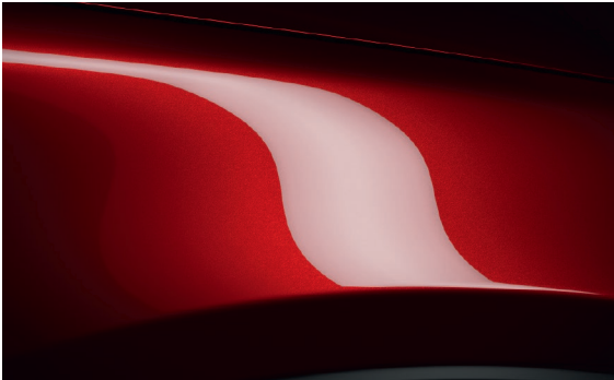
MAGMAROT METALLIC (46V)**