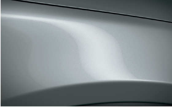
DIAMANTSILBER METALLIC (45P)