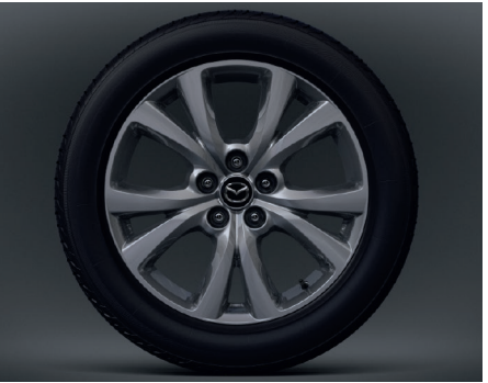
18-Zoll-Leichtmetallfelgen in Silber