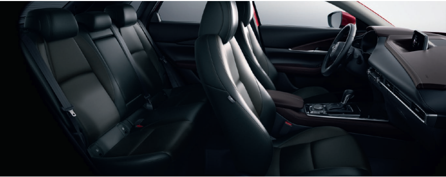
Lederausstattung* in Schwarz (Kontrastelemente der Mittelkonsole, des Armaturenbretts und der Dekor-Elemente in den Seitentüren in Braun)