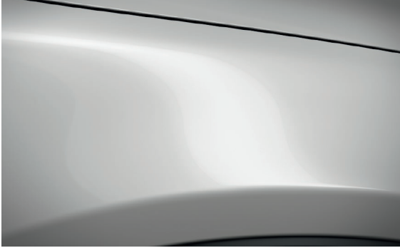
SATINWEISS METALLIC (25D)