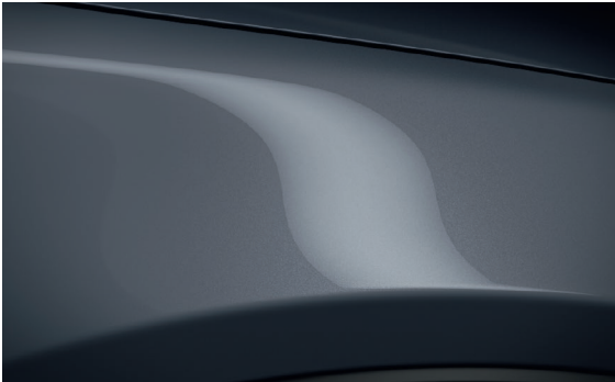
POLYMETAL GRAU METALLIC (47C)**