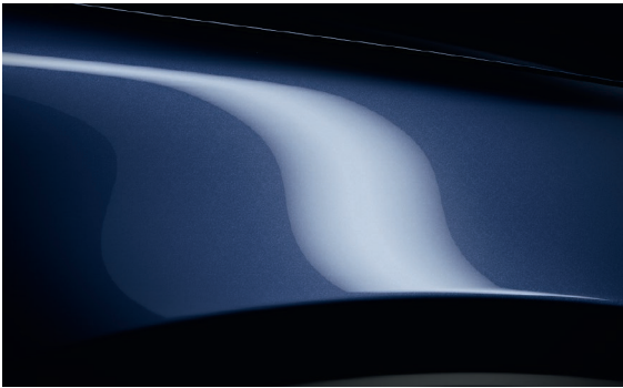
MITTERNACHTSBLAU METALLIC (42M)