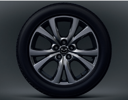
18-Zoll-Leichtmetallfelgen in Silbergrau mit Hochglanzfinish