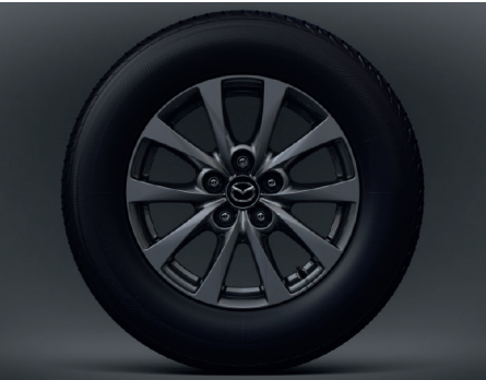
16-Zoll-Leichtmetallfelgen in Grau