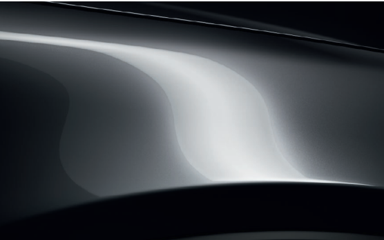
MATRIXGRAU METALLIC (46G)**