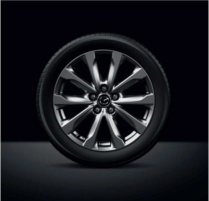
18-ZOLL LEICHTMETALLFELGEN MIT HOCHGLANZBESCHICHTUNG