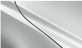
SATINWEISS METALLIC (25D)