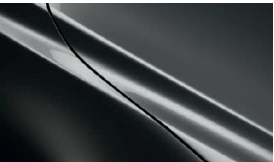
MATRIXGRAU METALLIC** (46G)