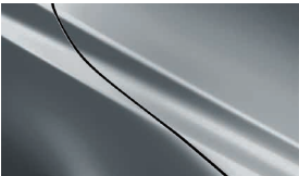
MONDSTEINWEISS METALLIC (47A)