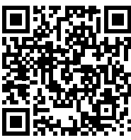
Maserati Car Configurator: 1. Code scannen 2. Maserati konfigurieren

Um die unzähligen Individualisierungskombinationen unserer Modelle zu entdecken, stellen wir Ihnen einen Car Configurator im Internet zur Verfügung. Um ein authentisches Bild Ihrer Konfiguration zu zeigen, können Sie das Fahrzeug aus verschiedenen Perspektiven betrachten. Probieren Sie es selbst aus unter www.configurator.maserati.com . Dort können Sie auch weitere Modelle konfigurieren. Viele zusätzliche, interessante Informationen über Maserati, die einzelnen Fahrzeuge und über die verschiedenen Services erhalten Sie unter www.maserati.de . Hier finden Sie auch eine Übersicht sämtlicher Vertragspartner.