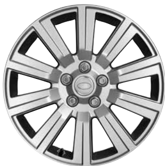
19" MIT ZEHN SPEICHEN, STYLE 103