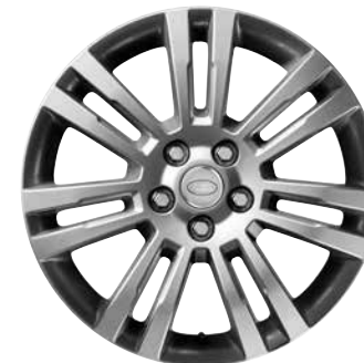
19" MIT SIEBEN DOPPELSPEICHEN, STYLE 704