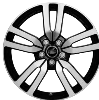
20" MIT FÜNF DOPPELSPEICHEN, STYLE 510, DIAMANTGEDREHT, GLOSS BLACK