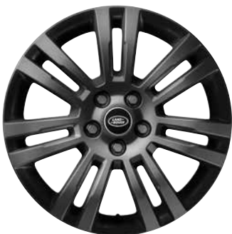
19" MIT SIEBEN DOPPELSPEICHEN, STYLE 704, GLOSS DARK GREY