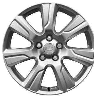
19" MIT SIEBEN SPEICHEN, STYLE 703