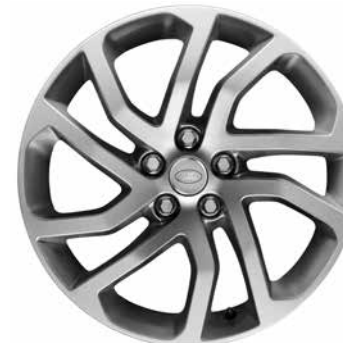
20" MIT FÜNF DOPPELSPEICHEN, STYLE 511