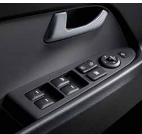
Elektrische Fensterheber an allen Fenstern