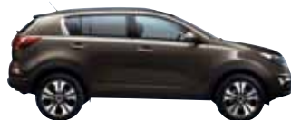
Sandbeige Met. D5U