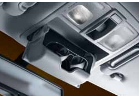
Sonnenbrillen werden im Dachhimmel aufbewahrt