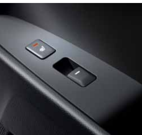
Sitzheizung vorn und hinten (optional VISION, Serie bei SPIRIT)