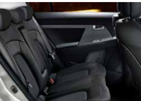
Auch die Fondpassagiere reisen komfortabel und stilvoll