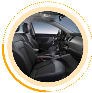
Stoffsitze mit Lederapplikationen (SPIRIT)