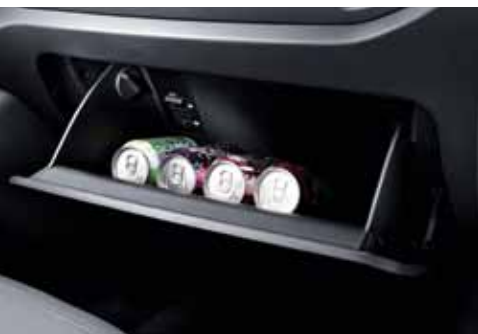
Gekühltes Handschuhfach (SPIRIT)