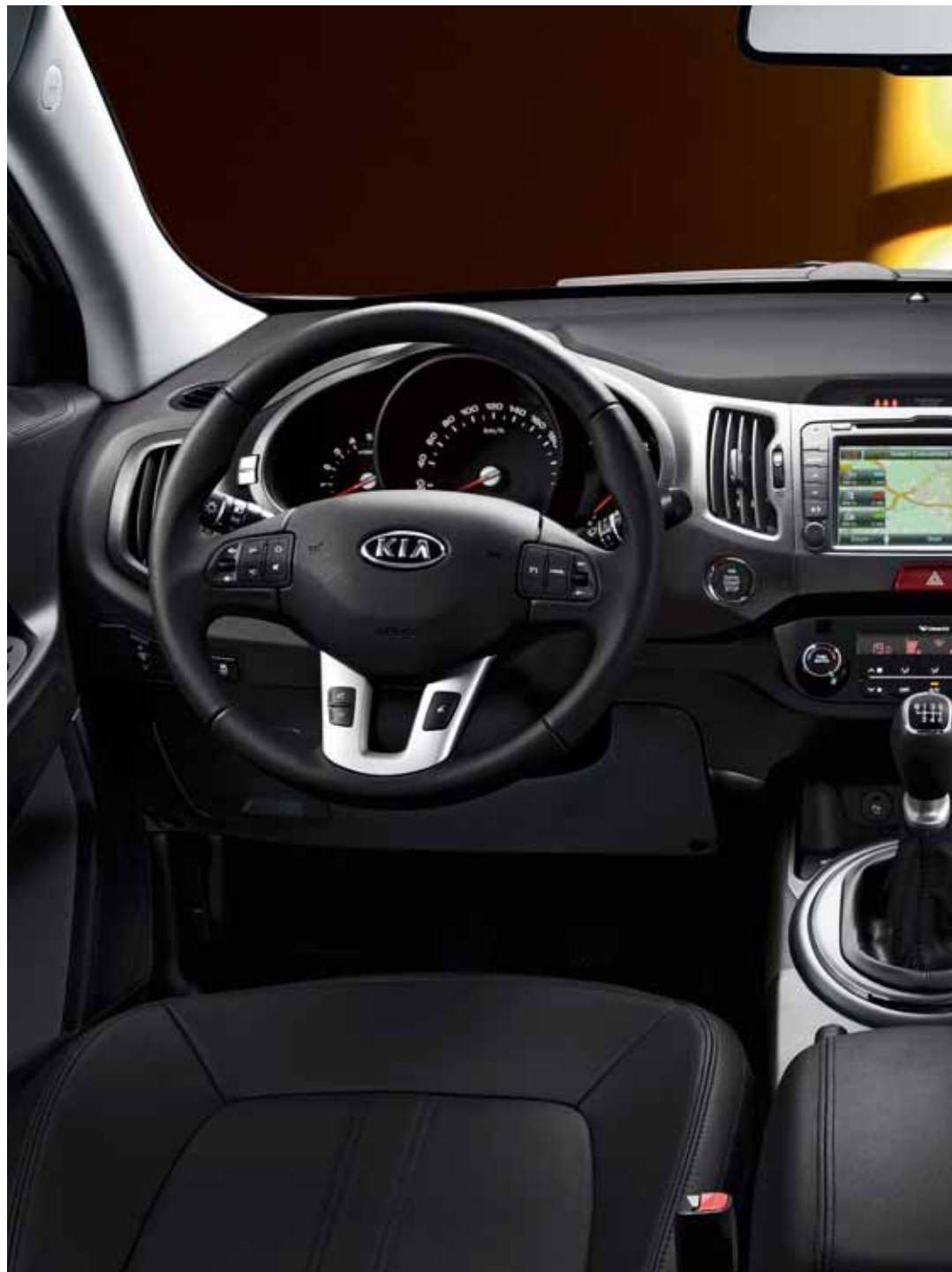
Abbildung zeigt SPIRIT