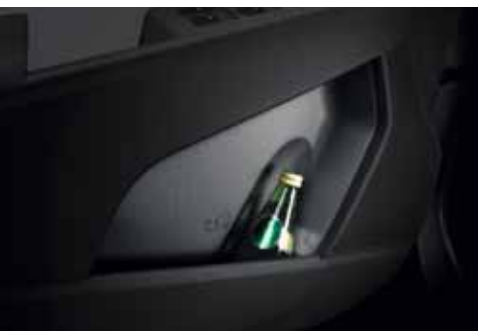
Karten oder Getränke lassen sich in den Türablagen verstauen