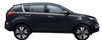
Winchestergrau Met. E5B