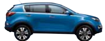
Byteblau Met. 5B