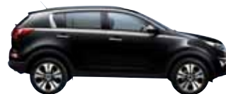
Zilinaschwarz Met. 1K