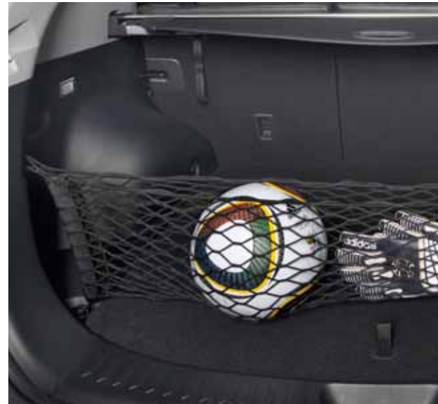
Kleinere Dinge lassen sich mit dem Gepäcknetz sichern

Sitze umklappen leicht gemacht: Einfach an den praktischen Laschen ziehen.