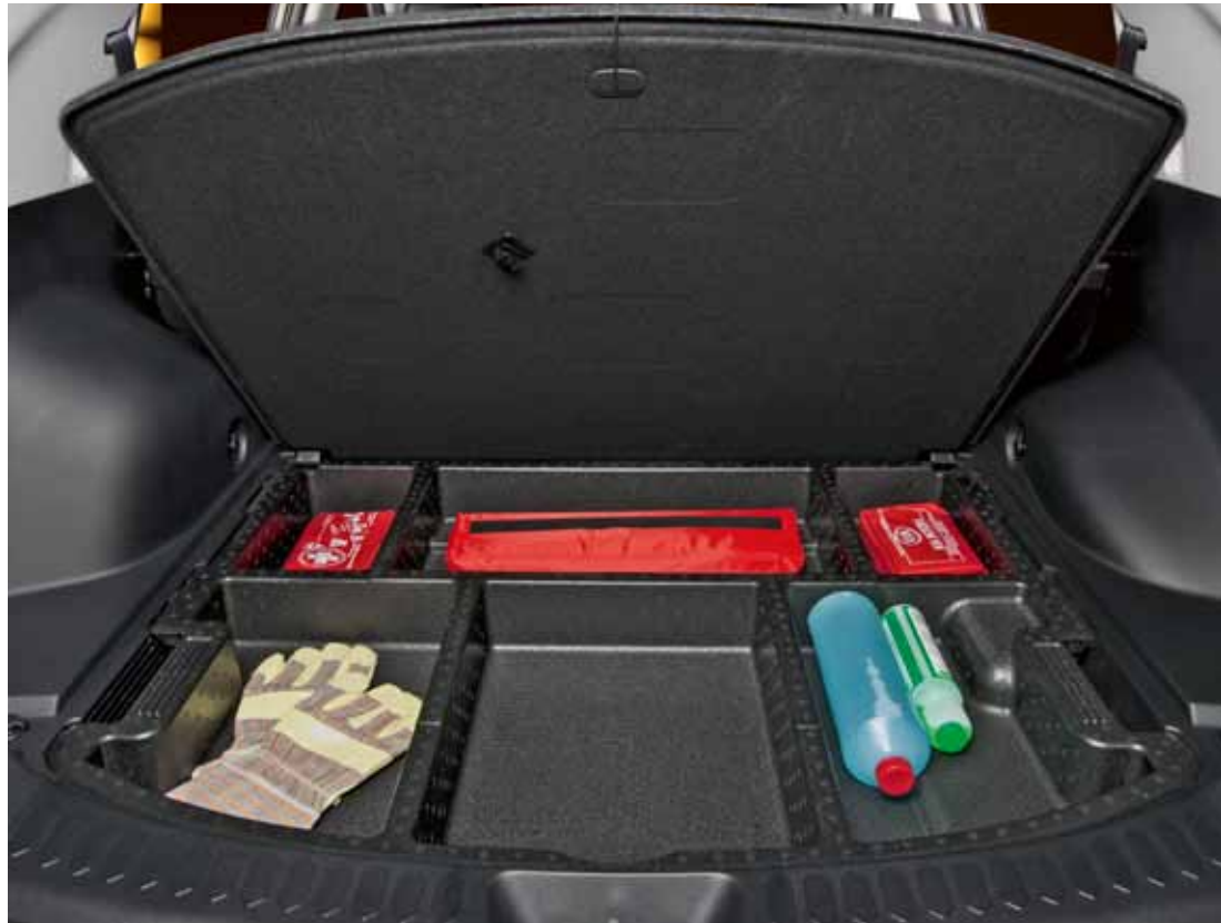
Gutes Versteck: das Staufach im Laderaumboden (ATTRACT, VISION ohne Technikpaket)