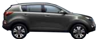
Phönixsilber Met. AA4