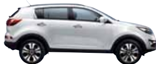
Kirunasilber Met. 9S