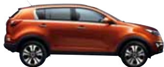
Technorange Met. D2A