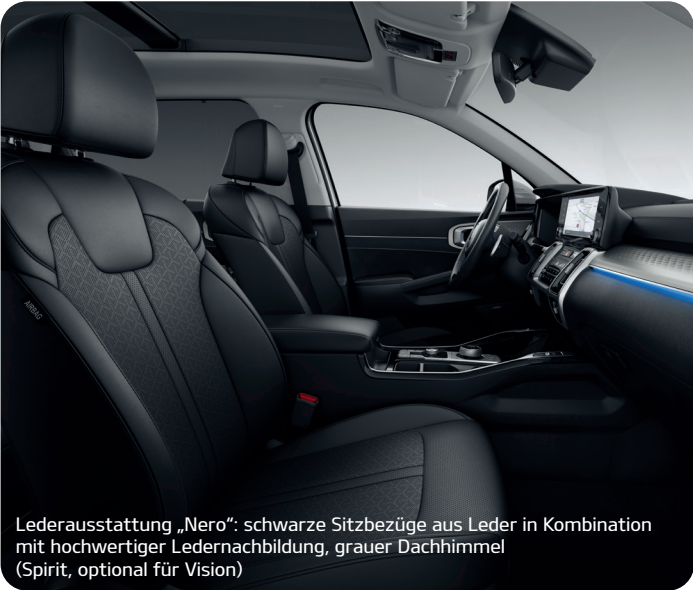
Lederausstattung „Nero“: schwarze Sitzbezüge aus Leder in Kombination mit hochwertiger Ledernachbildung, grauer Dachhimmel (Spirit, optional für Vision)