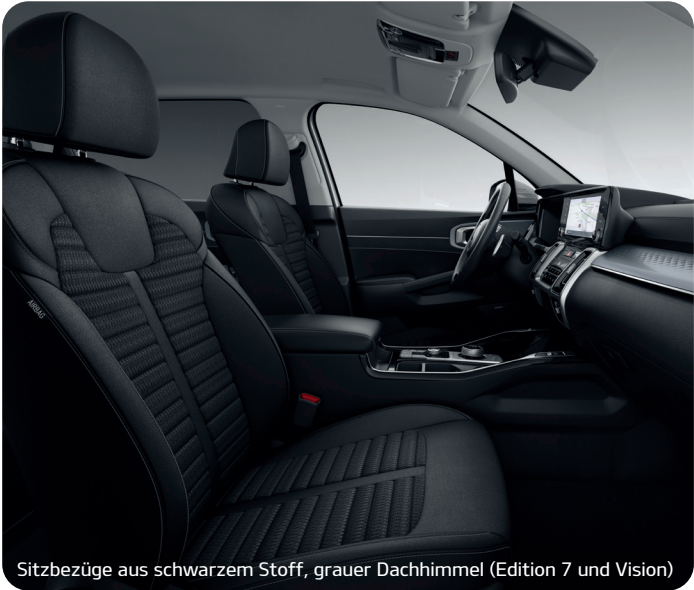
Sitzbezüge aus schwarzem Stoff, grauer Dachhimmel (Edition 7 und Vision)

Abbildungen zeigen kostenpflichtige Sonderausstattung. Darstellung: Repräsentation für Sitzkonfiguration.