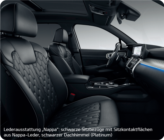
Lederausstattung „Nappa“: schwarze Sitzbezüge mit Sitzkontaktflächen aus Nappa-Leder, schwarzer Dachhimmel (Platinum)

Der Kia Sorento zeigt sich im Interieur ebenso elegant und stilvoll wie im äußeren Auftritt. Das Ausstattungsspektrum beinhaltet neben hochwertigen schwarzen Stoffsitzen drei verschiedene Ledervarianten: in Schwarz, zweifarbig in Schwarz-Hellgrau sowie in Schwarz mit Sitzkontaktflächen in Nappa-Leder.