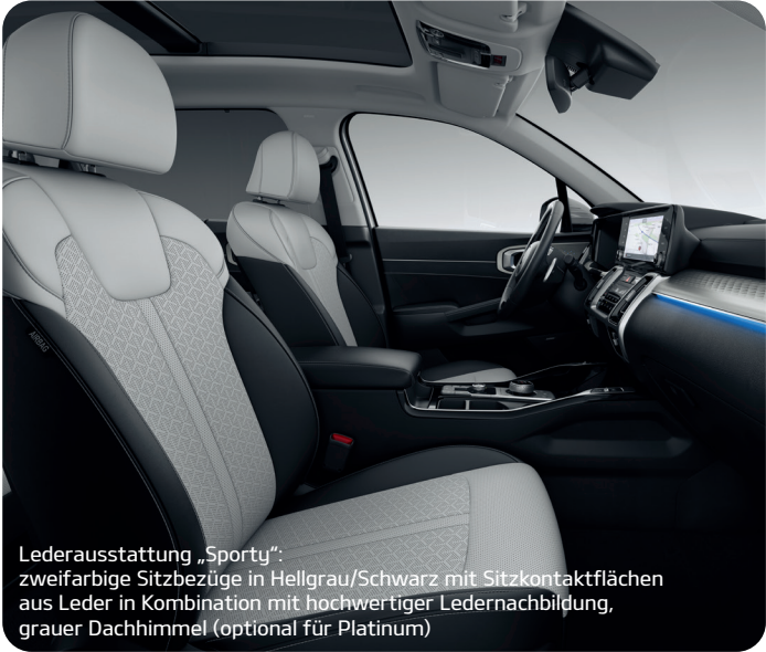
Lederausstattung „Sporty“: zweifarbige Sitzbezüge in Hellgrau/Schwarz mit Sitzkontaktflächen aus Leder in Kombination mit hochwertiger Ledernachbildung, grauer Dachhimmel (optional für Platinum)