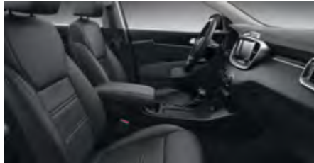
SILBER & GOLD WK - Schwarz Textilsitze