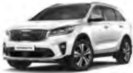
Clear White (UD) 1