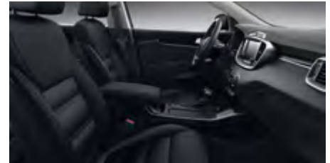
PLATIN WK - Schwarz Echtledersitze