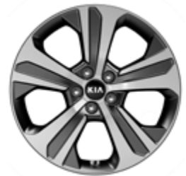
PLATIN & GT-LINE Leichtmetallfelgen 19 Zoll mit 235/55 R19 Bereifung