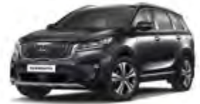
Platinum Graphite (ABT) 2