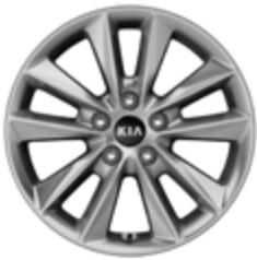
TITAN & SILBER Leichtmetallfelgen 17 Zoll mit 235/65 R17 Bereifung