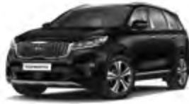
Rich Espresso (DN9) 2*