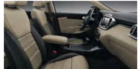
PLATIN BHH - Schwarz/Beige Echtledersitze