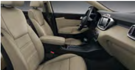
TITAN BHH - Beige Textilsitze