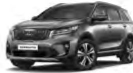
Steel Gray (KLG) 2