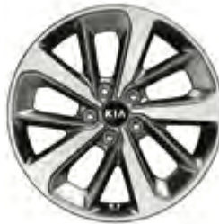
GOLD Leichtmetallfelgen 18 Zoll mit 235/60 R18 Bereifung