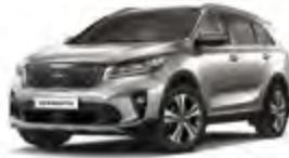
Silky Silver (4SS) 2