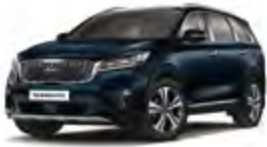
Gravity Blue (B4U) 2