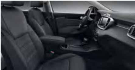
TITAN WK - Schwarz Textilsitze