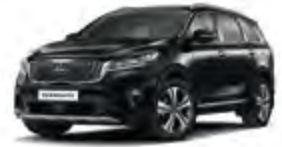
Aurora Black Pearl (ABP) 3