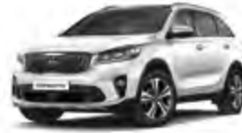
Snow White Pearl (SWP) 3