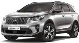
Seidensilber Metallic (4SS)