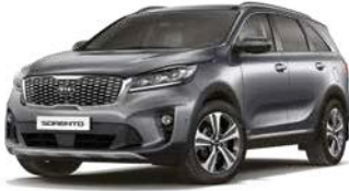
Stahlgrau Metallic (KLG)