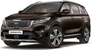
Espressobraun Metallic (DN9)