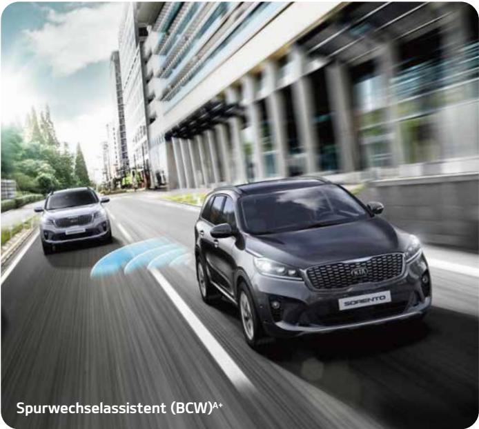
Spurwechselassistent (BCW) A*

Der Spurwechselassistent arbeitet radargestützt. Das System erkennt herannahende Fahrzeuge im Bereich des toten Winkels und warnt den Fahrer akustisch und optisch vor einem Fahrspurwechsel.