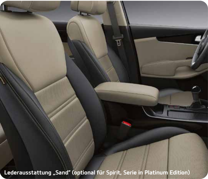
Lederausstattung „Sand“ (optional für Spirit, Serie in Platinum Edition)