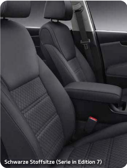
Schwarze Stoffsitze (Serie in Edition 7)