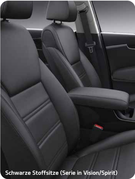
Schwarze Stoffsitze (Serie in Vision/Spirit)