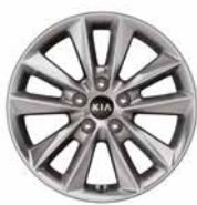
235/65R 17-Zoll-Leichtmetallfelgen (Edition 7 und Vision)

Bei einigen unserer modernen Metallicfarben werden bewusst unterschiedliche Farbpigmente verwendet. Dadurch können unter bestimmten Lichtverhältnissen, z.B. direktes Sonnenlicht, attraktive Farbeffekte erzielt werden. Zum Teil kann die Farbe changieren, z.B. von Schwarz zu Dunkelblau. Bei den hier abgebildeten Farbdarstellungen kann es aufgrund der Drucktechnik zu Abweichungen zu den Originalfarben kommen. Weitere Informationen zu den Farbeffekten und Grundfarben gibt Ihnen gerne Ihr Kia-Vertragshändler. Metalliclackierungen sind aufpreispflichtig.