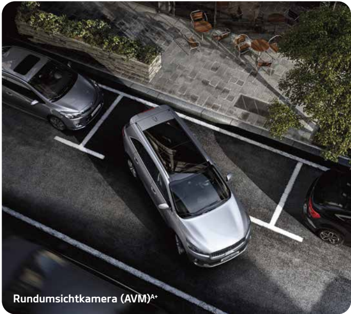
Rundumsichtkamera (AVM) A*

Die modernen, intelligenten Assistenzsysteme helfen, das Fahren im Kia Sorento sicherer und entspannter zu machen.