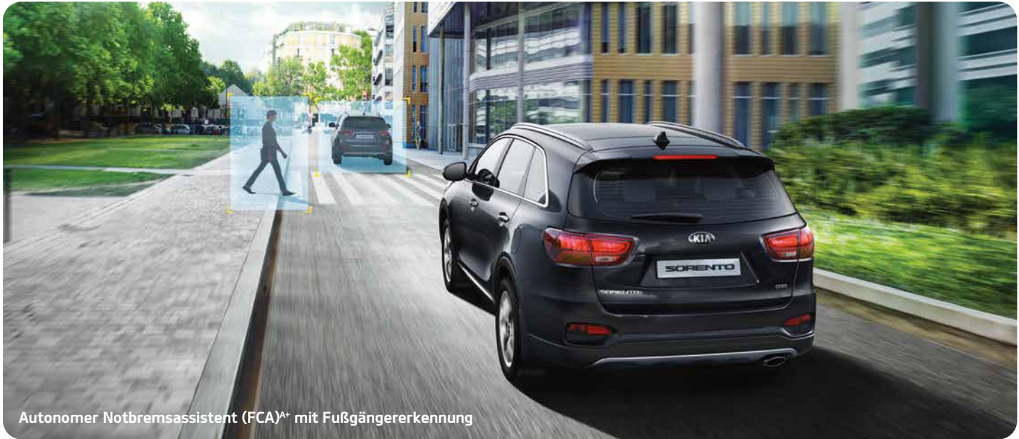
Autonomer Notbremsassistent (FCA) A* mit Fußgängererkennung

Dieses System erfasst mit einer Kamera Tempolimits und Überholverbote und zeigt sie – nach Einbeziehung der Informationen aus den Navigationskarten – in der Instrumenteneinheit und auf dem Navigationsdisplay an.