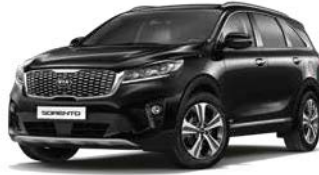
Auroraschwarz Metallic (ABP)

Bei einigen unserer modernen Metallicfarben werden bewusst unterschiedliche Farbpigmente verwendet. Dadurch können unter bestimmten Lichtverhältnissen, z.B. direktes Sonnenlicht, attraktive Farbeffekte erzielt werden. Zum Teil kann die Farbe changieren, z.B. von Schwarz zu Dunkelblau. Bei den hier abgebildeten Farbdarstellungen kann es aufgrund der Drucktechnik zu Abweichungen zu den Originalfarben kommen. Weitere Informationen zu den Farbeffekten und Grundfarben gibt Ihnen gerne Ihr Kia-Vertragshändler. Metalliclackierungen sind aufpreispflichtig.