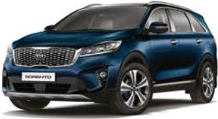
Gravity Blau Metallic (B4U)