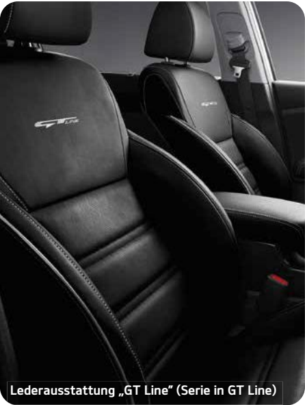
Lederausstattung „GT Line“ (Serie in GT Line)

Abbildungen zeigen kostenpflichtige Sonderausstattung.