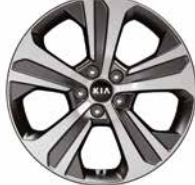
235/55R 19-Zoll-Leichtmetallfelgen (GT Line und Platinum Edition)

Detaillierte Informationen zum Kia Sorento finden Sie unter www.kia.com/de/broschuere . Dort können Sie sich auch die komplette Modellbroschüre herunterladen.