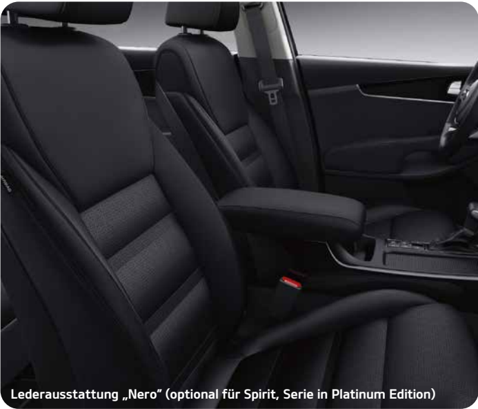
Lederausstattung „Nero“ (optional für Spirit, Serie in Platinum Edition)

Der Kia Sorento verfügt serienmäßig über ein schwarzes Interieur. Für die Versionen Spirit und Platinum Edition haben Sie zudem die Wahl zwischen der schwarzen Lederausstattung (Sitzkontaktflächen in Leder) „Nero“ und der Lederausstattung (Sitzkontaktflächen in Leder) „Sand“ mit einer Kombination aus Schwarz und Beige.