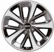
235/60R 18-Zoll-Leichtmetallfelgen (Spirit)