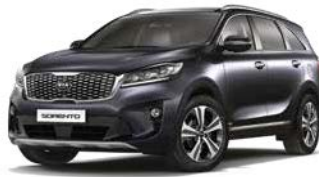
Graphit Metallic (ABT)