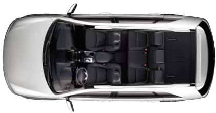
3. Sitzreihe umgeklappt