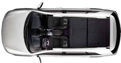
2. und 3. Sitzreihe umgeklappt