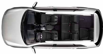
3. Sitzreihe teilweise umgeklappt

Variabilität der Sitzanordnung: Wer einen Sorento wählt, entscheidet sich für Stil – und Flexibilität. Kaum ein anderes Fahrzeug seiner Klasse ermöglicht so bequeme Sitz-Kombinationen, die ein komfortables, sicheres Reisen gewährleisten. Der lange Innenraum bietet Platz, um sich auszustrecken. Und Platz, um weitere Freunde mit auf die Reise zu nehmen. Die 2. und 3. Sitzreihe (optional ab VISION) lassen sich teilweise oder vollständig einklappen. Die 3. Reihe ist im Verhältnis 50:50 geteilt, die 2. Reihe im Verhältnis 60:40.