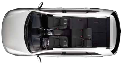
2. und 3. Sitzreihe teilweise umgeklappt