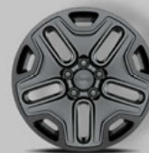
Serienausstattung: 17" Leichtmetallräder in Schwarz (9S4)