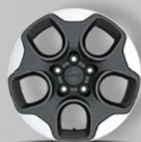
Sonderausstattung: 16" Leichtmetallräder in Dunkelgrau/Silber (9S1)