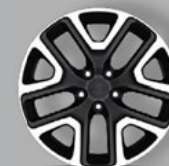
oder Schwarz/Silber (WPR)