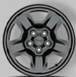
Serienausstattung: 16" Design-Stahlfelgen in Schwarz (WDJ)