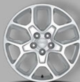
Sonderausstattung: 17" Leichtmetallräder in Silber (9S2)