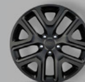
oder Schwarz* (9S6)