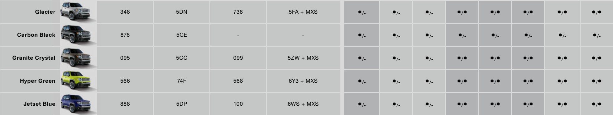
3-Schicht-Sonderlackierung / Zweifarb-Lackierung mit Dach Kontrastfarbe Schwarz