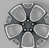
oder Grau/Silber (9S5)