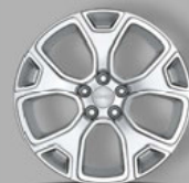
Sonderausstattung: 18" Leichtmetallräder in Silber (WPD)