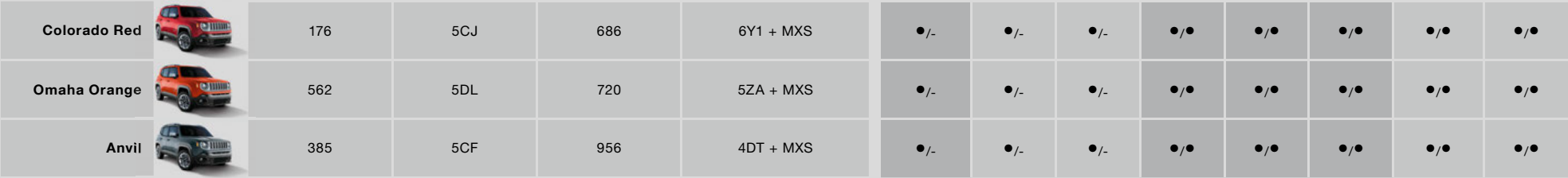
Metallic-Lackierungen / Zweifarb-Lackierung mit Dach Kontrastfarbe Schwarz