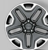
Sonderausstattung: 17" Leichtmetallräder in Schwarz/Silber (9S3)