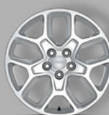
Serienausstattung: 17" Leichtmetallräder in Silber (9S2)