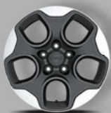
Serienausstattung: 16" Leichtmetallräder in Dunkelgrau/Silber (9S1)