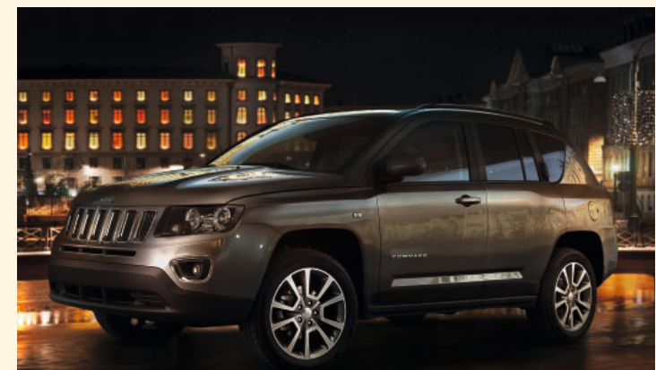
Leichtmetallräder 7,0 x 18 Zoll mit Bereifung 215/55 R18 für den Jeep® Compass Limited