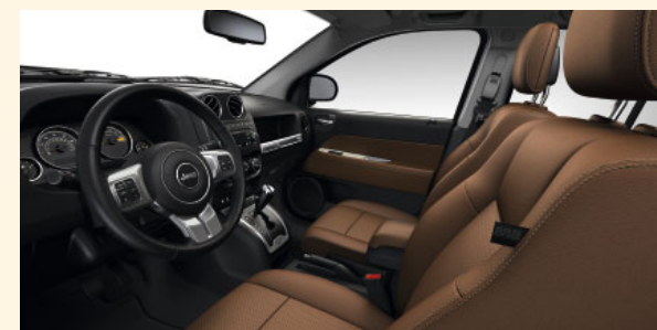
Innenausstattung Limited Dark Saddle Brown

Kraftstoffverbrauch und CO 2 -Emissionen siehe Seite 6 „Fahrzeugdaten“.