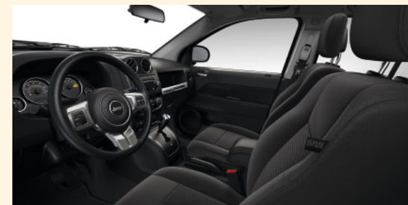
Innenausstattung Sport Dark Slate Gray