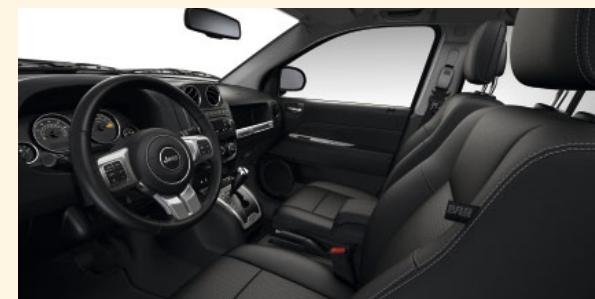
Innenausstattung Limited Dark Slate Gray