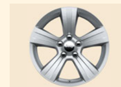
Leichtmetallräder 6,5 x 17 Zoll mit Bereifung 215/60 R17 für den Jeep® Compass Sport/North Sport: Finish in Tech Silver, North: Finish in Mineral Grey