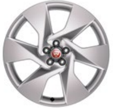
20" Leichtmetallfelge „Style 6007“, 6 Speichen