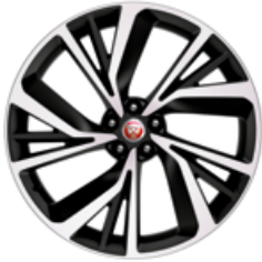
22" Leichtmetallfelge „Style 5056“, 5 Doppelspeichen, Diamant gedreht