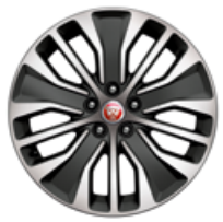
18" Leichtmetallfelge „Style 5055“, 5 Doppelspeichen

Gestalten Sie Ihr Fahrzeug mit einer großen Auswahl an Leichtmetallfelgen in modernen und dynamischen Designs ganz nach Ihrem Geschmack.