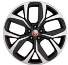
20" Leichtmetallfelge „Style 5068“, 5 Speichen, Diamant gedreht