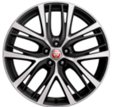
20" Leichtmetallfelge „Style 5070“, 5 Doppelspeichen, Grau Diamant gedreht