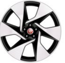
20" Leichtmetallfelge „Style 6007“, 6 Speichen, Diamant gedreht