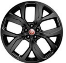
20" Leichtmetallfelge „Style 5068“, 5 Speichen, Schwarz glänzend