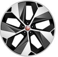
22" Leichtmetallfelge „Style 5069“, 5 Speichen, Grau, Karbon Einsatz