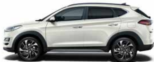
Polar White Uni 1