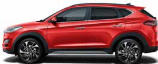
Engine Red Uni