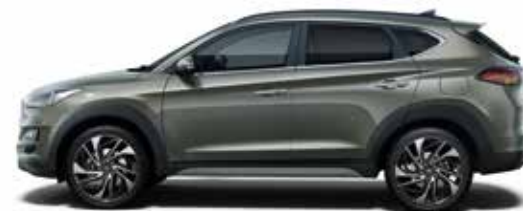
Olivine Grey Metallic 1