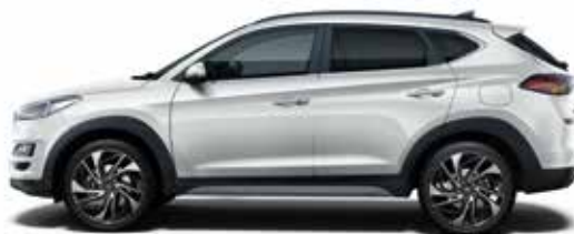
Platinum Silver Mineraleffekt 1