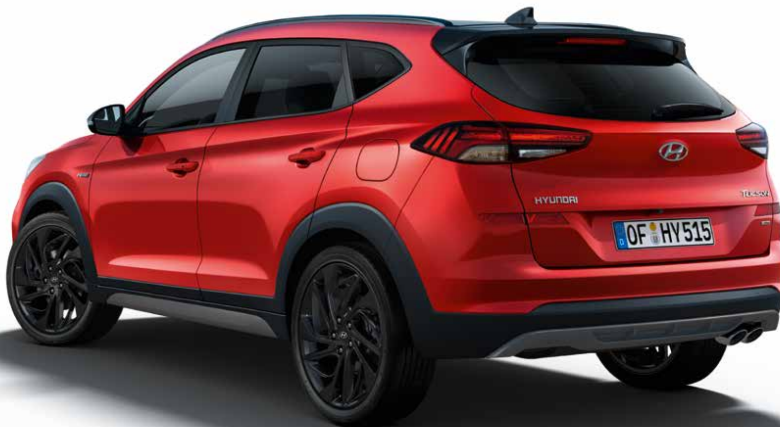
Aerodynamischer Heckspoiler, Dachreling, Außenspiegel und Haifischantenne in Schwarz. Abgasanlage mit ovaler Doppelendrohrblende.