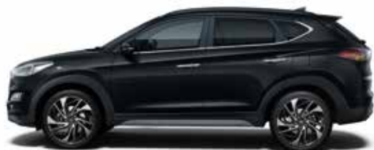
Phantom Black Mineraleffekt 1