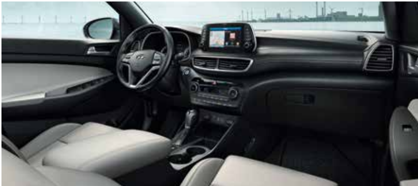
Innenausstattung in Grau mit Dachhimmel in Schwarz