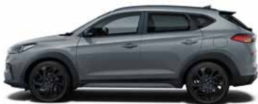
Shadow Grey Uni 1,4