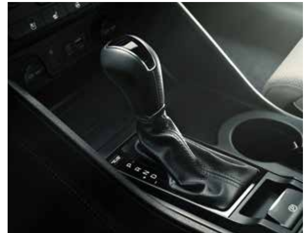
7-Gang-Doppelkupplungsgetriebe (DCT) und 8-Stufen-Automatikgetriebe (AT)