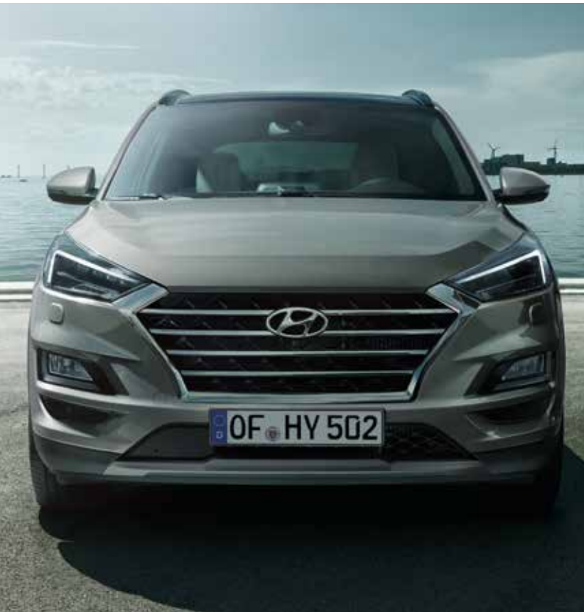
Neu gestaltete Frontpartie mit Kaskadenkühlergrill.

Die neu designten Voll-LED-Scheinwerfer verleihen dem neuen Hyundai Tucson ein markantes Äußeres und noch mehr Sportlichkeit. Sie gehen fließend in den oberen Teil des neuen Kaskadenkühlergrills über, das Herzstück der neu gestalteten Frontpartie. Stoßstange und Heckschürze wurden ebenfalls überarbeitet, um den dynamischen Auftritt noch zu verstärken. So hebt sich der neue Hyundai Tucson immer und überall von der Masse ab. Sie werden sich also an viel Aufmerksamkeit gewöhnen müssen.