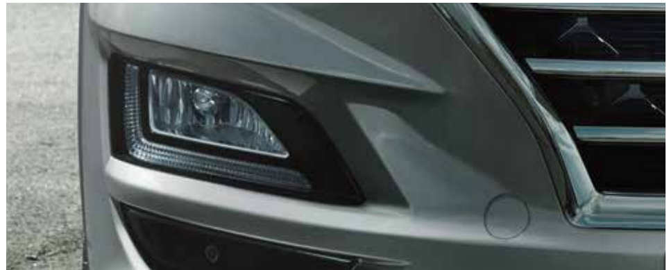
Nebelscheinwerfer und LED-Tagfahrlicht.