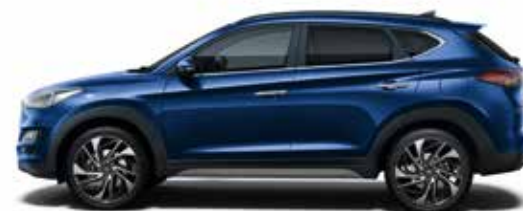
Stellar Blue Metallic 1,3