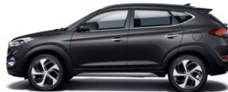
Phantom Black Mineraleffekt