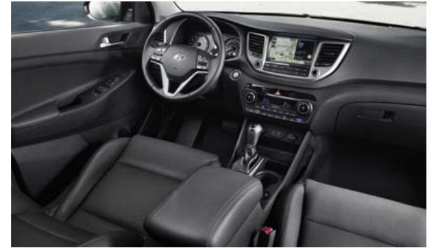
Schwarz, für Leder 1 oder Stoff erhältlich