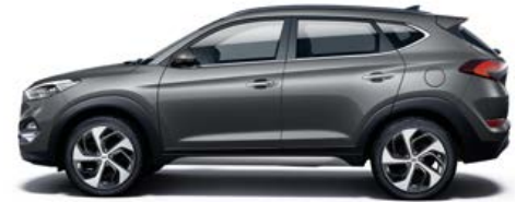
Micron Grey Mineraleffekt