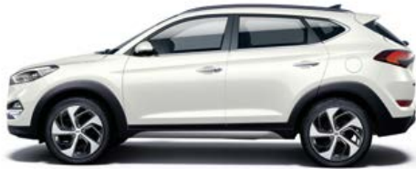
Polar White Uni

Ganz nach Ihrem Geschmack und Ihren Vorlieben. Der neue Hyundai Tucson ist in den verschiedensten Außenfarben und in Kombination mit drei Interieur-Farben erhältlich. In jedem Fall können Sie Ihrer Wahl mit Zusatzausstattungen und Zubehör eine noch persönlichere Note verleihen. Der Hyundai Händler in Ihrer Nähe wird Sie gern zu den möglichen Kombinationen beraten.