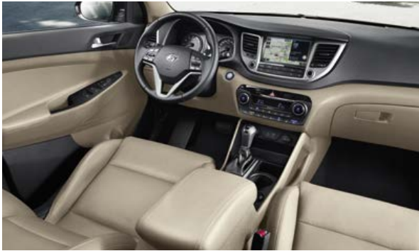
Beige + Schwarz, Leder 1 in zwei Farbtönen