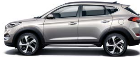
White Sand Metallic