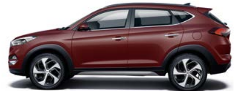
Ruby Wine Mineraleffekt