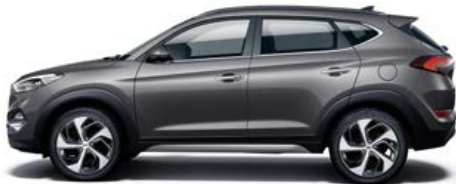
Thunder Grey Mineraleffekt