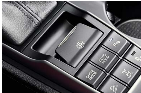
Elektrische Parkbremse 1 . Durch die kompakte Parkbremsen-Steuerung mit praktischer Auto-Release-Funktion wird nutzbarer Platz zwischen den Vordersitzen frei.

Der komplett neu aufgebaute Hyundai Tucson bietet eine Vielzahl von innovativen Technologien zur Verbesserung der Leistung, des Fahrverhaltens und des Fahrkomforts. Angeboten werden drei Dieselmotoren und zwei Benziner mit einer Leistung zwischen 116 und 185 PS. Sie haben die Wahl zwischen einem Sechs-Gang-Schalt- oder Automatikgetriebe und dem neuen Sieben-Gang-Doppelkupplungsgetriebe (DCT). Der zuschaltbare Vierradantrieb und die weiterentwickelte Traktionskontrolle (ATCC) halten Sie auch in ganz scharfen Kurven in der Spur.