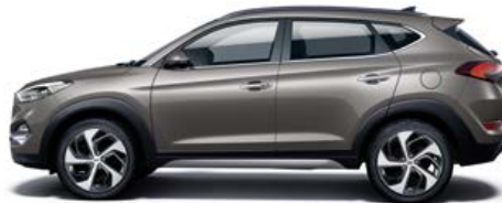
Moon Rock Mineraleffekt