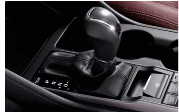
Doppelkupplungstechnologie. Das Sieben-Gang-Doppelkupplungsgetriebe (DCT) bietet deutliche Vorteile hinsichtlich Leistung und Kraftstoffverbrauch. Erhältlich mit dem 177 PS starken 1.6 T-GDI-Motor.