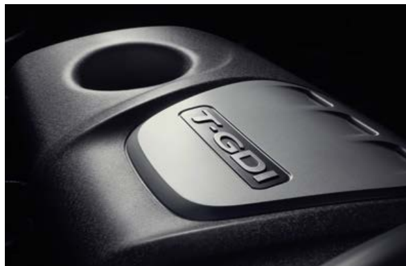
1.6 Turbo GDI. Der neue Turbomotor mit beeindruckenden 177 PS bietet die optimale Kombination von Leistung und Kraftstoffverbrauch.