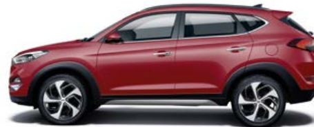
Ultimate Red Mineraleffekt