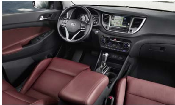
Weinrot + Schwarz, Leder 1 in zwei Farbtönen