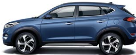
Ash Blue Mineraleffekt