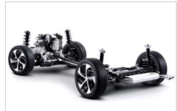
Zuschaltbarer Allradantrieb. Bei potenziellem Traktionsverlust werden bis zu 50 % des Drehmoments auf die Hinterräder übertragen, um die Haftung auf losem, rutschigem Untergrund und das Kurvenverhalten zu verbessern. Bei extremen Bedingungen kann die Drehmomentverteilung im 50 : 50-Modus arretiert werden.