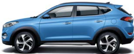
Ara Blue Metallic