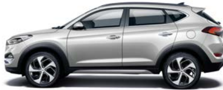
Platinum Silver Metallic