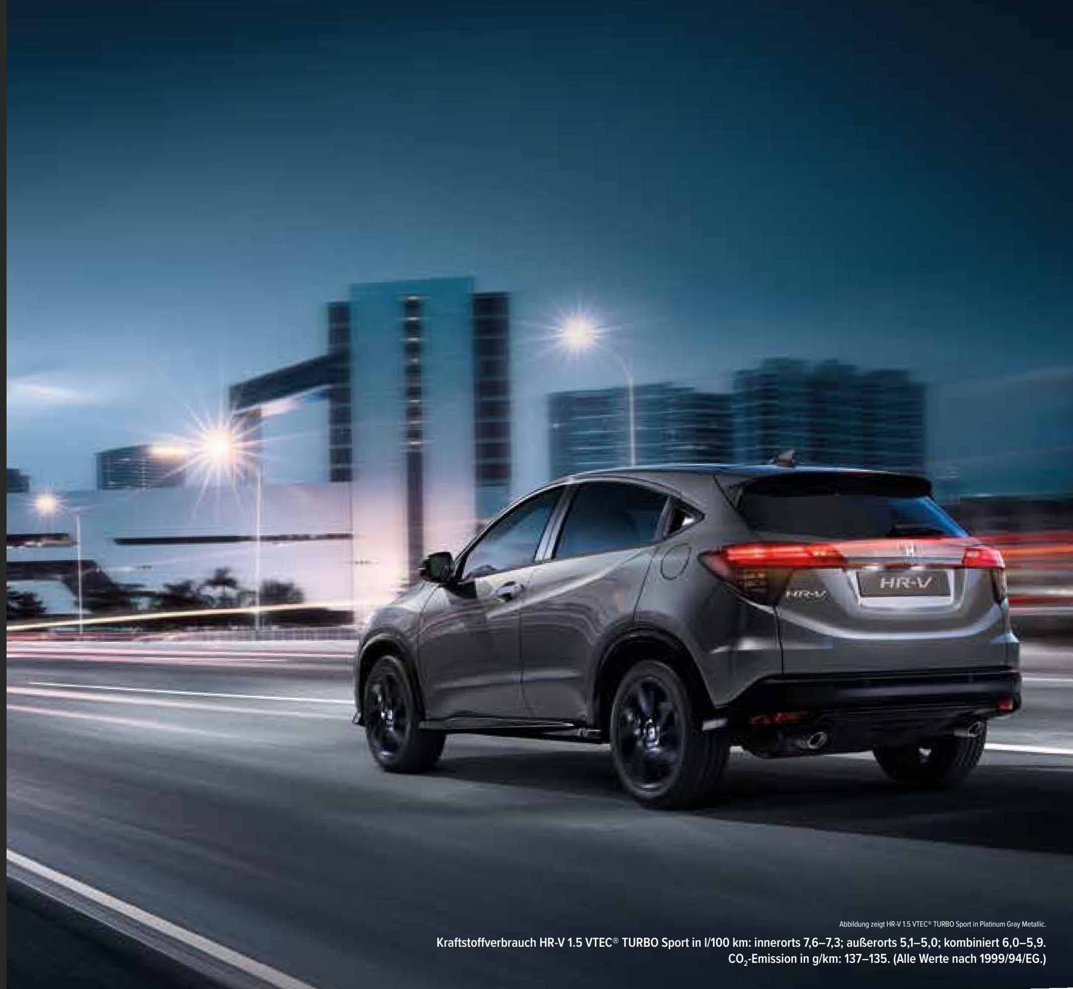
Abbildung zeigt HR-V 1.5 VTEC® TURBO Sport in Platinum Gray Metallic.

Die dazu passende Motorisierung mit dem 1.5 VTEC® TURBO mit 182 PS (134 kW) ist äußerst durchzugsstark. Freuen Sie sich auf den Rausch der Beschleunigung, die Sie in den Sitz presst. Zusätzlich tragen fortschrittliche Technologien wie Agile Handling Assist, Performance-Stoßdämpfer und variable Übersetzungsverhältnisse zum sportlichen und dynamischen Fahrgefühl bei.