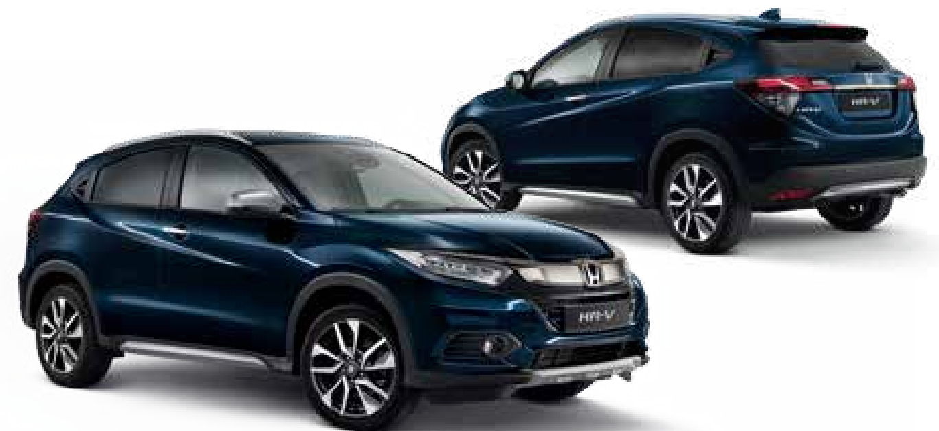
Abb. zeigen 18-Zoll-Leichtmetallfelgen HR1803.

Das Paket beinhaltet: Aero-Sportstoßfänger vorne und hinten, Dachspoiler in Wagenfarbe lackiert sowie Seitentrittbretter.