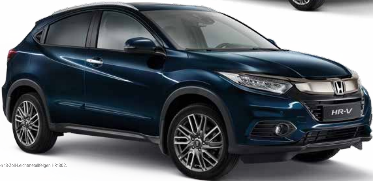
Abb. zeigen 18-Zoll-Leichtmetallfelgen HR1802.