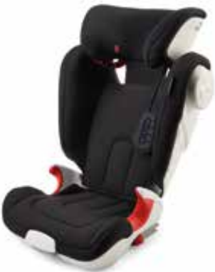
KINDERSITZERHÖHUNG GRUPPE 2+3, KIDFIX