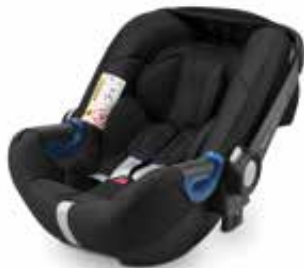
BABYSCHALE GRUPPE 0+, i-SIZE GO