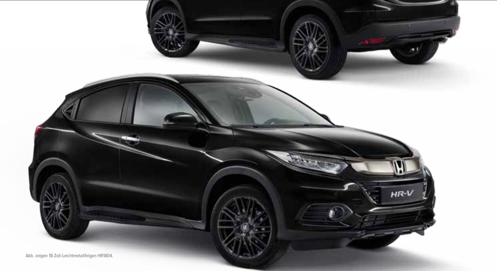
Abb. zeigen 18-Zoll-Leichtmetallfelgen HR1804.

Das Black-Edition-Paket verleiht Ihrem Fahrzeug ein intensives, kraftvolles Aussehen.