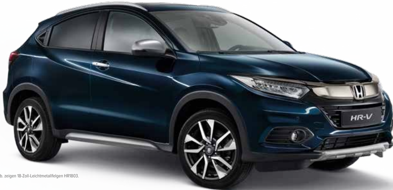
Abb. zeigen 18-Zoll-Leichtmetallfelgen HR1803.

Steigern Sie die Individualität Ihres HR-V mit den perfekt integrierten Wechselverkleidungen für die Außenspiegel in Matt-Silber (ersetzen Original). Ein Set besteht aus zwei Verkleidungen.