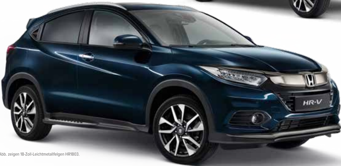
Abb. zeigen 18-Zoll-Leichtmetallfelgen HR1803.