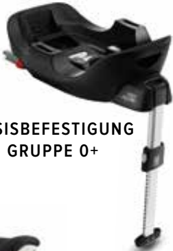
BASISBEFESTIGUNG GRUPPE 0+