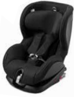
KINDERSITZ GRUPPE 1+, i-SIZE TRIFIX