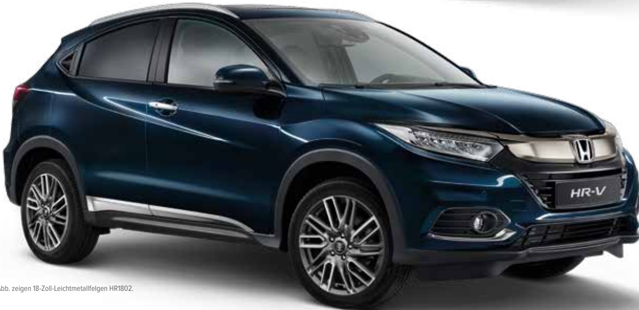
Abb. zeigen 18-Zoll-Leichtmetallfelgen HR1802.

Machen Sie Ihren HR-V mit dieser Dekorleiste für den Frontstoßfänger zu einer noch markanteren und eleganteren Erscheinung.