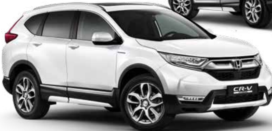
Abb. zeigt 19"-Leichtmetallfelgen CR1901 (separat erhältlich)

Das Style-Paket greift in Akzenten die Außenfarbe Ihres CR-V auf und gibt Ihrem Fahrzeug einen harmonischen Look. Das Paket beinhaltet: Stoßfängerverkleidungen vorne und hinten sowie Seitenschwellerverkleidungen – alle Teile in Wagenfarbe lackiert.