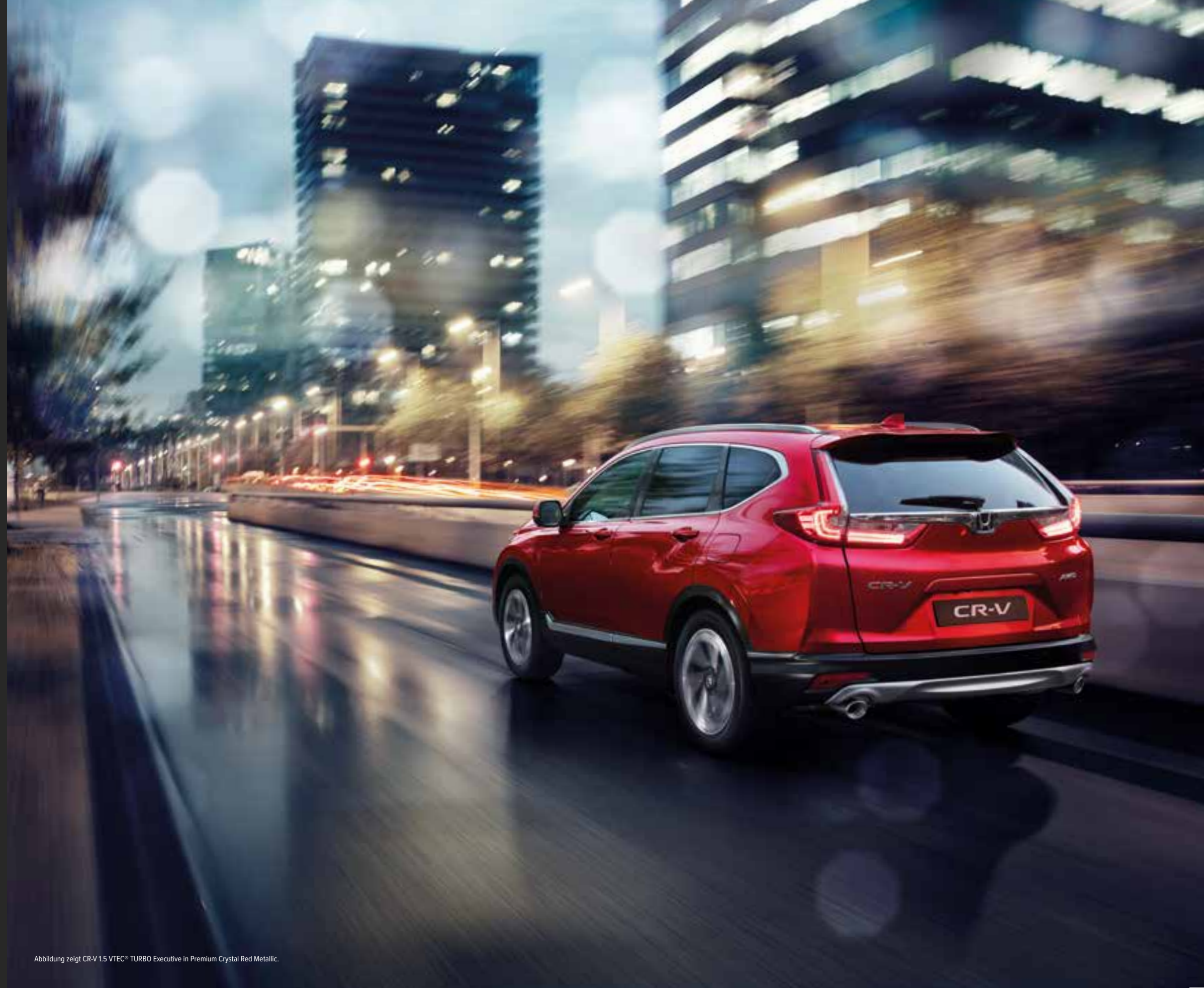
Abbildung zeigt CR-V 1.5 VTEC® TURBO Executive in Premium Crystal Red Metallic.

* Nur bei ausgewählten Modellvarianten erhältlich.