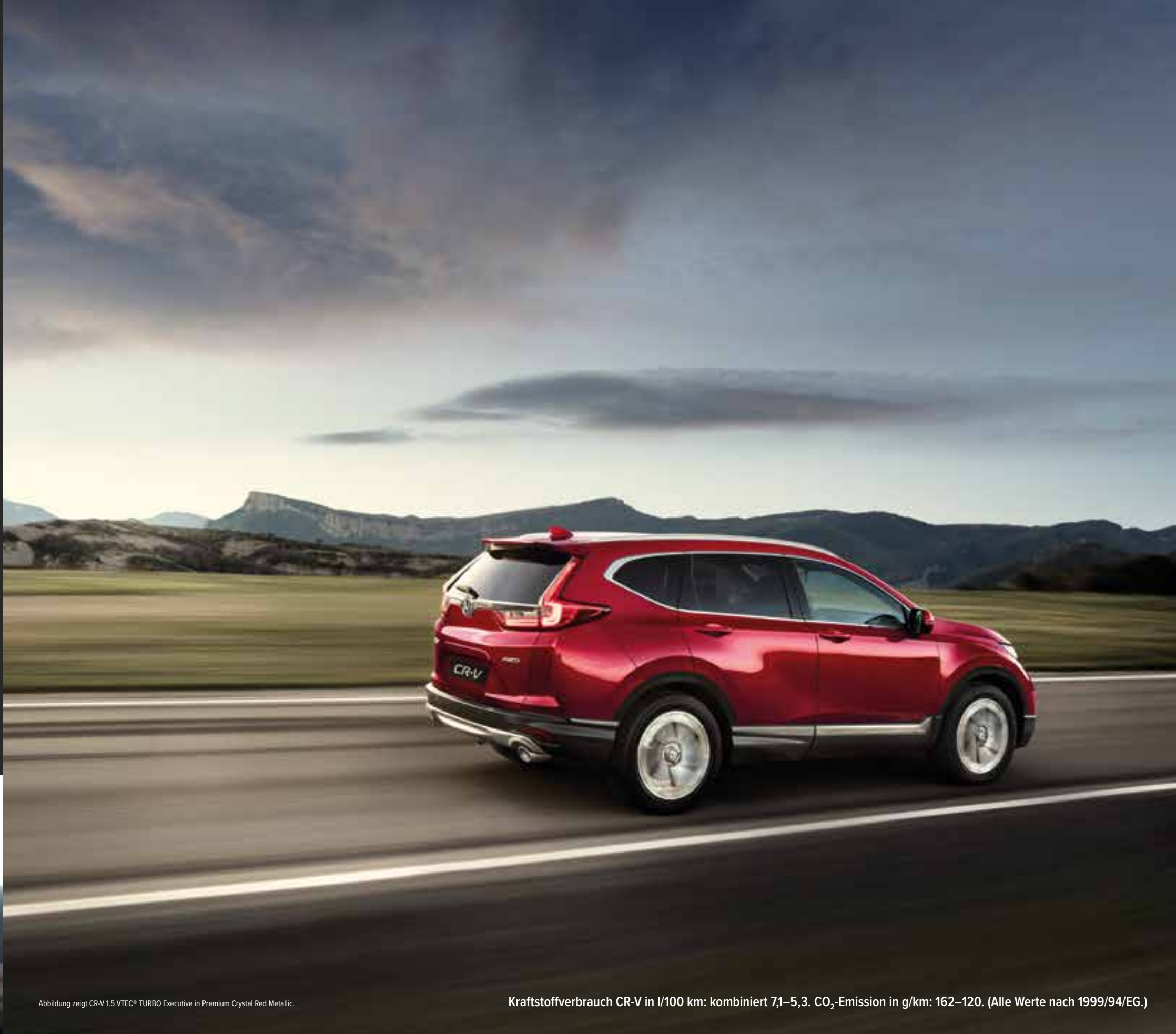
Abbildung zeigt CR-V 1.5 VTEC® TURBO Executive in Premium Crystal Red Metallic.

Kraftstoffverbrauch CR-V in l/100 km: kombiniert 7,1–5,3. CO 2 -Emission in g/km: 162–120. (Alle Werte nach 1999/94/EG.)