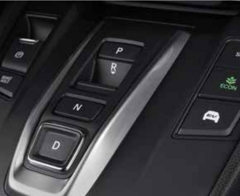
Abbildung zeigt CR-V 2.0 i-MMD Hybrid Executive in Platinum White Pearl.

Beim Fahren im Engine Drive werden die Räder vom Benzinmotor angetrieben. Bei Bedarf liefert der elektrische Antriebsmotor unter bestimmten Bedingungen per „Boost“-Effekt zusätzliches Drehmoment. Ein etwaiger Energieüberschuss des Benzinmotors wird zum Laden der Batterie verwendet.