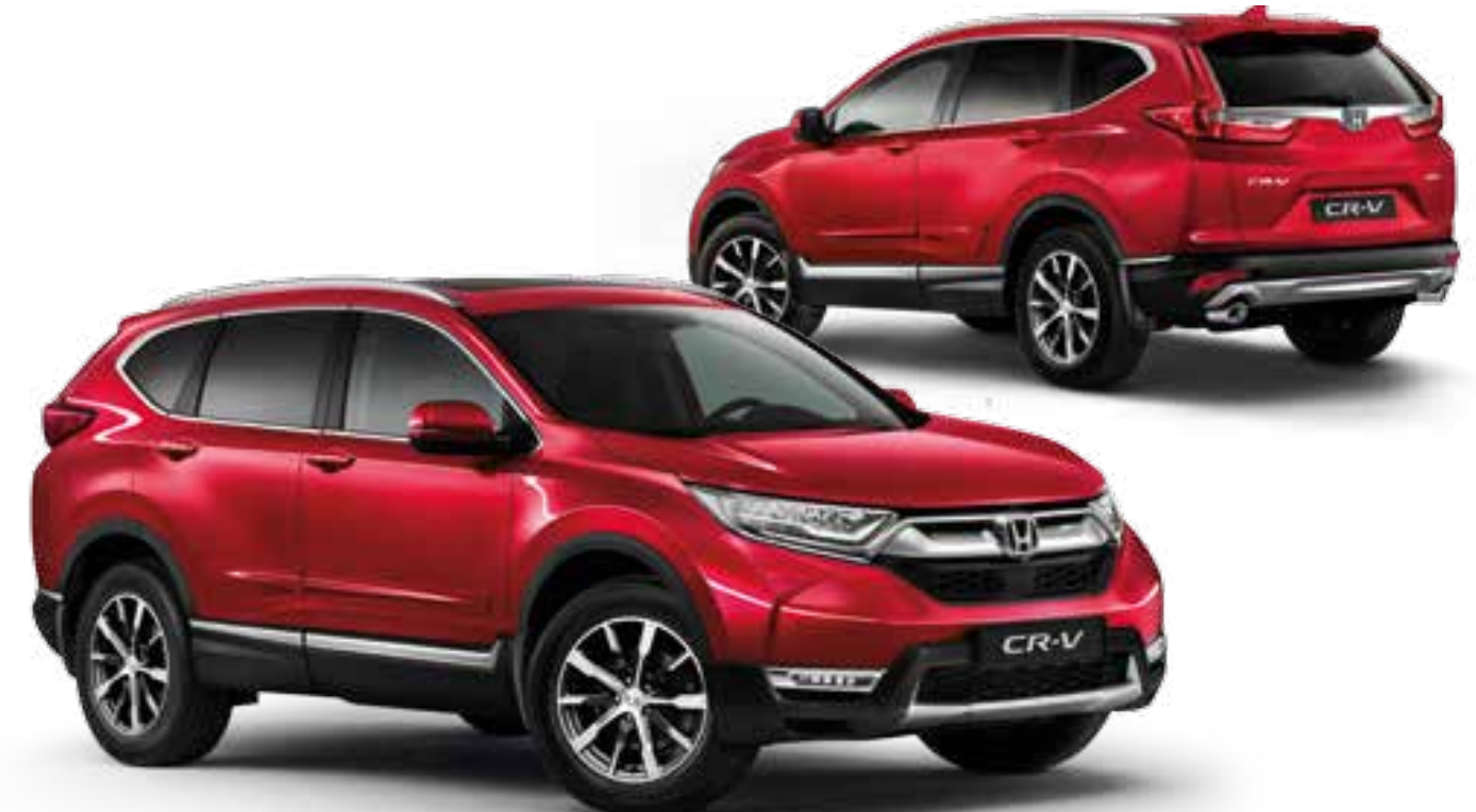
Abb. zeigen 19"-Leichtmetallfelgen CR1901.

Hinweis: Optional können die vier Sensoren für die hintere Stoßstange, die serienmäßig schwarz/anthrazit sind, in Wagenfarbe bestellt werden.