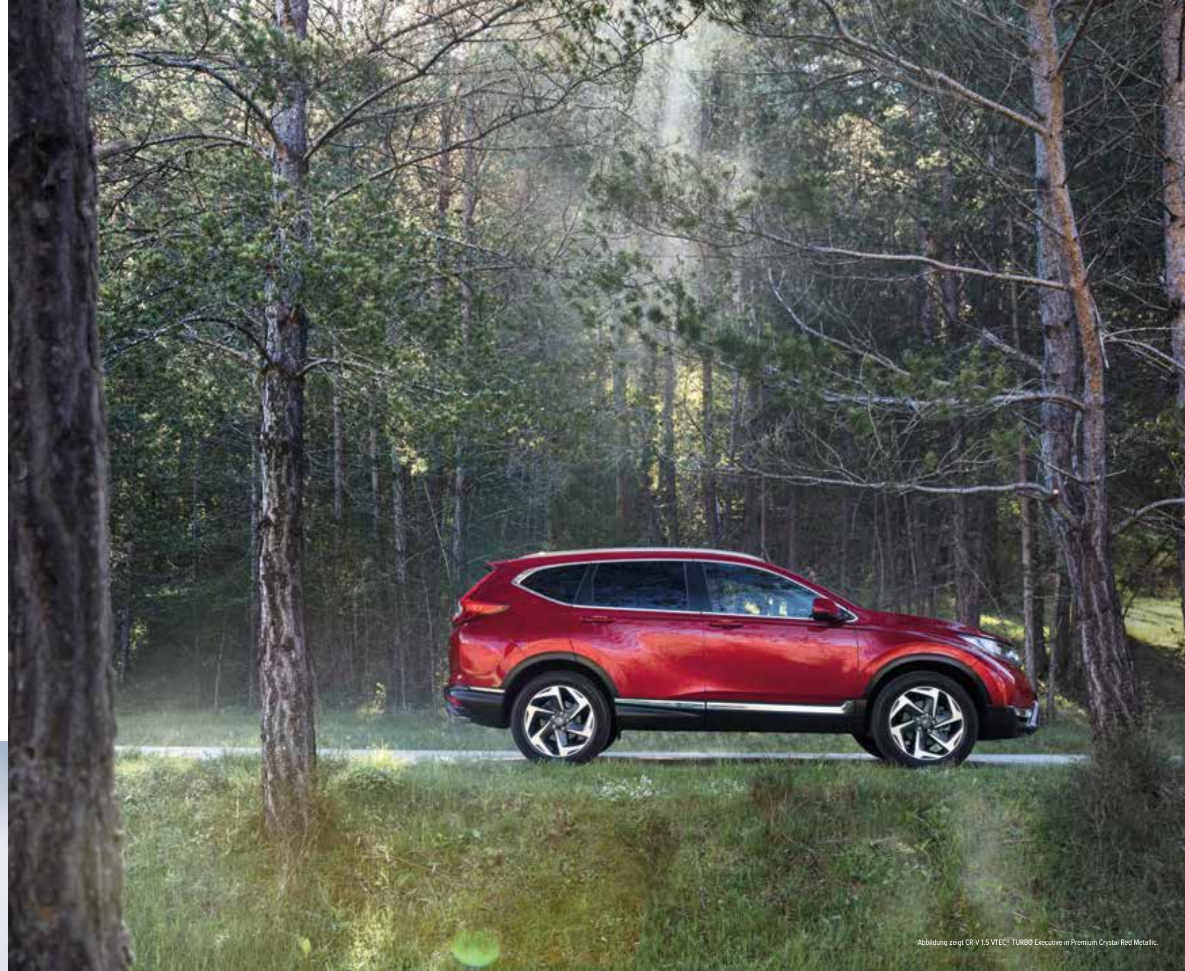
Abbildung zeigt CR-V 1.5 VTEC® TURBO Executive in Premium Crystal Red Metallic.