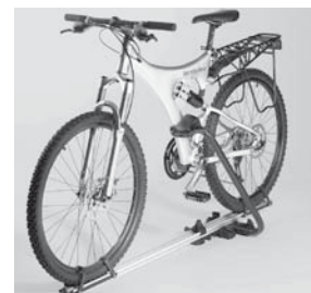
Fahrradhalter New Alustyle