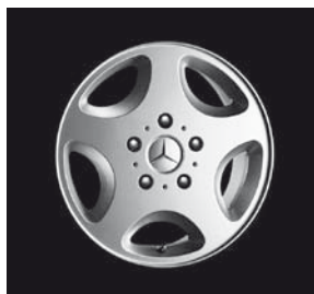
16" Atik, 5-Loch-Design