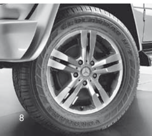
Serienfelge G 500