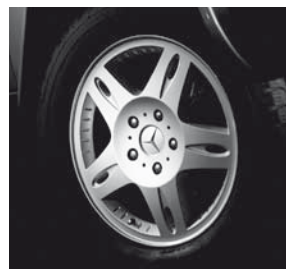
18" Ashtaroth, 5-Speichen-Design