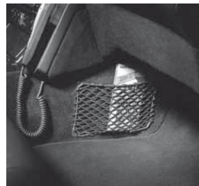
Gepäcknetz im Beifahrerfußraum