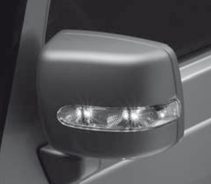
Außenspiegel in Wagenfarbe