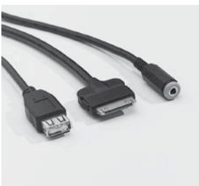
Media Interface Consumer-Kabel Kit