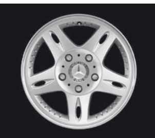
Serienfelge G 320 CDI