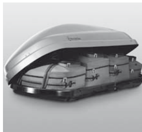
Maßtaschenset für Dachbox »L«