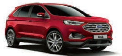
Ruby-Rot spezielle Metallic-Lackierung*