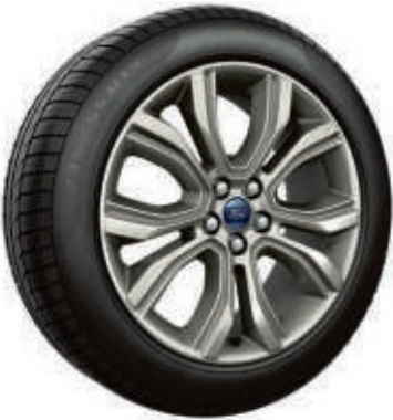
19" Leichtmetallräder im 5x2-Speichen-Design (Serienausstattung bei Titanium)