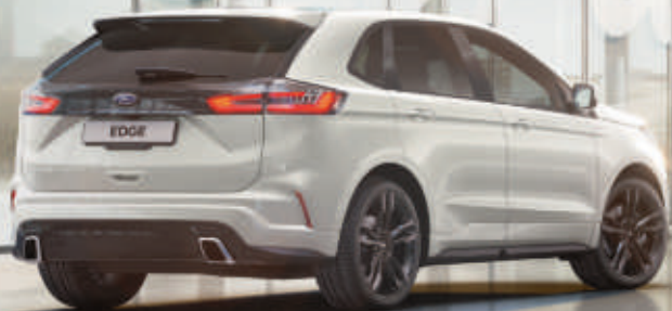
Edge ST-Line in Arktis-Weiß Metallic mit 21"-Leichtmetallrädern im 5x2-Speichen-Design, schwarz (Wunschausstattung).