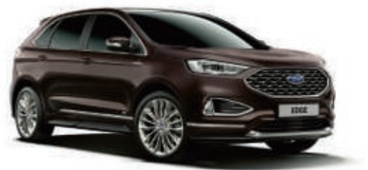
Ametista Scura ® spezielle Metallic-Lackierung*

Wir haben uns für Ruby-Rot entschieden. Welche Farbe nehmen Sie?