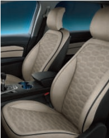
Exklusive Lederpolsterung, wabenförmig abgesteppt** in Hellbeige (Serienausstattung bei Vignale)