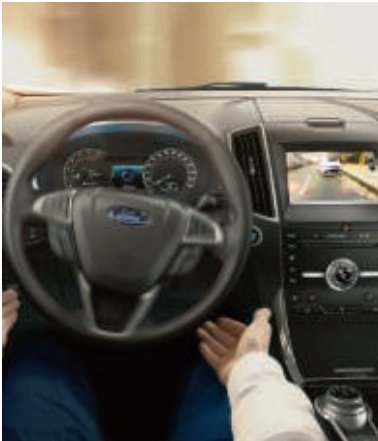
Bestandteil der Fahrerassistenz-Technologie Ford Co-Pilot360.

Der Einpark-Assistent ermittelt mit Hilfe von Ultraschall-Sensoren, ob eine Parklücke ausreichend groß ist und steuert automatisch das Lenkrad. Lediglich das Gas- und Bremspedal müssen Sie selbst betätigen. Darüber hinaus wurde der Park-Assistent um eine Auspark-Funktion erweitert, die Ihr Fahrzeug nun auch aus Längsparklücken steuern kann (Wunschausstattung).