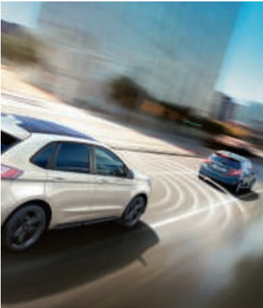
*nur i.V. mit Automatikgetriebe Bestandteil der Fahrerassistenz-Technologie Ford Co-Pilot360.

Der Stau-Assistent mit Stop & Go Funktion* sorgt für zusätzlichen Komfort. Reduziert das vorausfahrende Fahrzeug seine Geschwindigkeit bis zum Stillstand, bremst der neue Ford Edge selbstständig ab und fährt wieder an, sobald sich das vorausfahrende Fahrzeug in Bewegung setzt (Wunschausstattung).