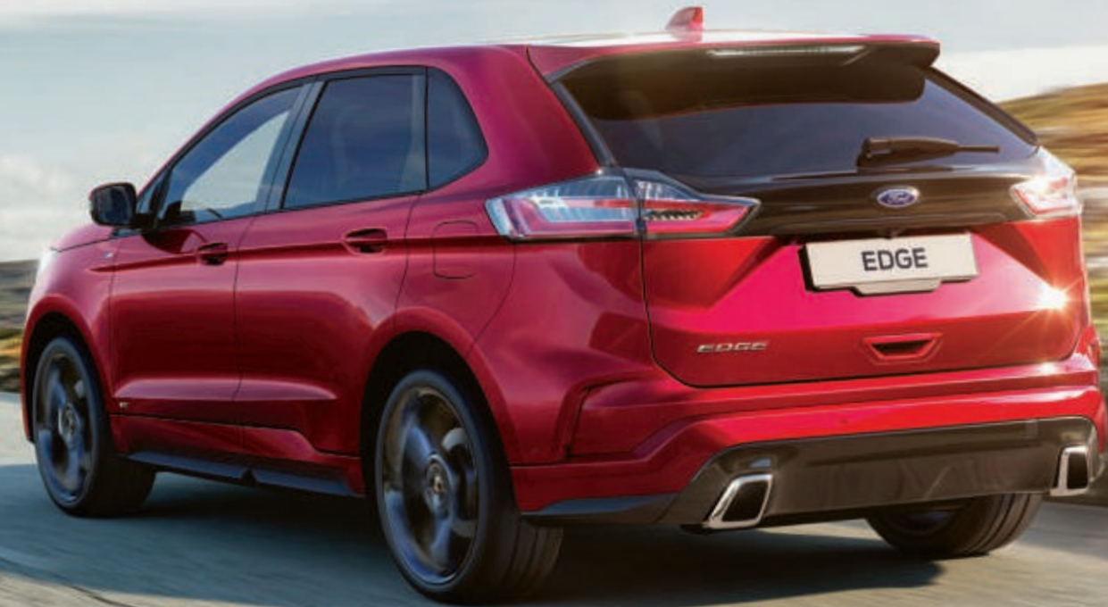
Abb. zeigt einen Ford Edge ST-Line in Ruby-Rot Metallic mit 21"-Leichtmetallrädern im 5x2-Speichen-Design, schwarz (Wunschausstattung).

Seine beeindruckende Kombination aus hochwertigem Design, großzügigem Platzangebot, wegweisenden Technologien und innovativen Konnektivitätslösungen lässt jede Fahrt zu etwas Besonderem werden.