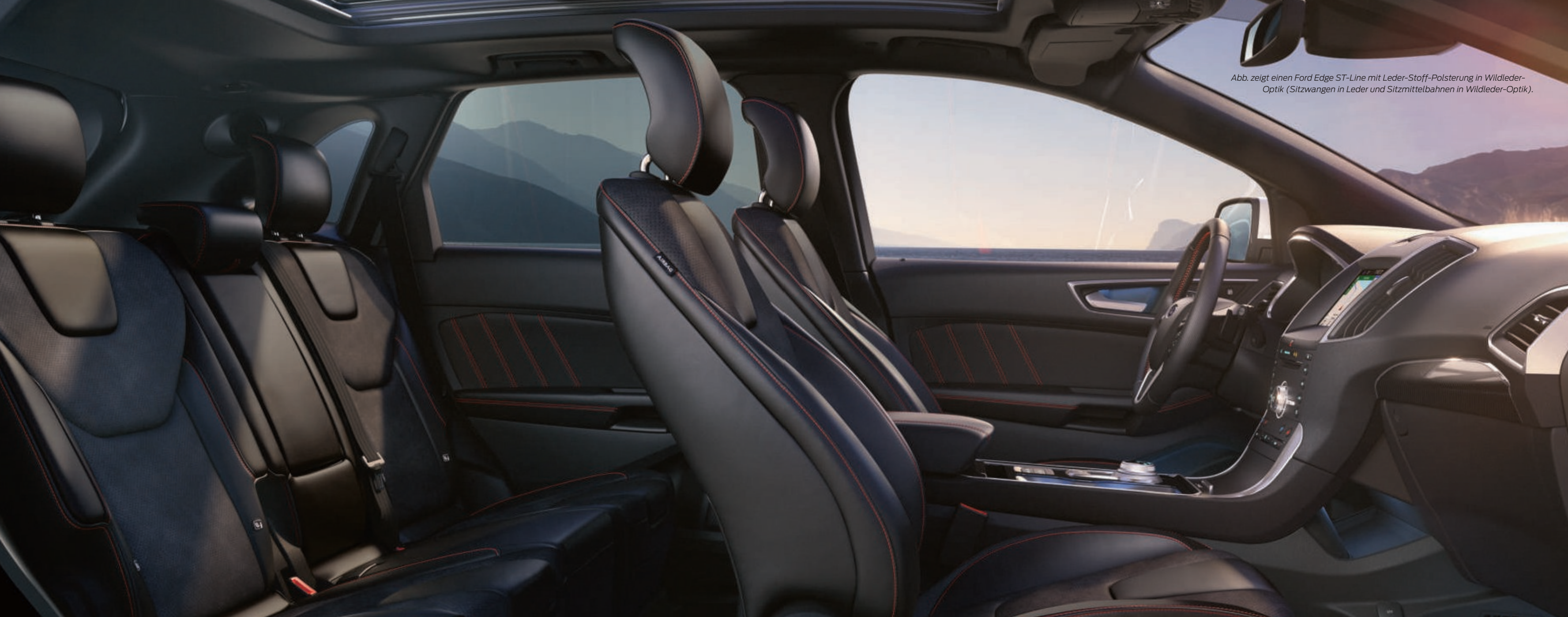
Abb. zeigt einen Ford Edge ST-Line mit Leder-Stoff-Polsterung in Wildleder-Optik (Sitzwangen in Leder und Sitzmittelbahnen in Wildleder-Optik).