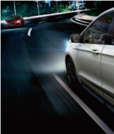
Bestandteil der Fahrerassistenz-Technologie Ford Co-Pilot360.

Der Fernlicht-Assistent wechselt automatisch von Fern- zu Abblendlicht, sobald vorausfahrender oder entgegenkommender Verkehr oder eine ausreichende Straßenbeleuchtung erkannt wird. Wenn die Fahrbahn wieder frei ist, schaltet das System automatisch wieder auf Fernlicht um (Serienausstattung).