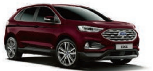
Kirsch-Rot spezielle Metallic-Lackierung*