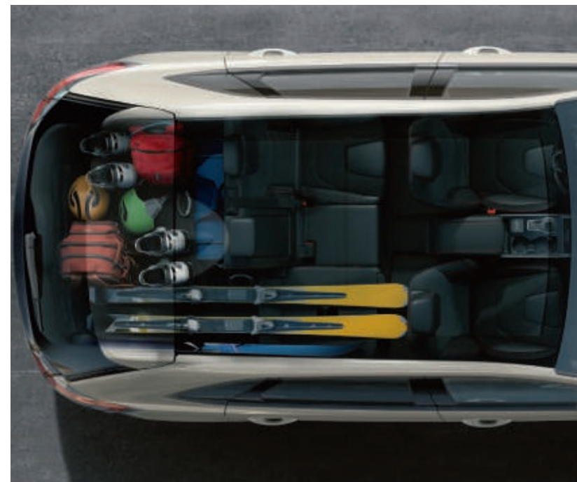
Abb. zeigt einen Ford Edge ST-Line in Arktis-Weiß Metallic (Wunschausstattung).

Gleichgültig, wie groß Ihre Träume sind – der neue Ford Edge passt sich ihnen flexibel an. Der hochwertig verarbeitete Innenraum bietet reichlich Platz für bis zu fünf Insassen mit Gepäck. Eine Fülle an Premium-Ausstattungsmerkmalen wie klimatisierte Vordersitze, ein beheizbares Lenkrad sowie ein auf Wunsch erhältliches Panoramadach unterstreichen das luxuriöse Ambiente. Wohin auch immer die Reise geht – im neuen Ford Edge können Sie sie in Komfort und Eleganz genießen.