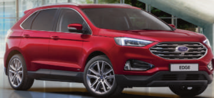
Edge Titanium in Ruby-Rot Metallic mit 20"-Leichtmetallrädern im 5x2-Speichen-Design (Wunschausstattung).