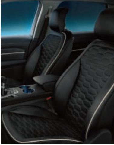
Exklusive Lederpolsterung, wabenförmig abgesteppt** in Anthrazit (Serienausstattung bei Vignale)