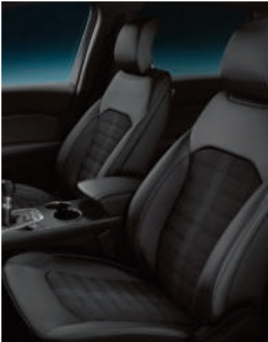
Stoffpolsterung in Anthrazit (Serienausstattung bei Trend)

Im neuen Ford Edge sind Eleganz und Handwerkskunst auf wunderbare Weise vereint. Gleichgültig, ob Sie auf dem Fahrersitz Platz nehmen oder als Fahrgast die Reise genießen: Aussehen und Haptik der Premium-Materialien setzen den großzügig dimensionierten Innenraum perfekt in Szene und spiegeln eine Wertigkeit wider, die ihresgleichen sucht.