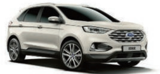
Arktis-Weiß spezielle Metallic-Lackierung*