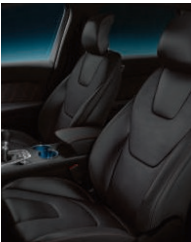
Leder-Stoff-Polsterung, in Wildleder-Optik* in Anthrazit (Serienausstattung bei ST-Line)