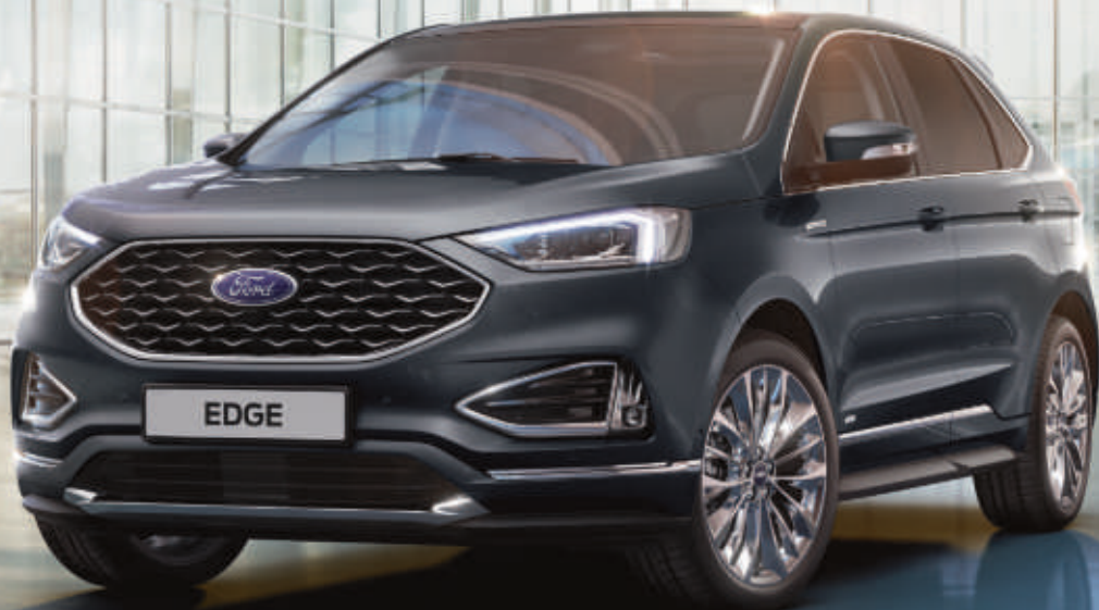
Edge Vignale in Magnetic-Grau Metallic mit 20"-Leichtmetallrädern im 15-Speichen-Design, poliert (Wunschausstattung).