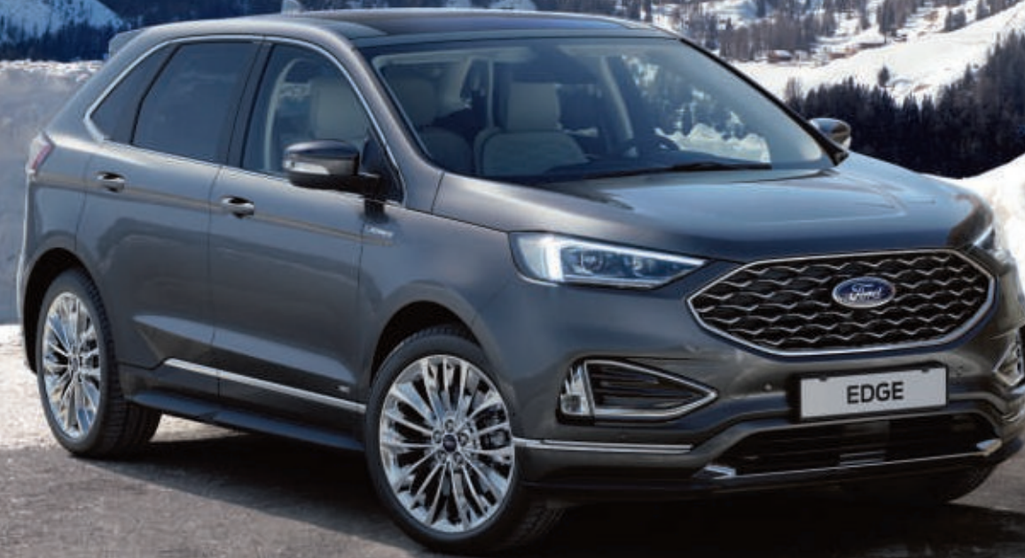
Abb. zeigt einen Ford Edge Vignale in Magnetic-Grau Metallic mit 20"-Leichtmetallrädern im 15-Speichen-Design, poliert (Wunschausstattung).

Lernen Sie mit dem neuen Ford Edge Vignale eine völlig neue Art von Ford kennen. Er verkörpert luxuriöses Design, höchste Handwerkskunst und viel Liebe zum Detail. Mit seinen einzigartigen, charakteristischen Designelementen und dem gleichermaßen edlen wie durchdachten Innenraum setzt der Edge Vignale neue Maßstäbe. Als Besitzer eines exklusiven Ford Vignale profitieren Sie außerdem von einer breiten Palette an Serviceleistungen und Vorteilen, die exakt auf Ihre individuellen Anforderungen zugeschnitten werden.