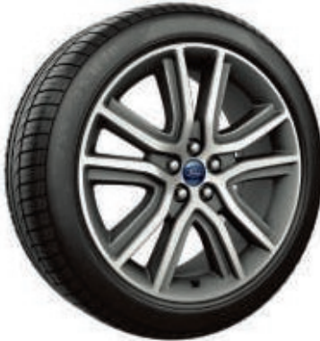
20" Leichtmetallräder im 5x2-Speichen-Design (Wunschausstattung bei Titanium)