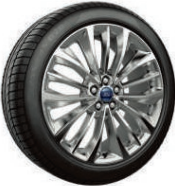
20" Leichtmetallräder im 15-Speichen-Design, poliert (Serienausstattung bei Vignale)