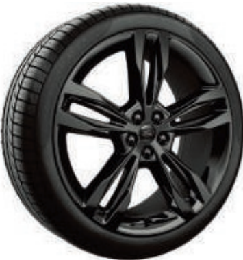
21" Leichtmetallräder im 5x2-Speichen-Design, Schwarz (Wunschausstattung bei ST-Line)