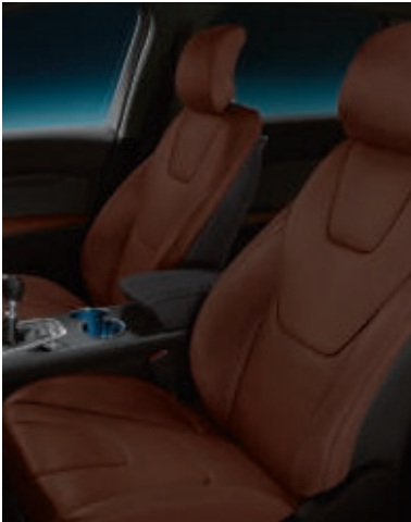
Lederpolsterung, perforiert*** in Braun (Wunschausstattung bei Titanium)