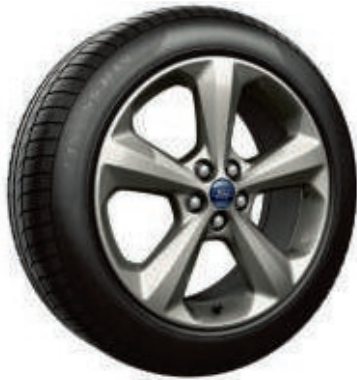
19" Leichtmetallräder im 5-Speichen-Design (Serienausstattung bei Trend)

*Metallic- und Premium-Karosseriefarbe Wunschausstattung gegen Aufpreis.