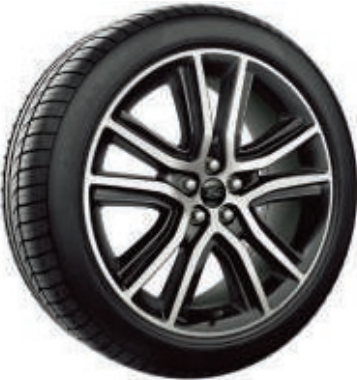
20" Leichtmetallräder im 5x2-Speichen-Design, Anthrazit (Serienausstattung bei ST-Line)