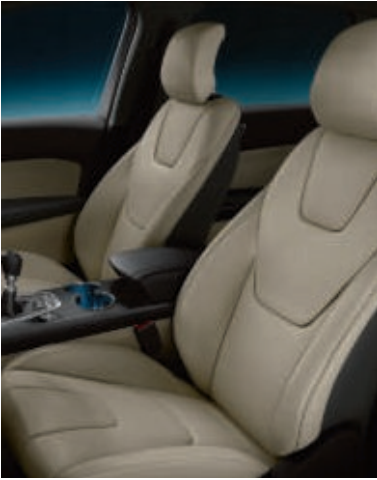
Lederpolsterung, perforiert*** in Hellbeige (Wunschausstattung bei Titanium)