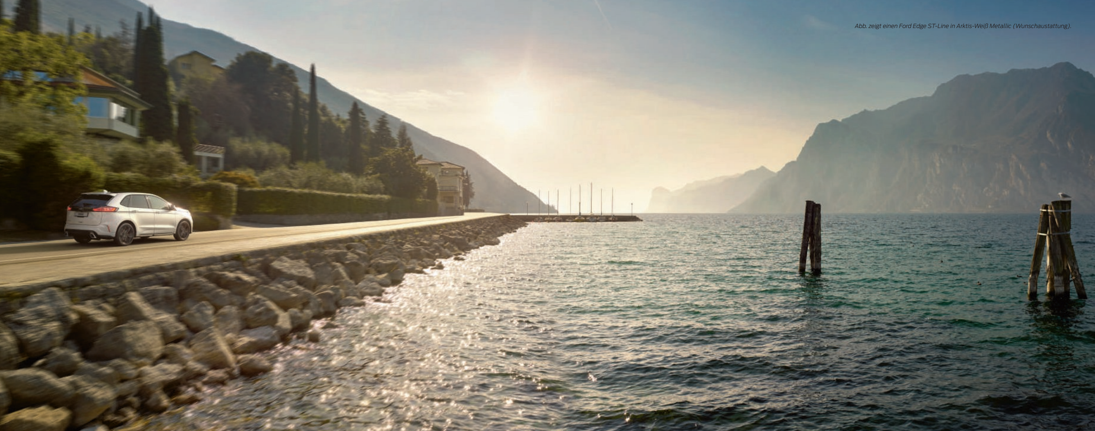
Abb. zeigt einen Ford Edge ST-Line in Arktis-Weiß Metallic (Wunschausstattung).