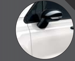
296_GELATO WEIß Uni-Lackierung 0€**