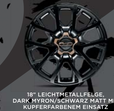
18" LECHTMETALLFELGE, DARK MYRON/SCHWARZ MATT MIT KUPFERFARBENEM EINSATZ