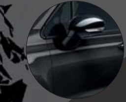
601_CINEMA SCHWARZ Uni-Sonderlackierung 450€**