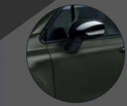
149_ALPI GRÜN Matt-Lackierung 990€**