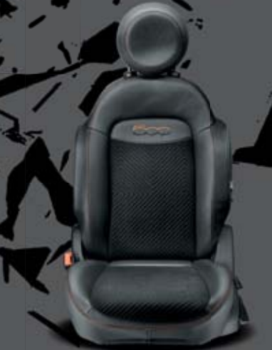
SCHWARZER CASTIGLIO-STOFF MIT CHEVRON-MUSTER, KOMBINIERT MIT SCHWARZEN SEITENTEILEN AUS HOCHWERTIGER LEDERNACHBILDUNG, KUPFERFARBENEM 500-LOGO UND KONTRASTNÄHTEN