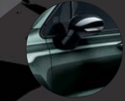
019_TECHNO GRÜN Metallic-Lackierung 590€**