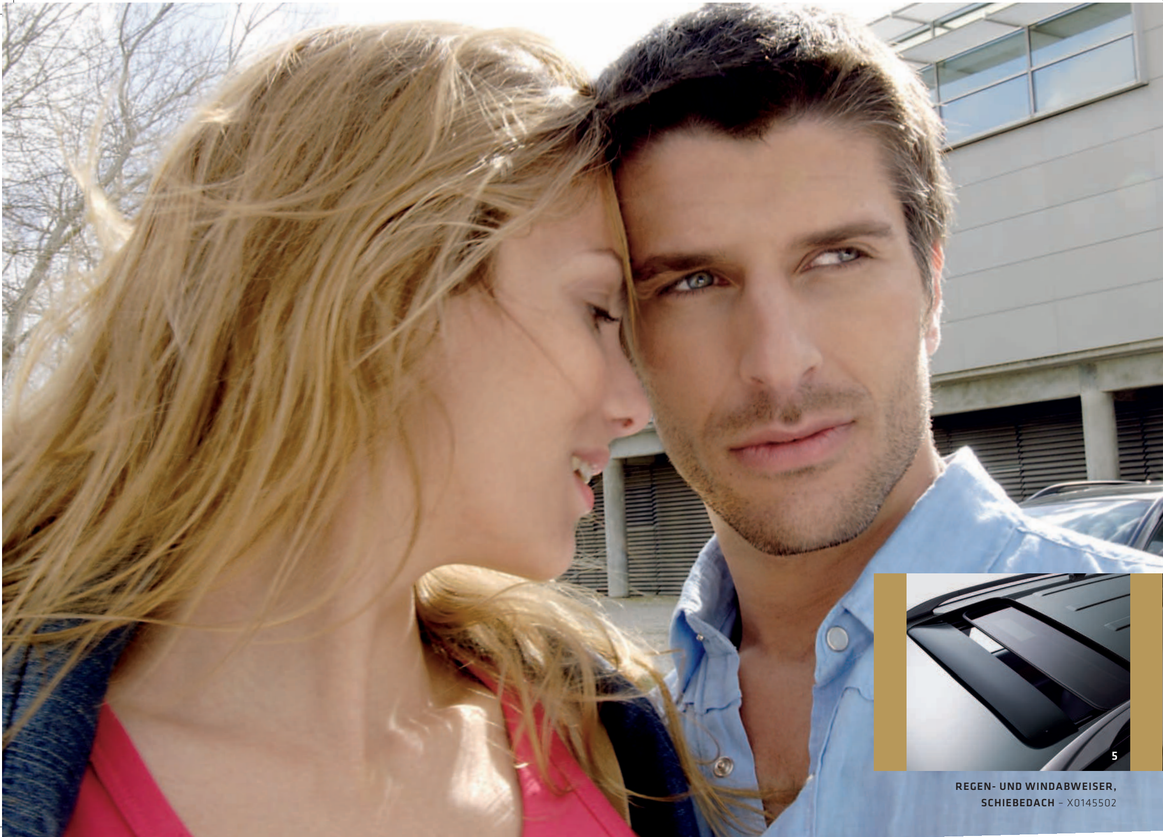
REGEN- UND WINDABWEISER, SCHIEBEDACH - X0145502