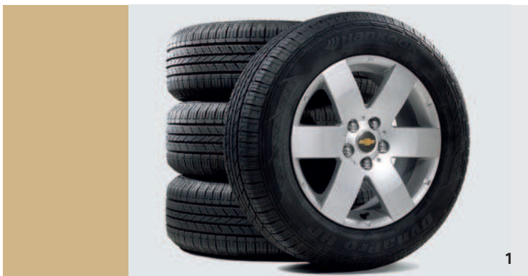
SOMMER- UND WINTERKOMPLETTRÄDER*