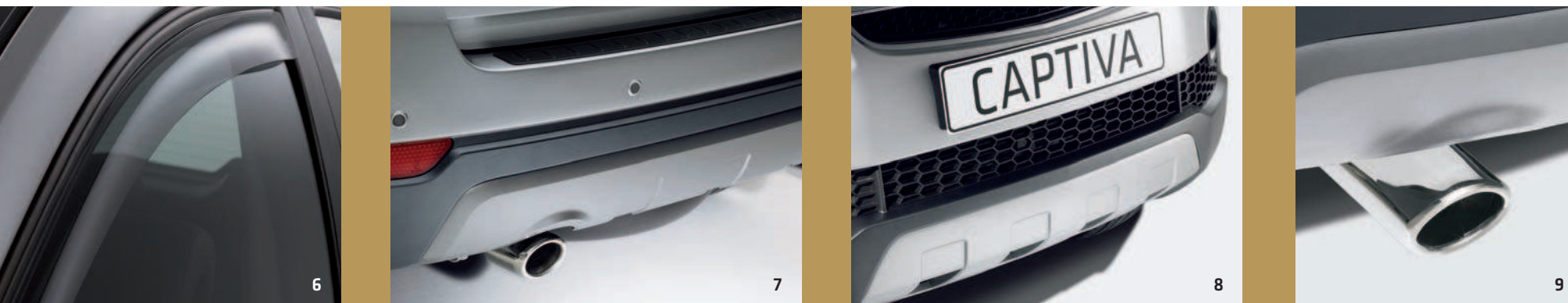
REGEN- UND WINDABWEISER X0470025

*Kappen und Muttern: Den Lieferumfang für Kappen und Muttern entnehmen Sie bitte der Preisliste.