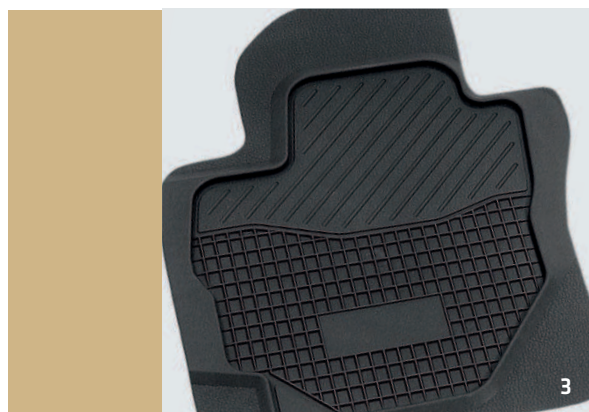
GUMMI PASSFORMMATTEN - ZZ03151

* Bitte entnehmen Sie weitere Angaben der Preisliste.