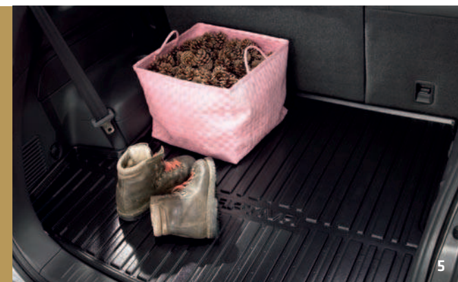
FORMSCHALE FÜR LADERAUM - 93743892