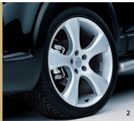
IRMSCHER LEICHTMETALLRAD 20"*