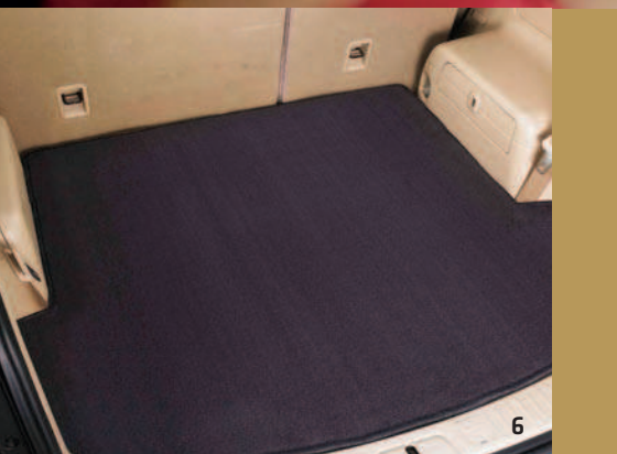
ANTIRUTSCHMATTE LADERAUM 93743888