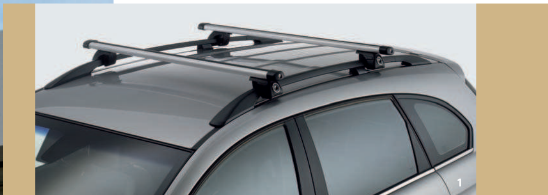
DACHTRÄGER/BASISELEMENT – 93743719

1. DACHTRÄGER/BASISELEMENT: Diese leicht zu montierenden Träger aus Aluminium (Profile mit T-Nut und einsetzbaren Modulen) sind die perfekte Basis für eine Vielzahl von Befestigungslösungen. Abschließbar und diebstahlsicher. Maximales Gewicht: 100 kg. 2. THULE FAHRRADTRÄGER*: Nehmen Sie Ihr Fahrrad mit diesem einfach zu handhabenden und abschließbaren Trägersystem überallhin mit. In Metall und Leichtmetall verfügbar. 3. ANHÄNGERKUPPLUNG*: Speziell für den Captiva entwickelt. Für einen absolut zuverlässigen und sicheren Anhängerbetrieb. Fest montiert oder abnehmbar erhältlich.