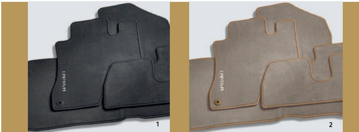
AUTOTEPPICH VELOURS, CHARCOAL*