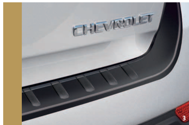
LADEKANTENSCHUTZ – X04600122

*Bitte entnehmen Sie weitere Angaben der Preisliste.