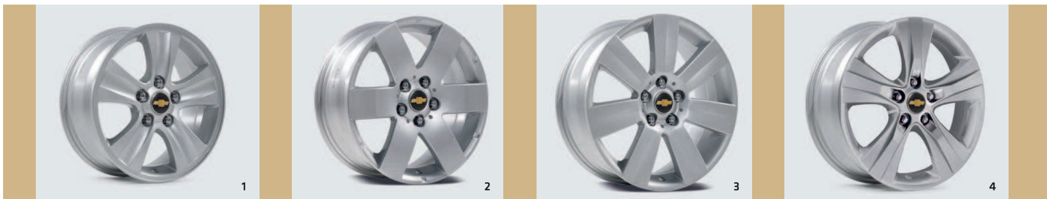
LEICHTMETALLRAD 16" – 96626213*