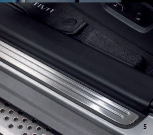
EINSTIEGSLEISTEN AUS ALUMINIUM*