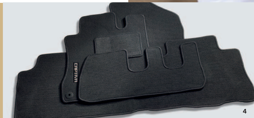
AUTOTEPPICH, GERIPPT - X0079071