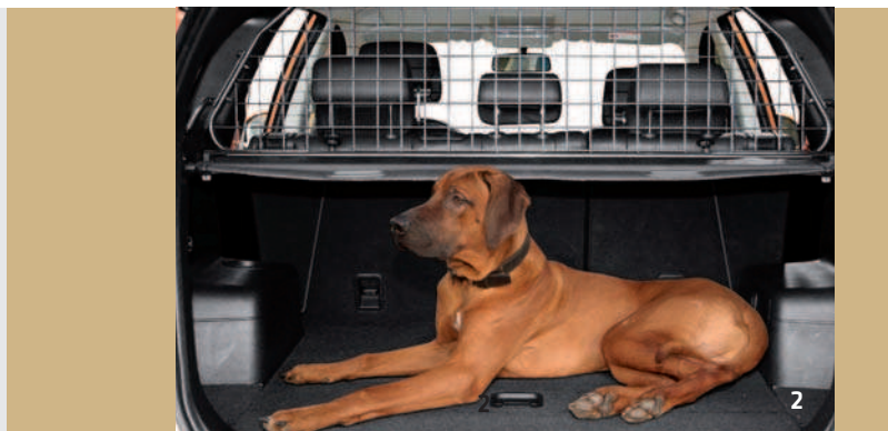
HUNDEGITTER – X0460017

1. SOMMER- UND WINTERKOMPLETTRÄDER*: Suchen Sie ansprechende Räder für Ihren Captiva? Oder suchen Sie die für das Wetter geeignete Bereifung? Ihr Chevrolet Händler hat immer ein breites Sortiment an Stahl- und Leichtmetallrädern. Dort erfahren Sie auch weitere Details, damit Sie das Richtige finden. 2. HUNDEGITTER: Das besonders stabile Hundegitter aus Metall ist perfekt auf die Maße Ihres Captiva abgestimmt und garantiert maximale Sicherheit. 3. LADEKANTENSCHUTZ: Der besonders widerstandsfähige Ladekantenschutz aus Hartplastik schützt die Oberfläche des Stoßfängers und verhindert Kratzer. 4. SCHMUTZFÄNGER*: Schützt Ihr Fahrzeug vor praktisch allem, was von der Straße aufgewirbelt werden kann. 5. PARKPILOT: Eine optimale Hilfe für manchmal sehr verzwickte Einparkmanöver.