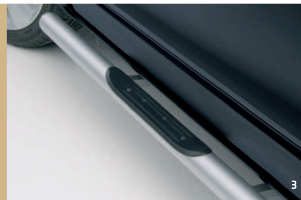
IRMSCHER TRITTBRETTER, ALUMINIUM-LOOK*