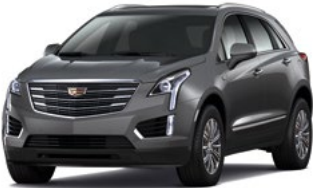
Dark Granite Metallic