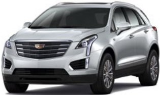
Radiant Silver Metallic