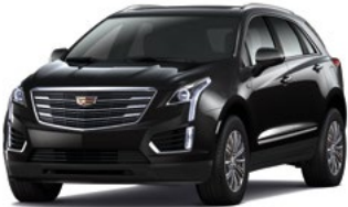
Stellar Black Metallic