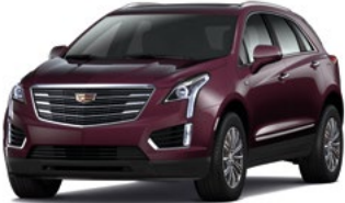
Deep Amethyst Metallic