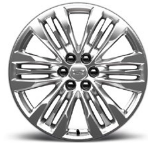
Aluminiumfelgen, 20 Zoll, mit Premium-Lackierung in Sterling Silver