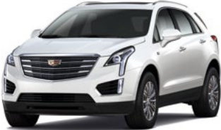
Crystal White Tricoat