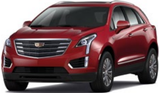
Red Passion Tintcoat