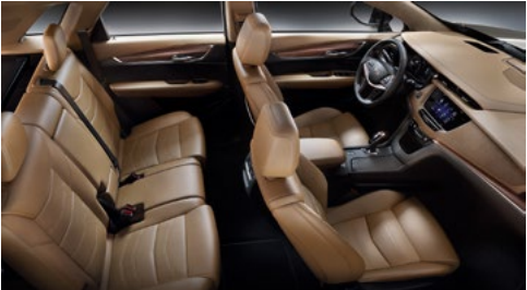
Semianilin-Opusledersitze in Maple Sugar mit chevron-perforierten Einsätzen, Jet-Black-Akzente am Armaturenbrett, Mikrofaser-Veloursleder-Dachhimmel und satinierte Holzausstattung mit Palisander