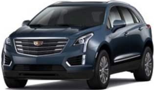
Harbor Blue Metallic