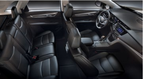
Mulan-Ledersitzflächen in Jet-Black mit perforierten Einsätzen, Jet-Black-Akzente am Armaturenbrett und Ausstattung mit Lunar-gebürstetem Aluminium