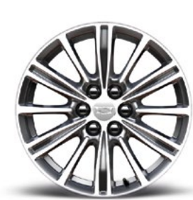
Helle Aluminiumfelgen 18 Zoll, geschliffen, mit Light-Argent-Akzenten