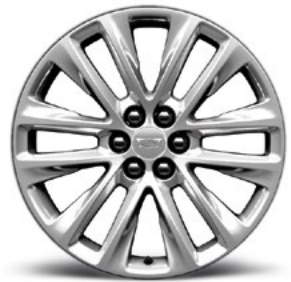
12-Speichen-Aluminiumfelgen, 20 Zoll, poliert