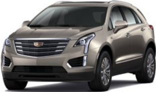
Bronze Dune Metallic