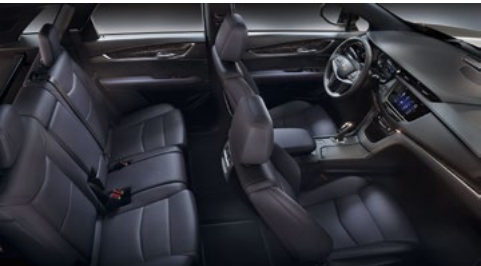
Mulan-Ledersitze in Carbon Plum mit perforierten Einsätzen, Jet-Black-Akzente am Armaturenbrett und Holzausstattung mit dunkler, gemaseter Oliv-Esche