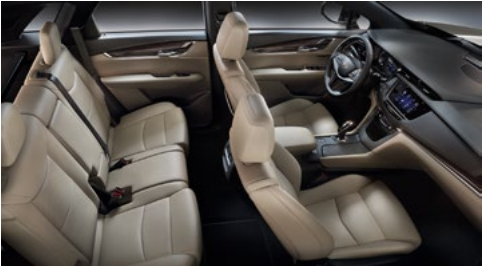
Mulan-Ledersitzflächen in Sahara-Beige mit perforierten Einsätzen, Jet-Black-Akzente am Armaturenbrett und Holzausstattung mit Sapelli-Mahagoni, Hochglanz natur