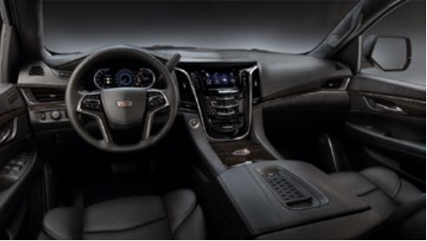
Semianilin-Opusledersitze in Jet Black, Holzausstattung mit Japanische Schwarzesche in Sumi Black und Mikrofaser-Veloursleder-Dachhimmel