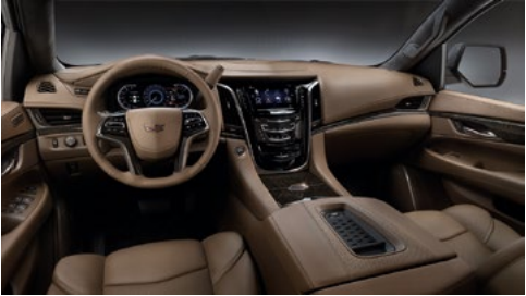
Semianilin-Opusledersitze in Maple Sugar, Holzausstattung mit Japanische Schwarzesche in Sumi Black und Mikrofaser-Veloursleder-Dachhimmel