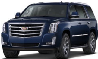
Dark Adriatic Blue Metallic