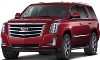
Red Passion Tintcoat