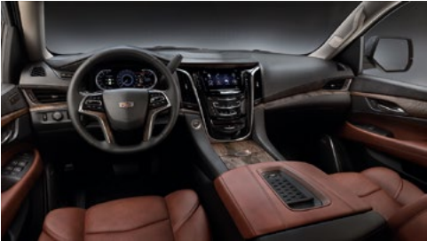
Semianilin-Opusledersitze in Kona Brown mit Mikrofaser-Veloursledereinsätzen an den Rückenlehnen, Mikrofaser-Akzente in Jet Black und Velours am Armaturenbrett und Holzausstattung mit Sapelli-Mahagoni natur