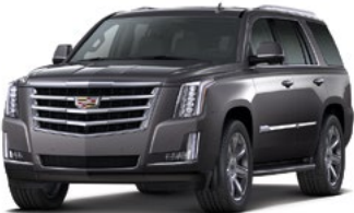
Dark Granite Metallic