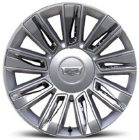
Felgen mit Premium-Lackierung und Chrom-Einsätzen, 22 Zoll