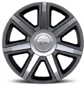
7-Speichen-Felgen, 22 Zoll, mit Premium-Lackierung und Chrom-Einsätzen