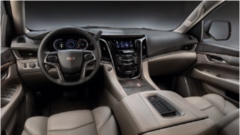
Mulan-Ledersitzflächen in Shale, Jet Black-Akzente am Armaturenbrett und Holzausstattung in Black Marble Burl