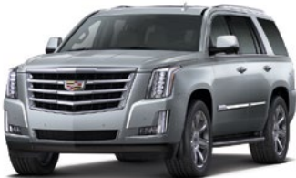
Satin Steel Metallic