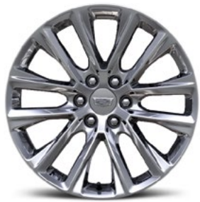
Ultrahelle Aluminiumfelgen, 22 Zoll, geschliffen, mit Premium-Lackierung