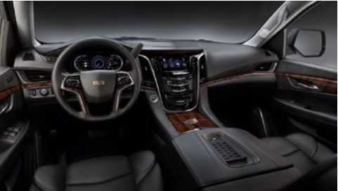
Mulan-Ledersitzflächen in Jet Black, Jet-Black-Akzente am Armaturenbrett und Holzausstattung mit Santos Palisander