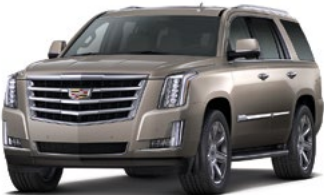
Bronze Dune Metallic