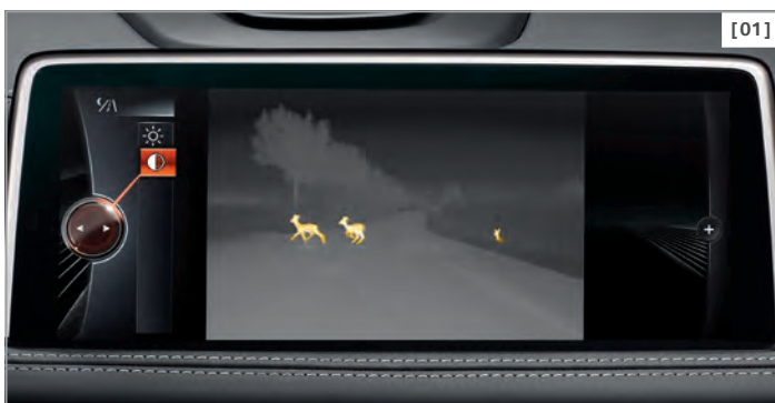
[01] BMW Night Vision mit Personenerkennung und Dynamic Light Spot