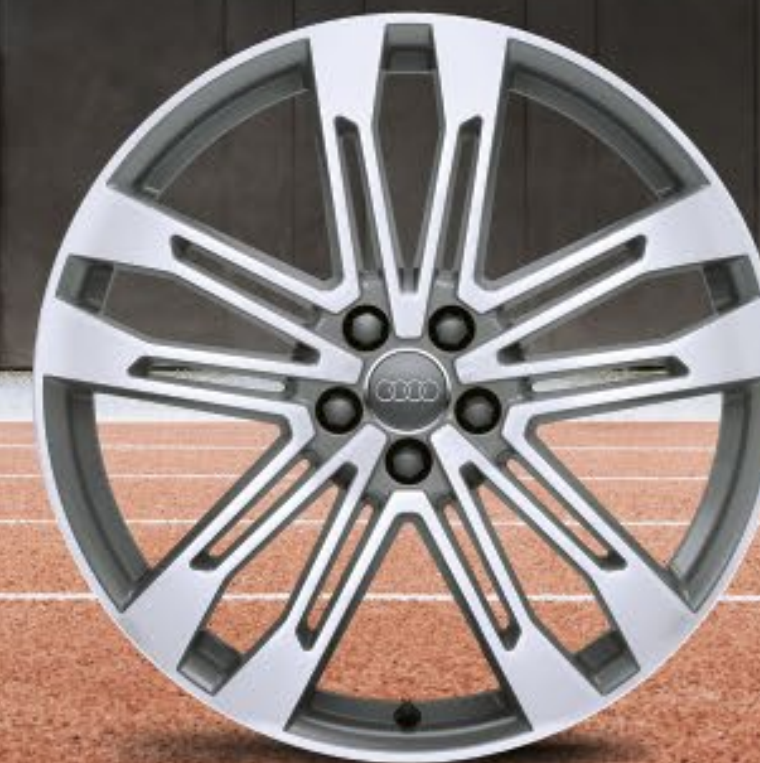
21"-Aluminium-Gussräder im 5-Doppelspeichen-V-Design (S-Design), kontrastgrau, teilpoliert 1, 2

Die Werte für Kraftstoffverbrauch und CO 2 -Emissionen sowie die Effizienzklassen finden Sie auf Seite 34. Bei den gezeigten bzw. beschriebenen Ausstattungen handelt es sich teilweise um Sonderausstattungen gegen Mehrpreis. Detaillierte Angaben zu Serien- und Sonderausstattungen erhalten Sie unter www.audi.de oder bei Ihrem Audi Partner. 1 Bitte beachten Sie die Besonderheiten zu den Rädern auf Seite 35. 2 Ein Angebot der Audi Sport GmbH.