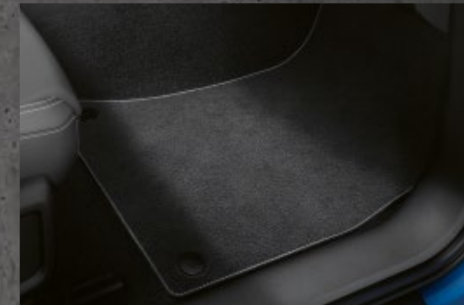
Fußmatte Audi exclusive mit Keder in Jetgrau und Kontrastnaht in Alabasterweiß