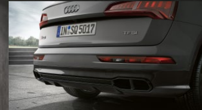
Stoßfängerunterteil hinten in Kontrastfarbe Manhattangrau mit Leiste in Titanschwarz

Die Werte für Kraftstoffverbrauch und CO 2 -Emissionen sowie die Effizienzklassen finden Sie auf Seite 34.