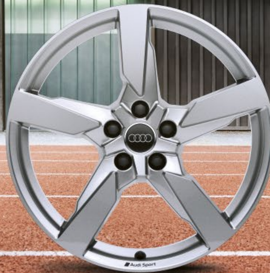
21"-Aluminium-Gussräder Audi Sport im 5-Arm-Polygon-Design 2