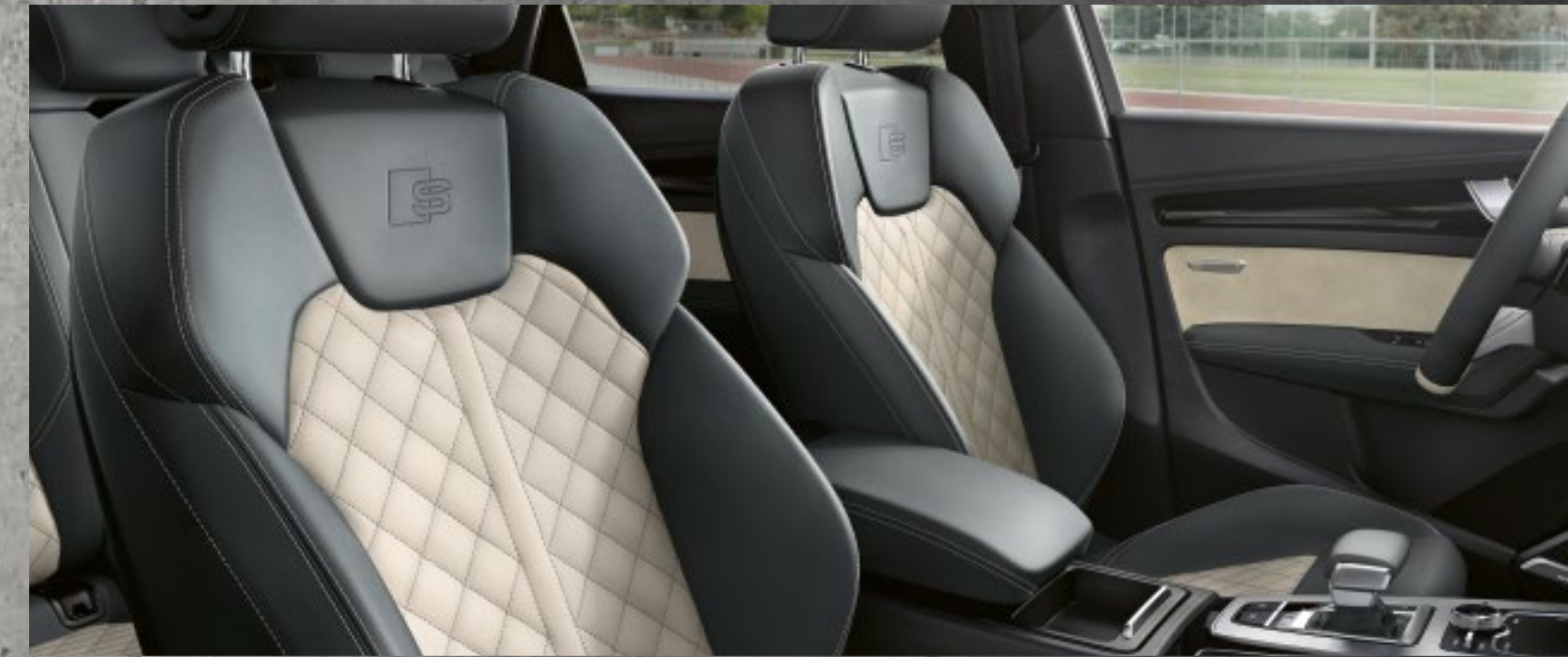
Lederausstattung Leder Feinnappa Audi exclusive mit Sportsitzen vorn in Jetgrau/Alabasterweiß und Kontrastnähten in Alabasterweiß – Dekoreinlagen Klavierlack schwarz Audi exclusive

Audi exclusive ist ein Angebot der Audi Sport GmbH. Bei den gezeigten bzw. beschriebenen Ausstattungen handelt es sich teilweise um Sonderausstattungen gegen Mehrpreis. Detaillierte Angaben zu Serien- und Sonderausstattungen erhalten Sie unter www.audi.de oder bei Ihrem Audi Partner. 1 Bitte beachten Sie die Besonderheiten zu den Rädern auf Seite 35. 2 Ein Angebot der Audi Sport GmbH.