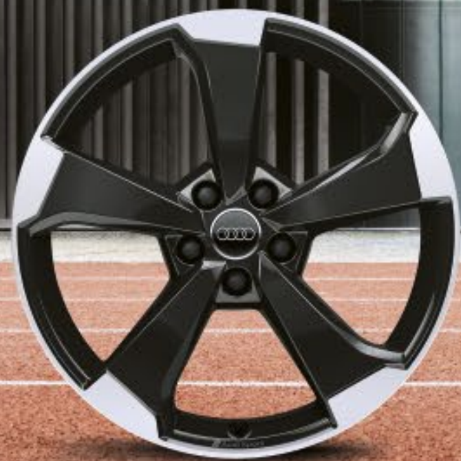
20"-Aluminium-Gussräder Audi Sport im 5-Arm-Rotor-Design, anthrazitschwarz glänzend, glanzgedreht 1, 2

Mit Audi Rädern unterstreichen Sie Ihren individuellen Stil und den Charakter Ihres Audi SQ5. Gönnen Sie sich einen besonderen Auftritt mit Ihrem Lieblingsdesign. Für das gute Gefühl unterwegs: Audi Räder durchlaufen spezifische Testverfahren, sind besonders geprüft und von maximaler Qualität.