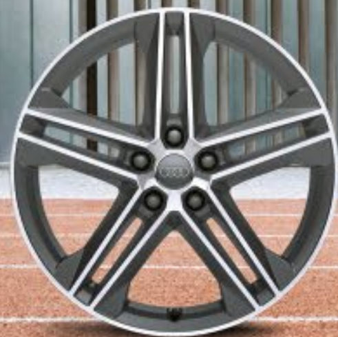
20"-Aluminium-Gussräder im 5-Doppelspeichen-Stern-Design (S-Design), kontrastgrau, teilpoliert 1