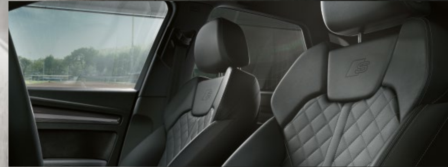
Sportsitze in Leder Feinnappa mit Rautensteppung schwarz mit Kontrastnähten in Felsgrau und S-Prägung

Audi SQ5 Black – u. a. Lackierung in Quantumgrau mit exklusiver Kontrastlackierung in Manhattangrau – Umfänge aus dem Optikpaket titanschwarz Audi exclusive 2 – Privacy-Verglasung mit Akustikverglasung für die vorderen Türen