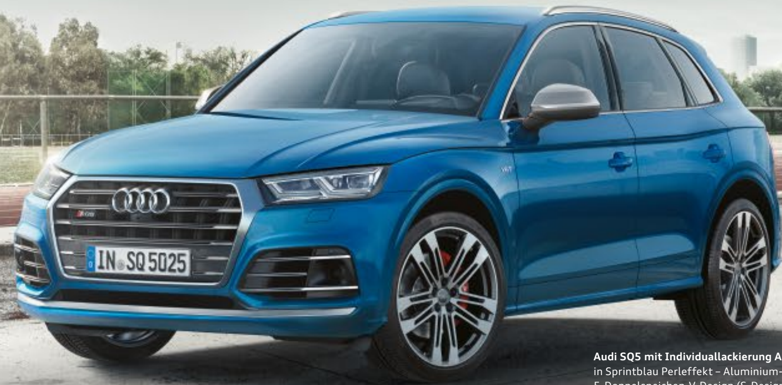
Audi SQ5 mit Individuallackierung Audi exclusive in Sprintblau Perleffekt – Aluminium-Gussräder im 5-Doppelspeichen-V-Design (S-Design), kontrastgrau, teilpoliert 1, 2

Machen Sie aus Ihrem Audi SQ5 ein Unikat – so unverwechselbar wie Sie selbst – durch Audi exclusive. Mit ausgewählten Dekoren, farbigem Leder und individueller Lackierung aus einem großen Farbangebot betonen Sie die Sportlichkeit Ihres Audi SQ5 so, wie Sie es wünschen.