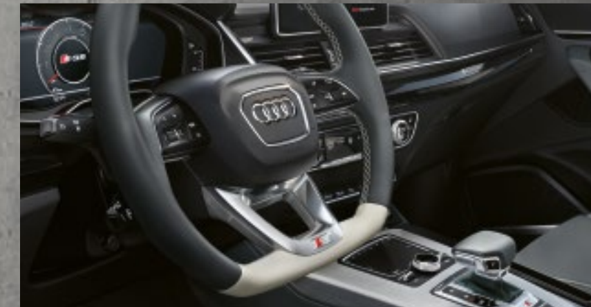
Bedienelemente Leder Audi exclusive in Jetgrau/Alabasterweiß mit Kontrastnähten in Alabasterweiß und Audi exclusive-spezifischem Nahtbild