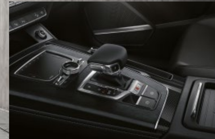
Dekoreinlagen in Carbon Atlas