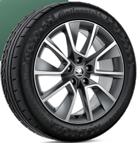
18"-LEICHTMETALLFELGEN BRAGA Der KAROQ SCOUT ist serienmäßig mit den 18"-Leichtmetallfelgen Braga in Anthrazit ausgestattet, die sein robustes Auftreten elegant abrunden.