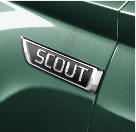
SCOUT-SCHRIFTZUG Ein SCOUT-Emblem ziert die vorderen Kotflügel.