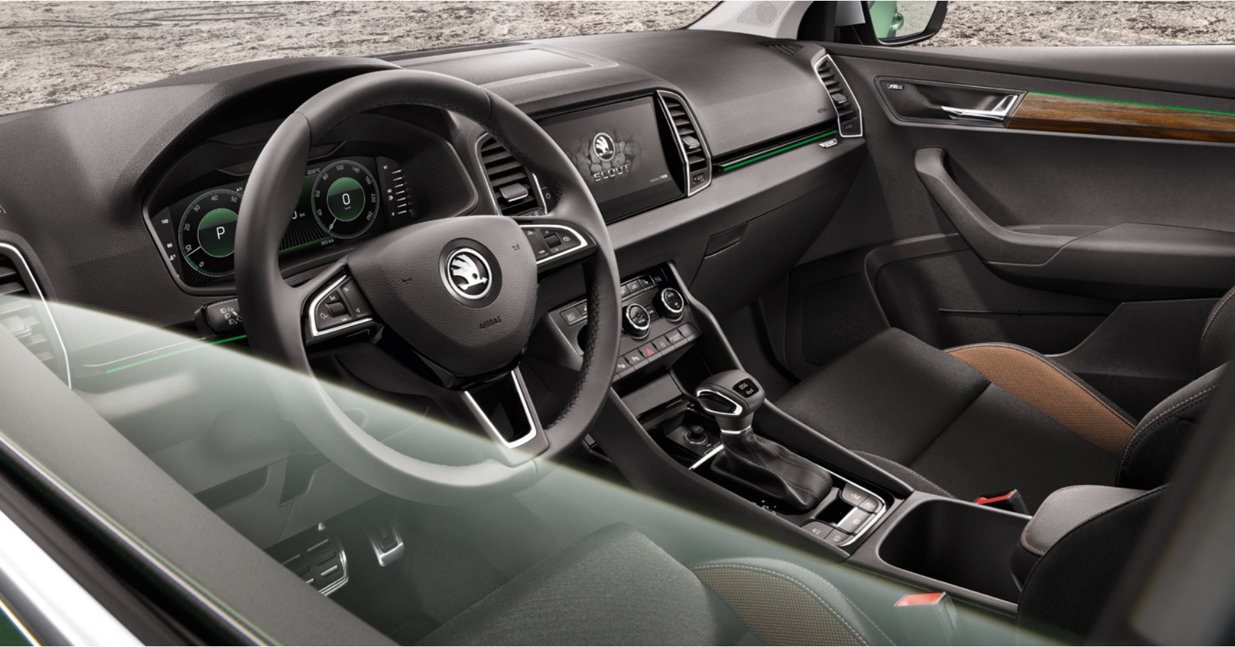
LOGO Das SCOUT-Logo finden Sie auch auf der Armaturentafel.

Im KAROQ SCOUT erwartet Sie eine Vielzahl von Ausstattungs-Highlights. Das Lederlenkrad mit Multifunktionstasten sorgt für noch mehr Fahrspaß und die LED-Ambientebeleuchtung mit zehn attraktiven Farboptionen schafft die richtige Stimmung für jede Reise. Als Sonderausstattung sind zudem das virtuelle Cockpit und das Navigationssystem Columbus erhältlich, das sich dank 9,2"-Touchscreen komfortabel mittels Tippen und Gesten steuern lässt.