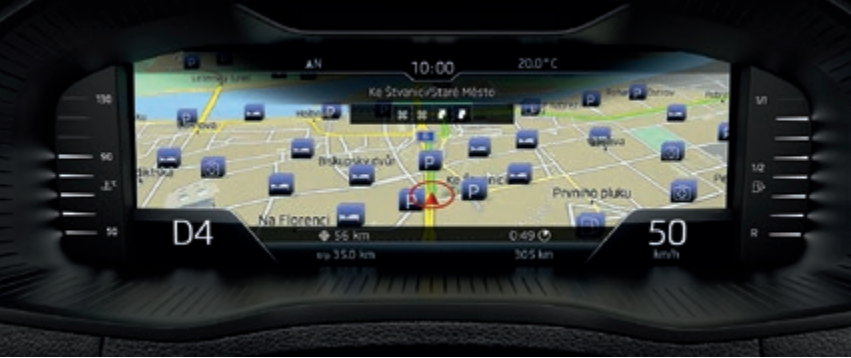
Digitalansicht mit vergrößerter Darstellung

*Voraussichtlich bestellbar ab Frühjahr 2018.