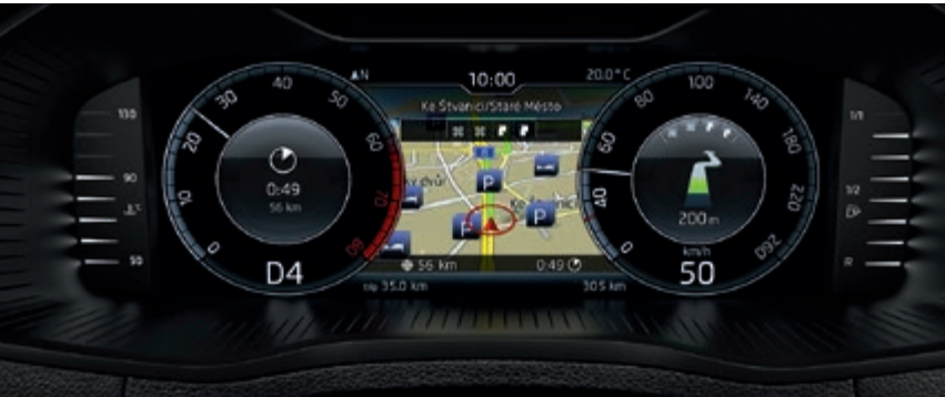
Digitale Spezialansicht mit Informationsprofil