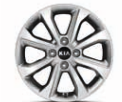
15-Zoll-Leichtmetallfelgen mit Bereifung 185/65 R15 (Serie für Edition 7)