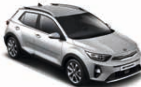
Seidensilber Metallic _ 4SS