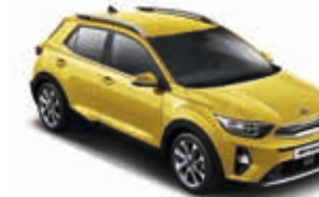
Floridagelb Metallic _ MYW