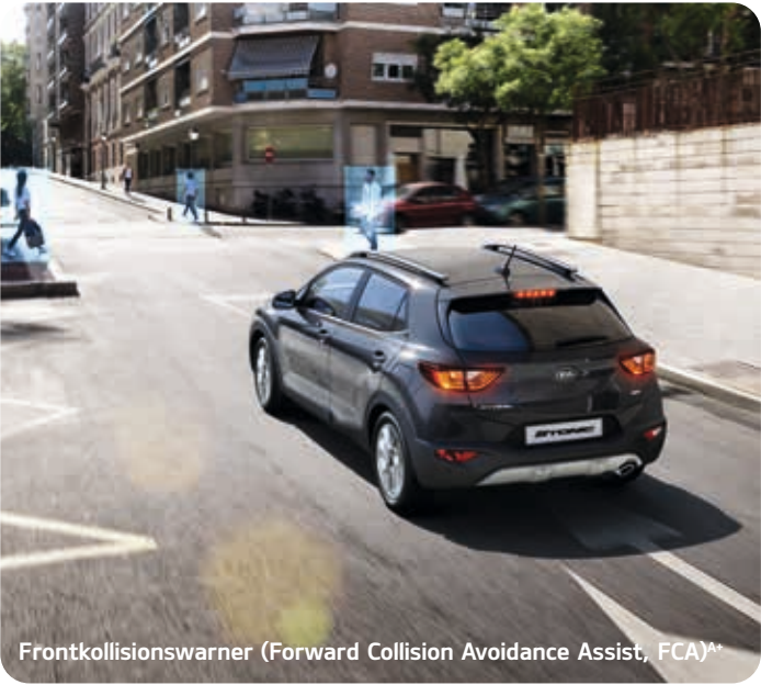
Frontkollisionswarner (Forward Collision Avoidance Assist, FCA) A*

Der Frontkollisionswarner (Forward Collision Avoidance Assist, FCA) A* erkennt Objekte auf der Fahrbahn per Kamera und Radar. Die Fußgängererkennung kann bei bis zu 60 km/h einen Passanten auf der Straße identifizieren, warnt bei Kollisionsgefahr den Fahrer und löst bei Bedarf eine Notbremsung aus.