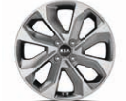
17-Zoll-Leichtmetallfelgen mit Bereifung 205/55 R17 (Serie ab Vision, nicht in Verbindung mit Benzinmotor 1.2)