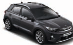
Graphite Metallic _ ABT