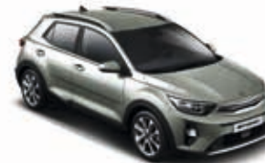
Urbangrün Metallic _ URG