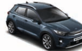
Denimblau Metallic _ EU3