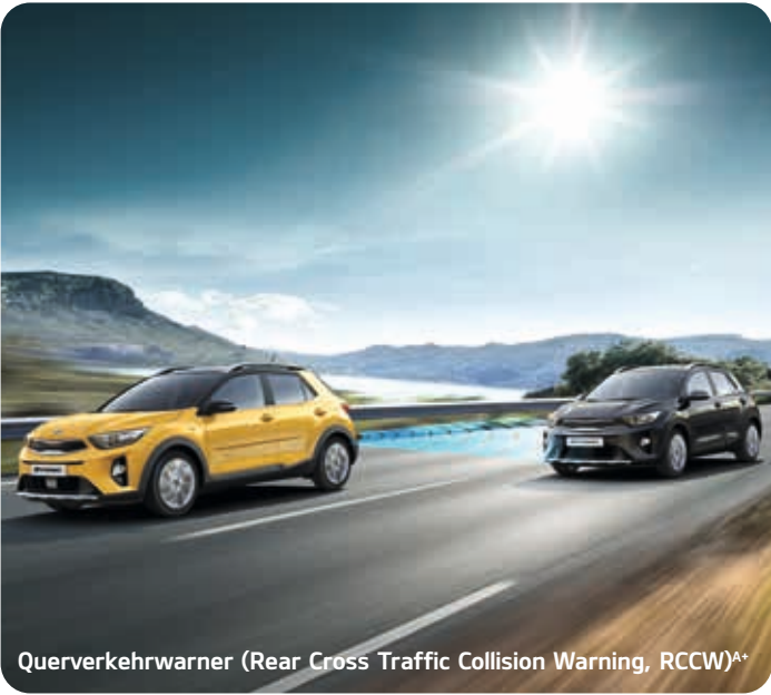
Querverkehrwarner (Rear Cross Traffic Collision Warning, RCCW) A*

Im Kia Stonic können Sie sich rundum sicher fühlen: Moderne Assistenzsysteme A bieten Ihnen Unterstützung in Gefahrensituationen.