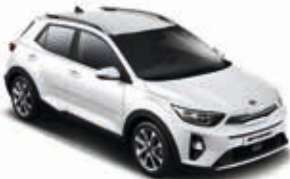
Schneeweiß _ UD

Die kraftvollen, frischen Außenfarben des Kia Stonic bringen sein Design und seine markanten Konturen optimal zur Geltung. Neben acht einfarbigen Lackierungen werden 15 verschiedene Zweifarb-Kombinationen angeboten, da das Dach in insgesamt vier Kontrastfarben erhältlich ist (je nach Ausführung und Karosseriefarbe).