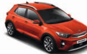
Signalrot Metallic _ BEG