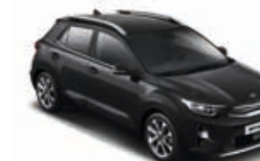
Auroraschwarz Metallic _ ABP