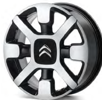
Satz Leichtmetallfelgen „Cross“

16 Zoll, Onyx-Schwarz Bestell-Nr.: 98029119XY