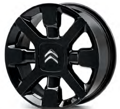
Satz Leichtmetallfelgen „Cross“

17 Zoll, Onyx-Schwarz, diamantiert Bestell-Nr.: 1612598980