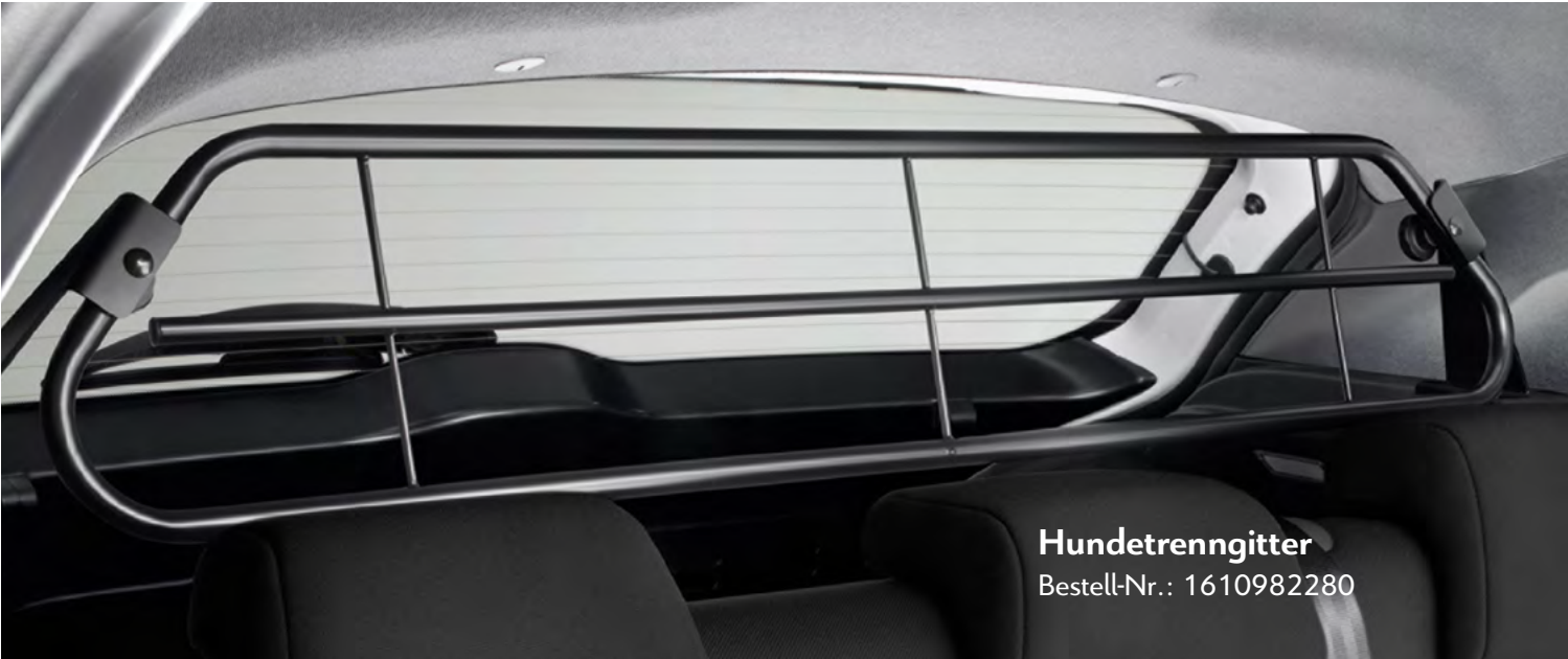
Hundetrenngitter Bestell-Nr.: 1610982280