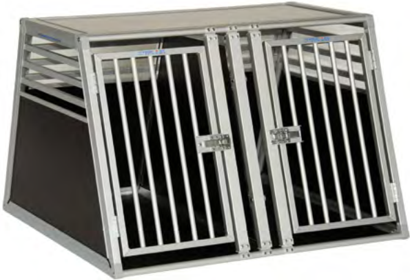
Universal-Doppel-Hundebox (Typ A) Verschiedene Maße, Abbildung ähnlich