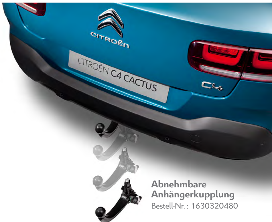
Abnehmbare Anhängerkupplung Bestell-Nr.: 1630320480