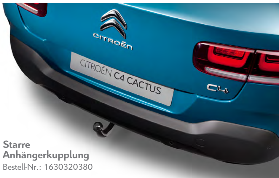
Starre Anhängerkupplung Bestell-Nr.: 1630320380