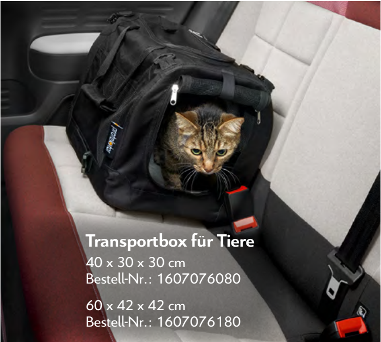
Transportbox für Tiere 40 x 30 x 30 cm Bestell-Nr.: 1607076080 60 x 42 x 42 cm Bestell-Nr.: 1607076180