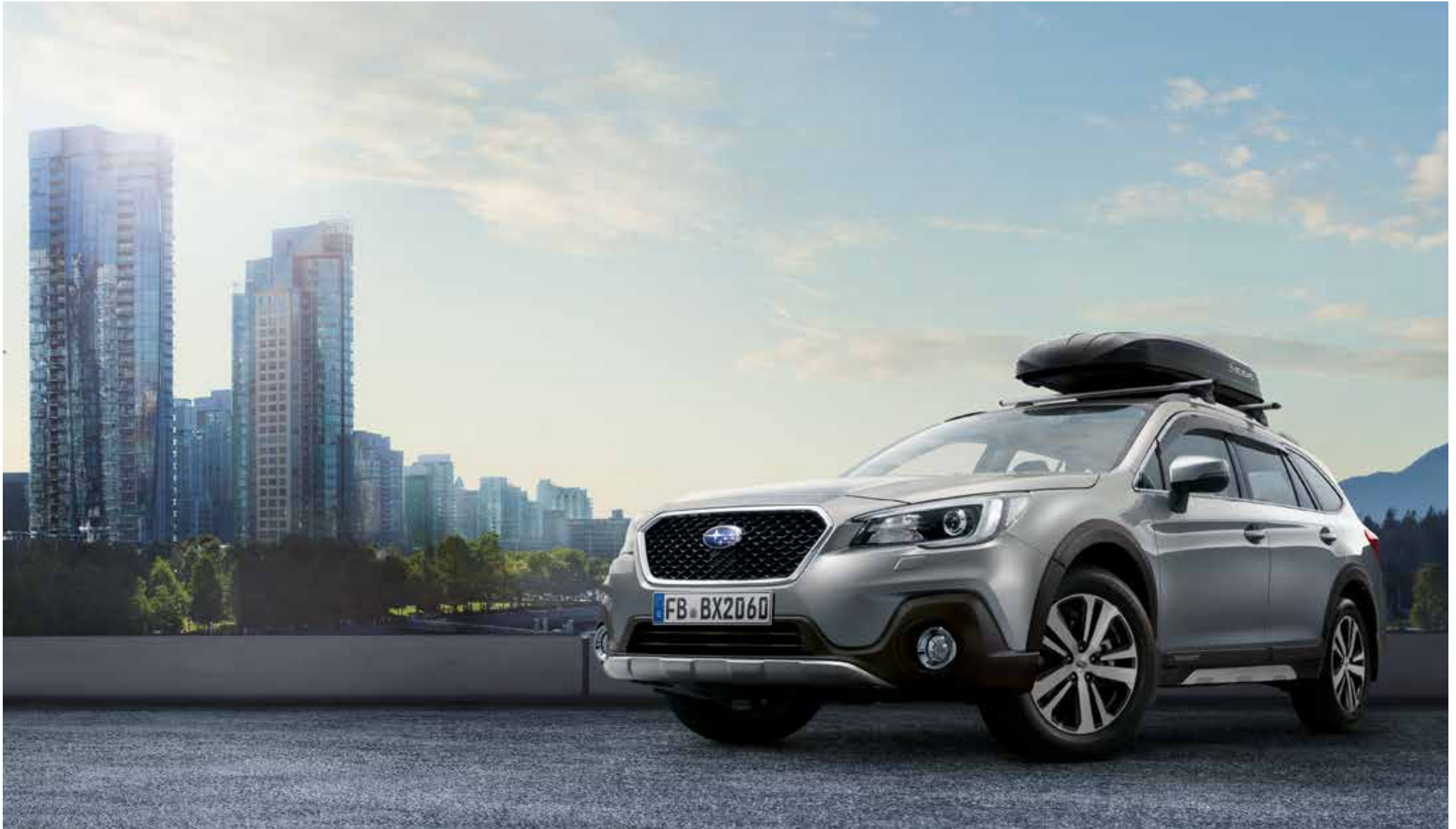
S. 9: Kunststofffrontblende Aluminiumoptik, Kunststoffseitenblendensatz Aluminiumoptik, Kotflügelverbreiterungssatz, Seitenwindabweisersatz, Gitterfrontgrill, Schmutzfängersätze vorne und hinten, Aluminium-Dachgrundträger C-Slot, Dachbox.