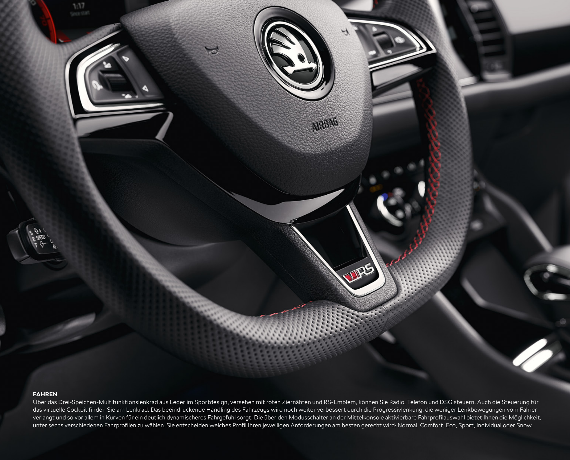
FAHREN Über das Drei-Speichen-Multifunktionslenkrad aus Leder im Sportdesign, versehen mit roten Ziernähten und RS-Emblem, können Sie Radio, Telefon und DSG steuern. Auch die Steuerung für das virtuelle Cockpit finden Sie am Lenkrad. Das beeindruckende Handling des Fahrzeugs wird noch weiter verbessert durch die Progressivlenkung, die weniger Lenkbewegungen vom Fahrer verlangt und so vor allem in Kurven für ein deutlich dynamischeres Fahrgefühl sorgt. Die über den Modusschalter an der Mittelkonsole aktivierbare Fahrprofilauswahl bietet Ihnen die Möglichkeit, unter sechs verschiedenen Fahrprofilen zu wählen. Sie entscheiden, welches Profil Ihren jeweiligen Anforderungen am besten gerecht wird: Normal, Comfort, Eco, Sport, Individual oder Snow.