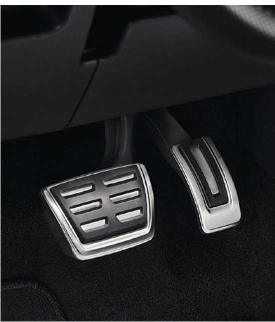
DSG UND PEDALABDECKUNGEN Das automatische 7-Gang-Doppelkupplungsgetriebe DSG sorgt mit sanften und schnellen Gangwechseln für eine maximale Ausnutzung des Motordrehmoments; das DSG und der Allradantrieb harmonisieren perfekt. Die sportliche Anmutung wird durch die stilvollen Pedalabdeckungen aus Stahl noch unterstrichen.