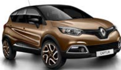
Chocolat-Braun 1 , Dach Black-Pearl-Schwarz