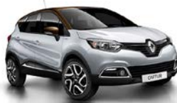
Platin-Grau 1 , Dach Chocolat-Braun