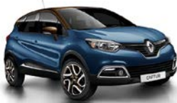
Rauch-Blau 1 , Dach Chocolat-Braun