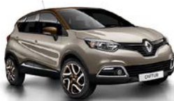
Atacama-Beige 1 , Dach Chocolat-Braun