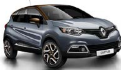
Stahl-Grau 1 , Dach Chocolat-Braun