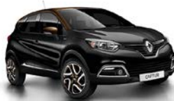
Black-Pearl-Schwarz 2 , Dach Chocolat-Braun