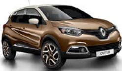
Chocolat-Braun 1 , Dach Ivory-Beige