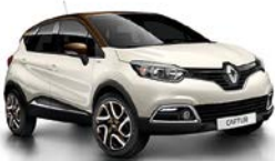
Ivory-Beige 3 , Dach Chocolat-Braun

1 Metallic-Lackierung. 2 Sondermetallic-Lackierung. 3 Sonderlackierung.