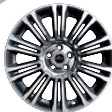
19" STYLE 5