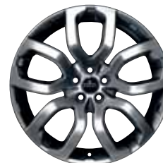
20" STYLE 7