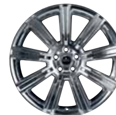
20" STYLE 8