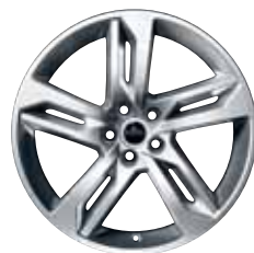
19" STYLE 3