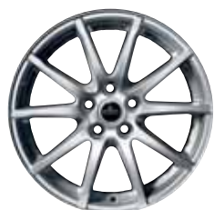
17" STYLE 1

■ Serie □ Option ◇ Option ohne Aufpreis – Nicht lieferbar