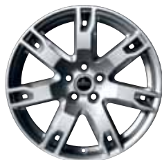
18" STYLE 2