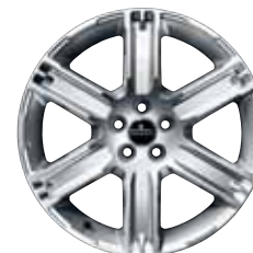
19" STYLE 4