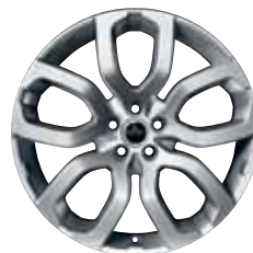
20" STYLE 6