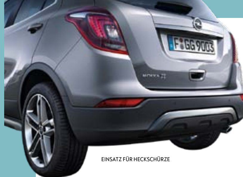
EINSATZ FÜR HECKSCHÜRZE