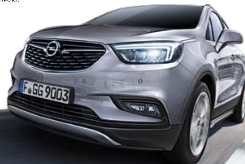
EINSATZ FÜR FRONTSCHÜRZE

Frisch aus dem Opel Performance Center: Die dynamischen Erweiterungen machen aus dem MOKKA X einen unverwechselbaren Charakter mit sportlichem Look. Das OPC Line Sport-Paket beinhaltet Einsätze für Front- und Heckschürze und Seitenschweller. Art.-Nr. 42 547 922