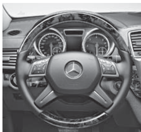
Holz-Leder-Lenkrad, Zierelemente Holz Pappel dunkelgraphit glänzend