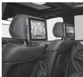
Apple iPad 2® Fond-Integration Plus