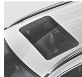
Schiebedach elektrisch in Glasausführung