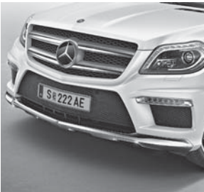
AMG Sport-Paket Exterieur Front