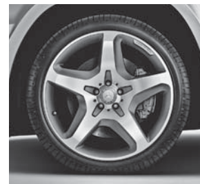
53,3 cm (21") AMG Leichtmetall- räder im 5-Speichen-Design (777)