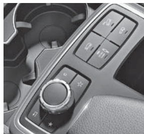
Controller auf Mittelkonsole und Bedienschalter AIRMATIC