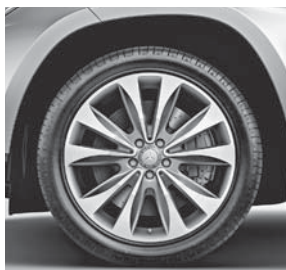
50,8 cm (20\") Leichtmetallr der im 10-Speichen-Design (50R)