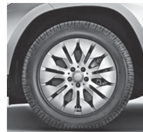
45,7 cm (18\") Leichtmetallr der im 7-Speichen-Design (52R)