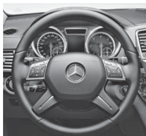
4-Speichen-Multifunktionslenkrad in Leder Nappa