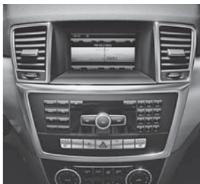
Audio 20 CD