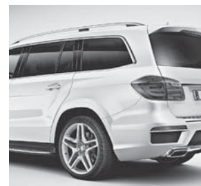
Wärmedämmend dunkel getöntes Glas, rundum ab B-Säule