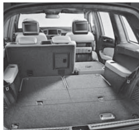
3. Sitzreihe, elektrisch klappbar