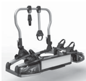
Heckfahrradträger für Anhängervorrichtung