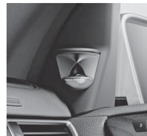
Bang & Olufsen BeoSound AMG