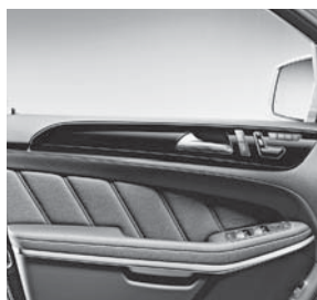
designo Zierelemente Klavierlack schwarz