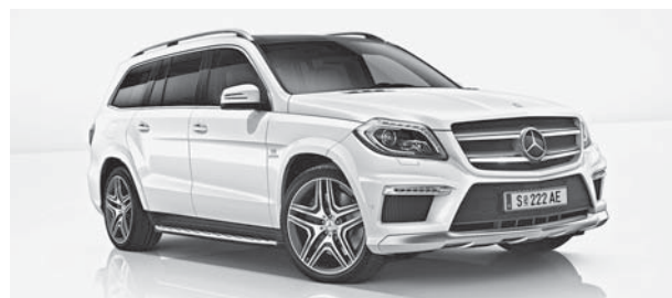
GL 63 AMG 4MATIC, diamantweiß metallic BRIGHT, 53,3 cm (21") AMG Leichtmetallräder im 5-Doppelspeichen-Design (798)