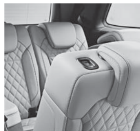
EASY-ENTRY-System elektrisch, links und rechts für 3. Sitzreihe