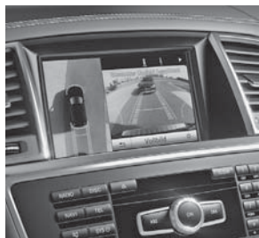
Park-Paket mit 360°-Kamera