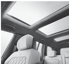
Panorama-Schiebedach elektrisch in Glasausführung