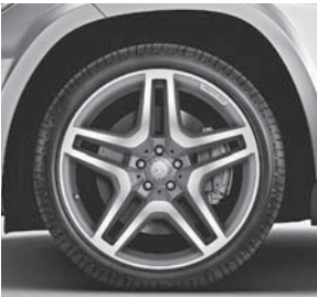
53,3 cm (21") AMG Leichtmetallräder im 5-Doppelspeichen-Design (757)