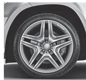
53,3 cm (21\") AMG Leichtmetall- r der im 5-Doppelspeichen-Design (798)