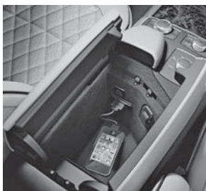
Komfort-Telefonie, Media Interface