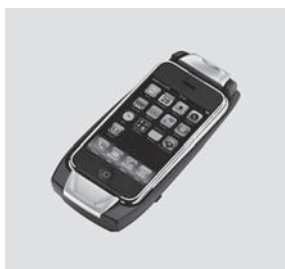
Aufnahmeschale für Apple iPhone®