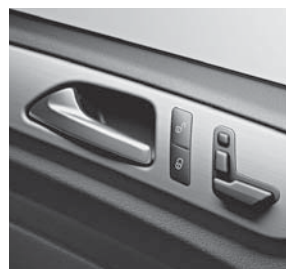
Zentralverriegelung, Vordersitze elektrisch verstellbar