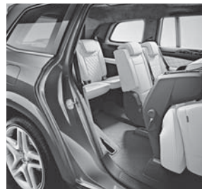
EASY-ENTRY-System mechanisch, links und rechts