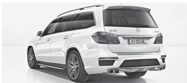
GL 63 AMG 4MATIC, diamantweiß metallic BRIGHT, 53,3 cm (21") AMG Leichtmetallräder im 5-Doppelspeichen-Design (798)