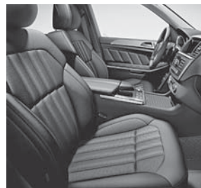
Polsterung in Ledernachbildung ARTICO