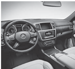
Instrumententafel-Oberteil in Ledernachbildung ARTICO