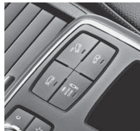
ACTIVE CURVE SYSTEM