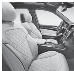
designo Leder exklusiv porzellan