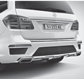
AMG Sport-Paket Exterieur Heck 2)