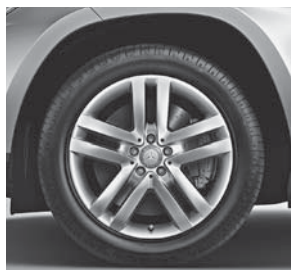
48,3 cm (19\") Leichtmetallr der im 5-Doppelspeichen-Design (R55)