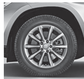
45,7 cm (18") Leichtmetallräder im 10-Speichen-Design (R41)