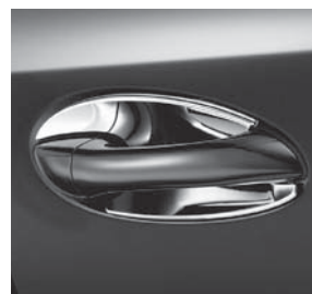
Türgriffschalen, Hochglanz verchromt