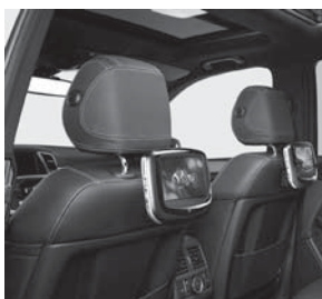
Fond Entertainment System Portable (Double Kit)