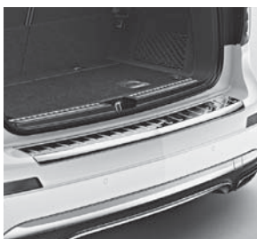
Ladekantenschutz in Chromoptik