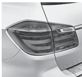
Heckleuchten in LED-Lichtleitertechnik