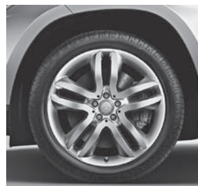
50,8 cm (20\") Leichtmetallr der im 5-Doppelspeichen-Design (R33)