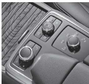
ON & OFFROAD-Paket