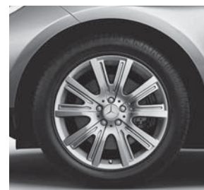
48,3 cm (19") Leichtmetallrad im 5-Doppelspeichen-Design