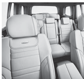
designo Leder exklusiv porzellan (GL 63 AMG 4MATIC)