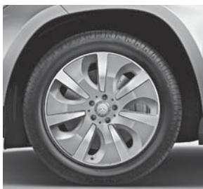
48,3 cm (19\") Leichtmetallr der im 7-Speichen-Design (06R)