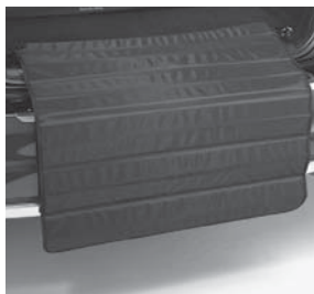
Zick-Zack-Ladekantenschutz (Abbildung ähnlich)