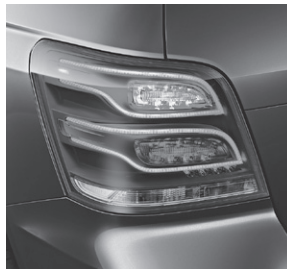
Heckleuchte in LED-Technik