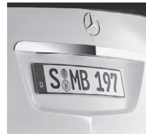
Heckzierleiste, hochglanz verchromt