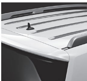
Dachleiste, matt verchromt