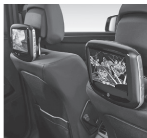
Fond Entertainment System Kit