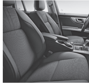
Polsterung Stoff schwarz