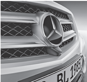
Kühlergrill mit Chromlamellen