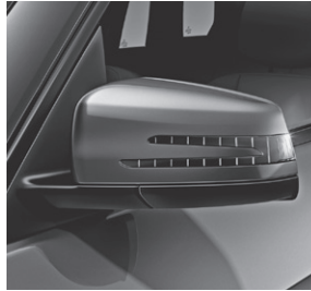
Außenspiegel mit Blinkleuchte