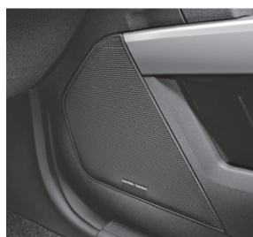
Harman Kardon® Logic7® Surround-Soundsystem