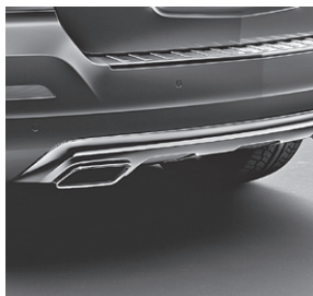
Unterschutz in Chrom (900)