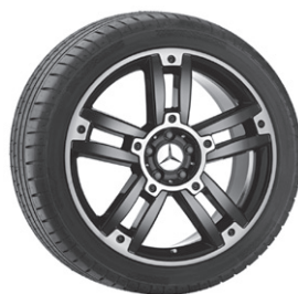
Bigawa, 5-Doppelsp.-Design, schwarz, bicolor