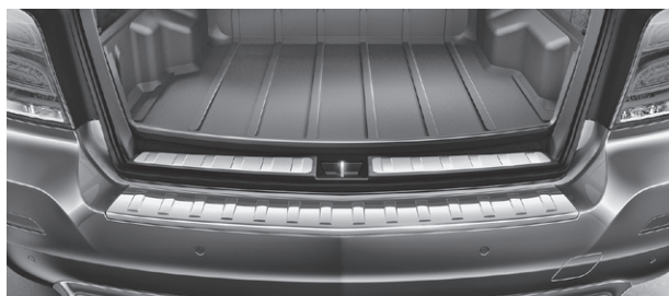
Ladekante in Chromoptik (900)