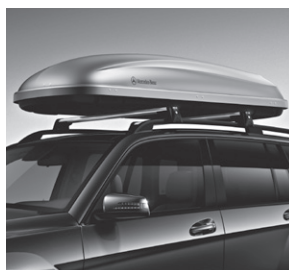
Dachbox, beidseitig öffnend