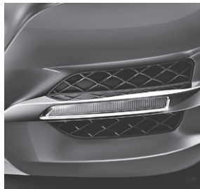
LED-Tagfahrlicht im Frontstoßfänger