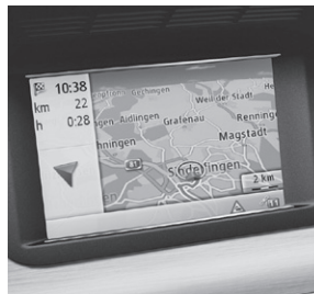
Becker® MAP PILOT