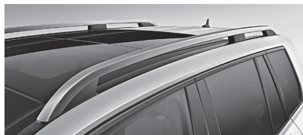
Dachreling in Aluminium (900)