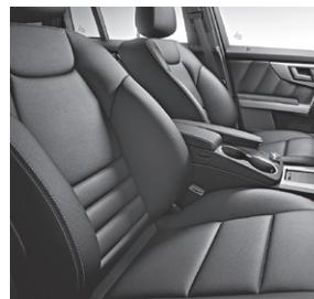
Polsterung/Ledernachbildung ARTICO DINAMICA (P95)