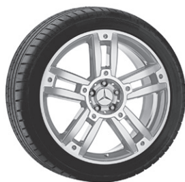
Bigawa, 5-Doppelsp.-Design, titansilber, glanzgedreht