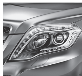
Intelligent Light System