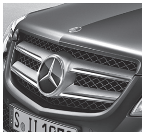
Kühlergrill 2 Chromlamellen (900)