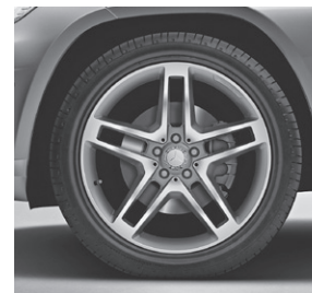
AMG 5-Doppelspeichen-Design (753)