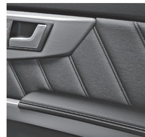
Türmittelfelder in Ledernachbildung ARTICO (P95)